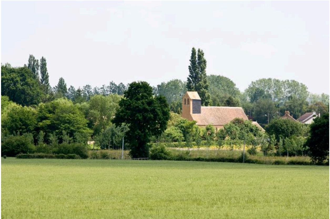
L'église paroissiale vue depuis le hameau de l'Angellerie.