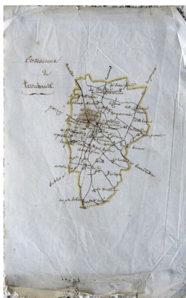
Plan de la paroisse de Terrehault vers 1841. IVR52_20077200694NUCA