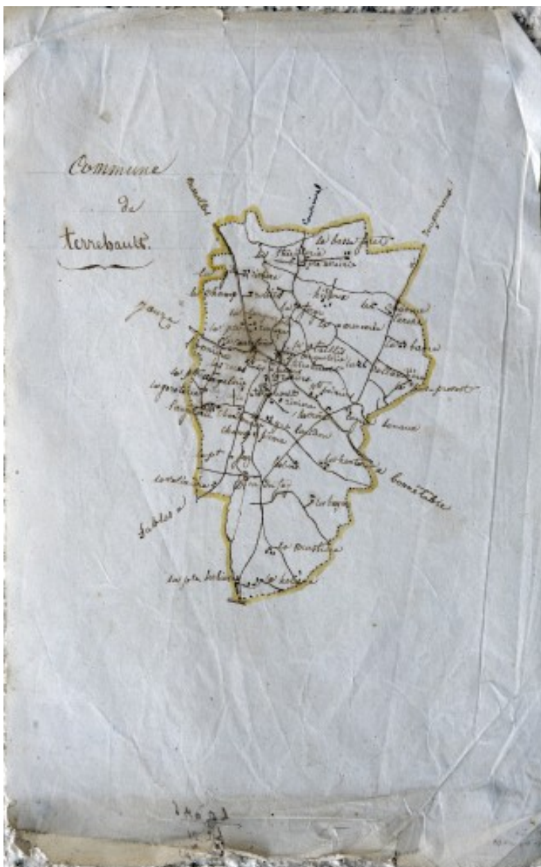
Plan de la paroisse de Terrehault vers 1841.