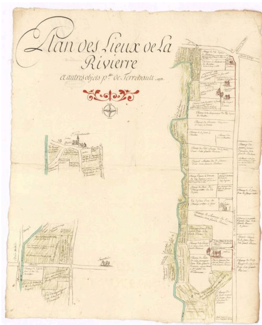
Plan des lieux de la Rivière et autres lieux (la Petite Rivière le Carrefour, Champ Rottier, le bourg et partie de l'Angellerie) en 1773.