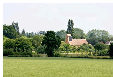
L'église paroissiale vue depuis le hameau de l'Angellerie.