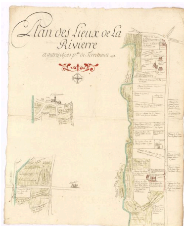
Plan des lieux de la Rivière et autres lieux (la Petite Rivière le Carrefour, Champ Rottier, le bourg et partie de l'Angellerie) en 1773. IVR52_20107200016NUCA