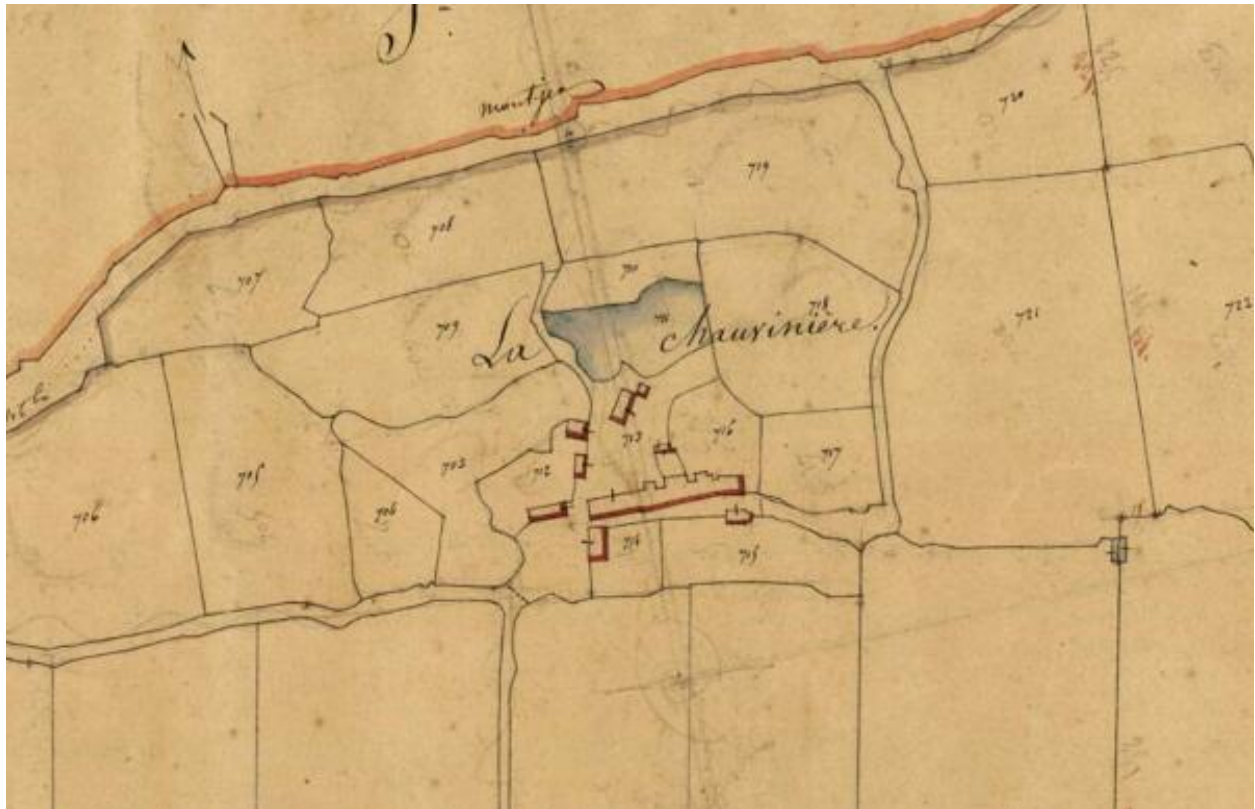
La Chauvinière. Plan cadastral (détail), 1827, section C2, parcelle 713. (AD Maine-et-Loire, 3 P 4/220/11).