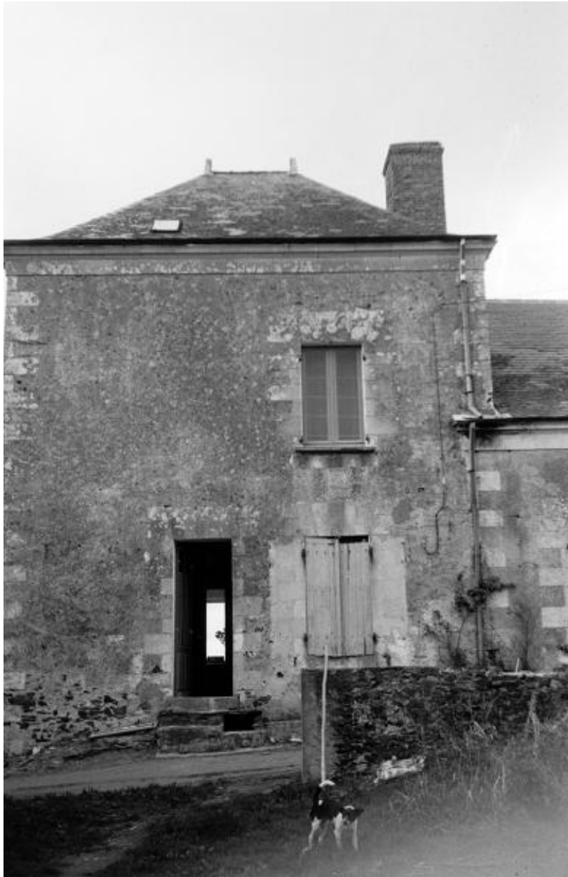
Logis en pavillon, 1972.