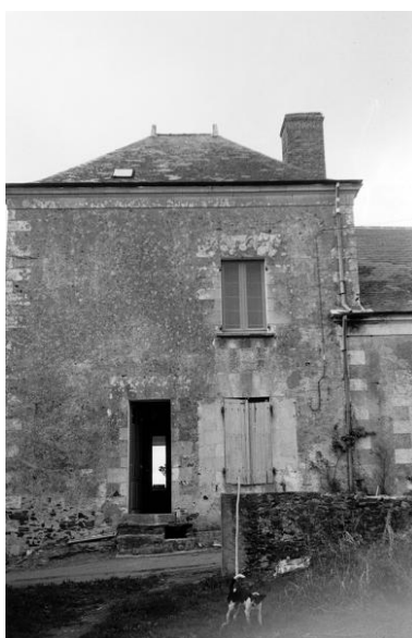
Logis en pavillon, 1972.