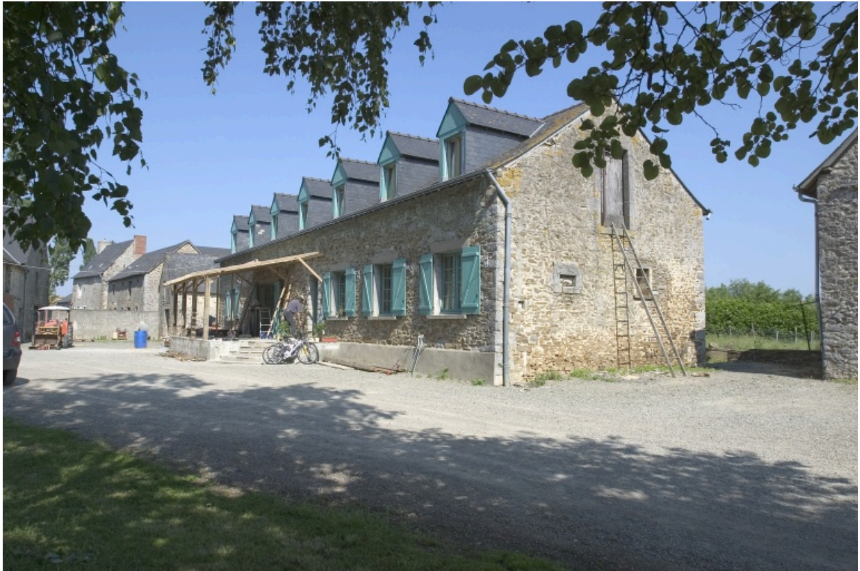
Le logis vu depuis le sud-est.