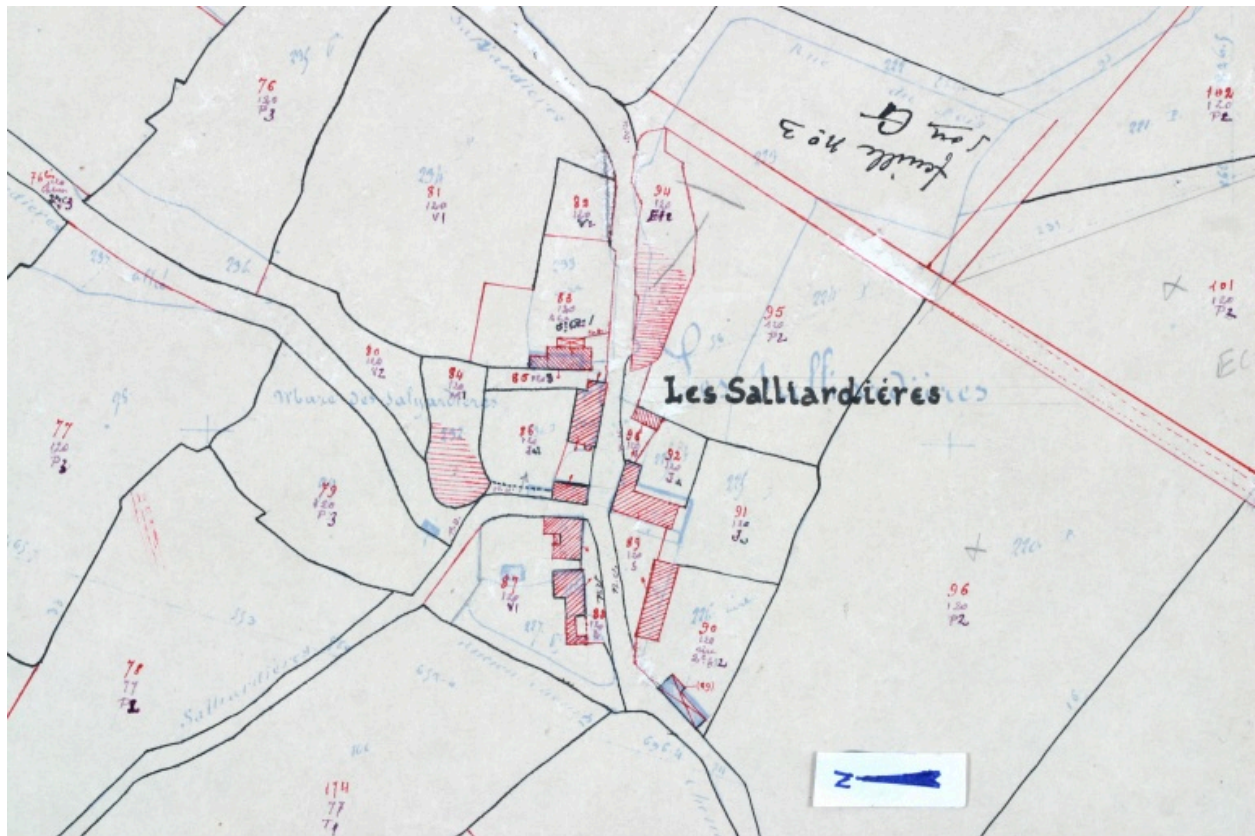
Extrait du plan cadastral de 1936, section G2.