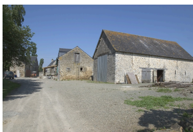
La petite étable vue depuis le sud-est. Au fond les dépendances de l'ancien manoir.