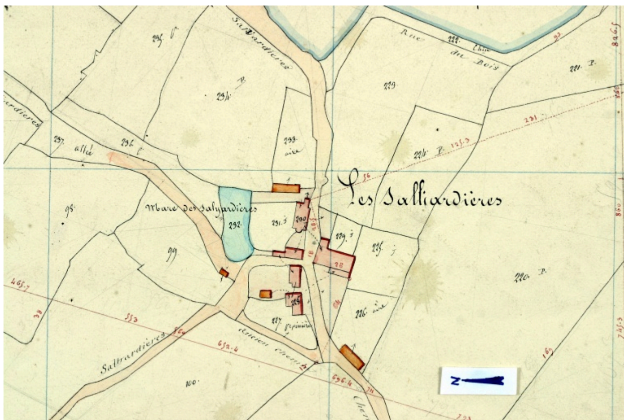
Extrait du plan cadastral de 1842, section G2.