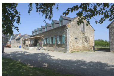
Le logis vu depuis le sud-est.