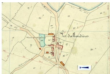
Extrait du plan cadastral de 1842, section G2. IVR52_20045301164NUCA