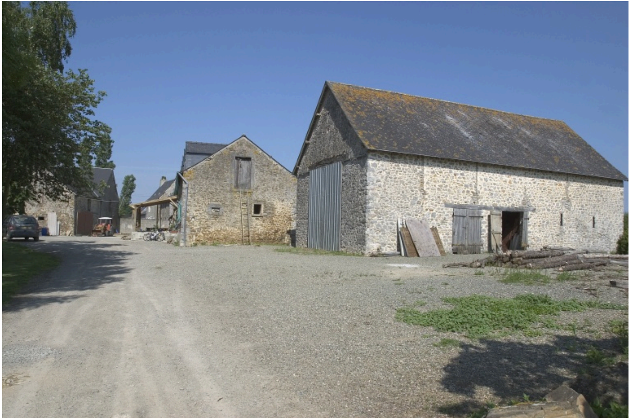
La petite étable vue depuis le sud-est. Au fond les dépendances de l'ancien manoir.