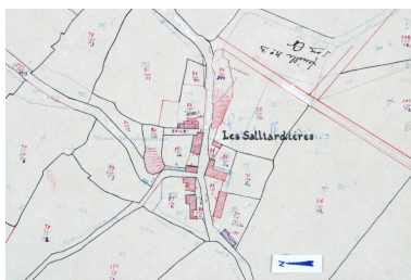
Extrait du plan cadastral de 1936, section G2.