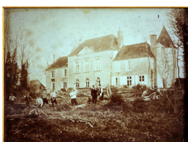
Élévation postérieure, vers 1900. IVR52_20077200152NUCA