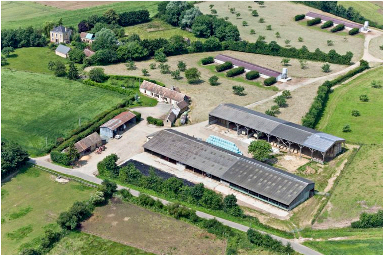
Vue de l'emplacement du château (à l'arrière-plan) et de la ferme depuis l'est.