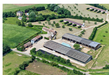
Vue de l'emplacement du château (à l'arrière-plan) et de la ferme depuis l'est.