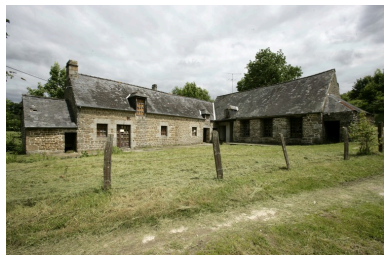
Vue d'ensemble depuis le sud-ouest : le logis et le moulin. IVR52_20075300397NUCA