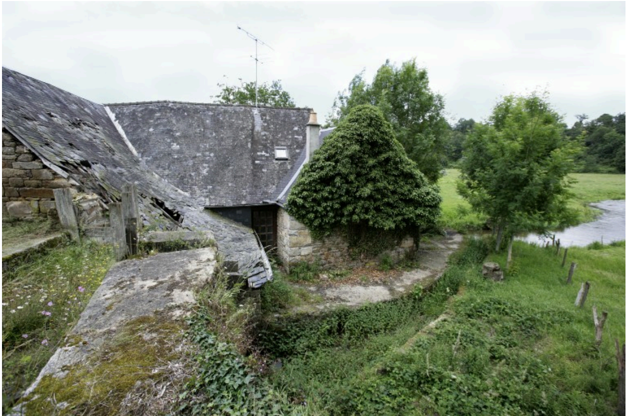
Le moulin vu depuis l'est. A gauche, l'extrémité du canal d'alimentation ; à droite, le canal de décharge ; au fond, la rivière.