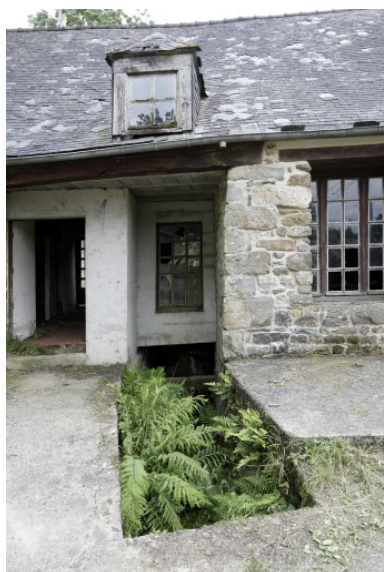
Vue partielle du moulin depuis l'ouest : l'emplacement du canal de fuite. IVR52_20075300399NUCA