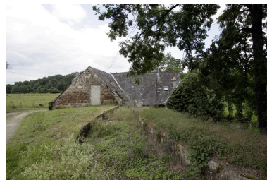
Le moulin vu depuis l'est. Au premier plan, le canal d'alimentation.