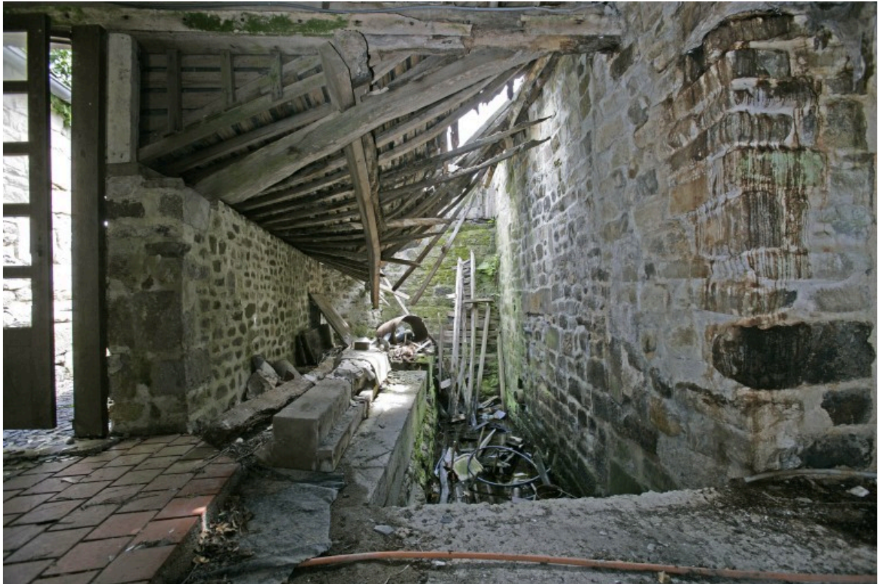
Vue intérieure du moulin depuis l'ouest : l'emplacement des roues.