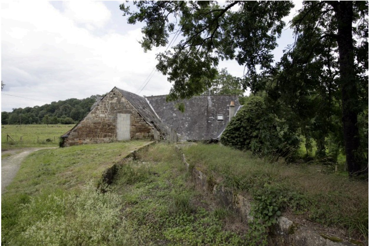
Le moulin vu depuis l'est. Au premier plan, le canal d'alimentation.