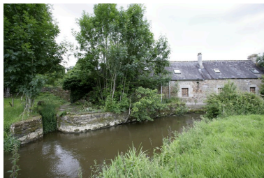
Le logis vu depuis le nord. A gauche l'endroit où le canal de décharge rejoignait la rivière.