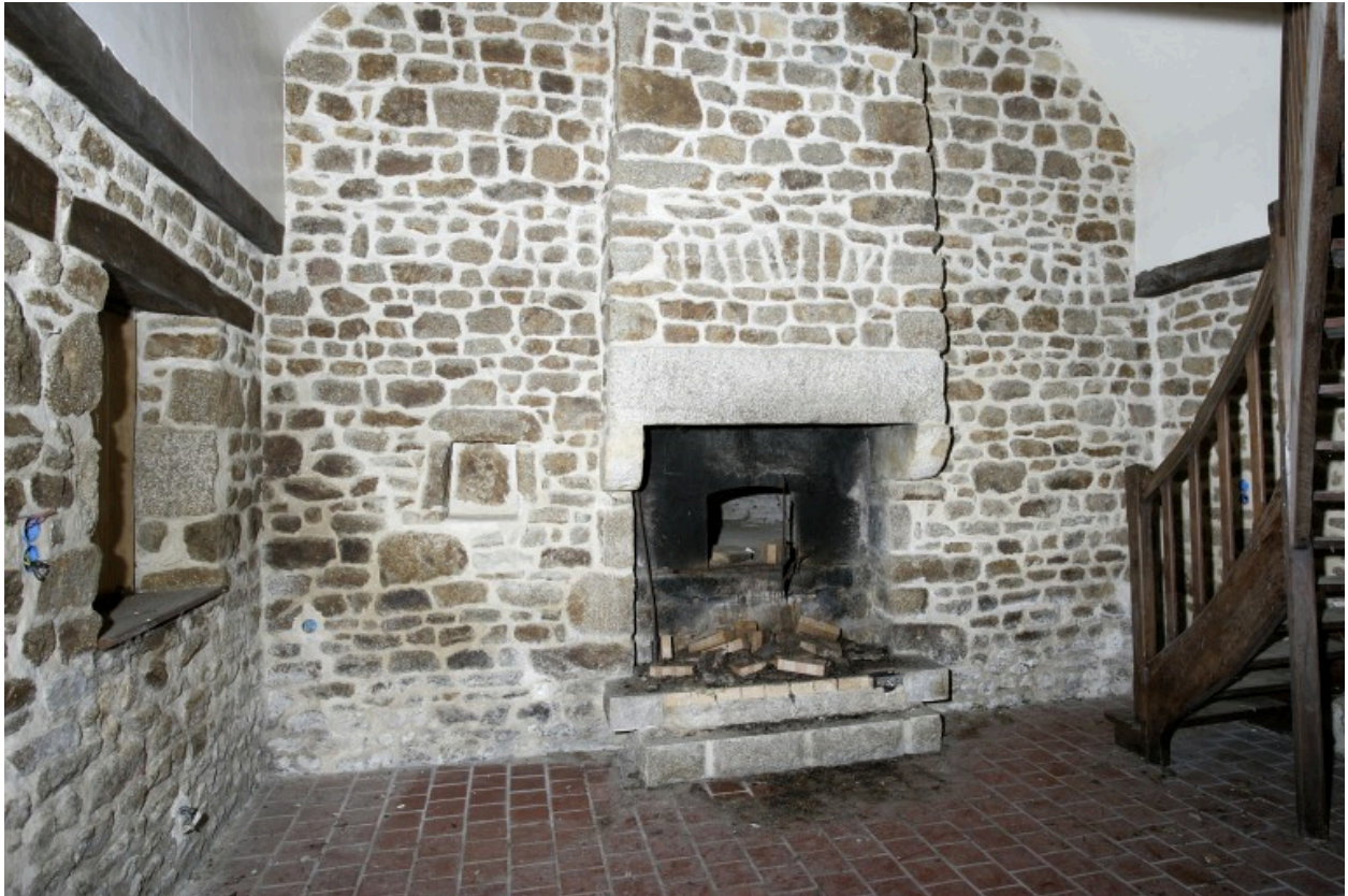
Vue intérieure du logis : la cheminée de la pièce ouest vue depuis l'est.