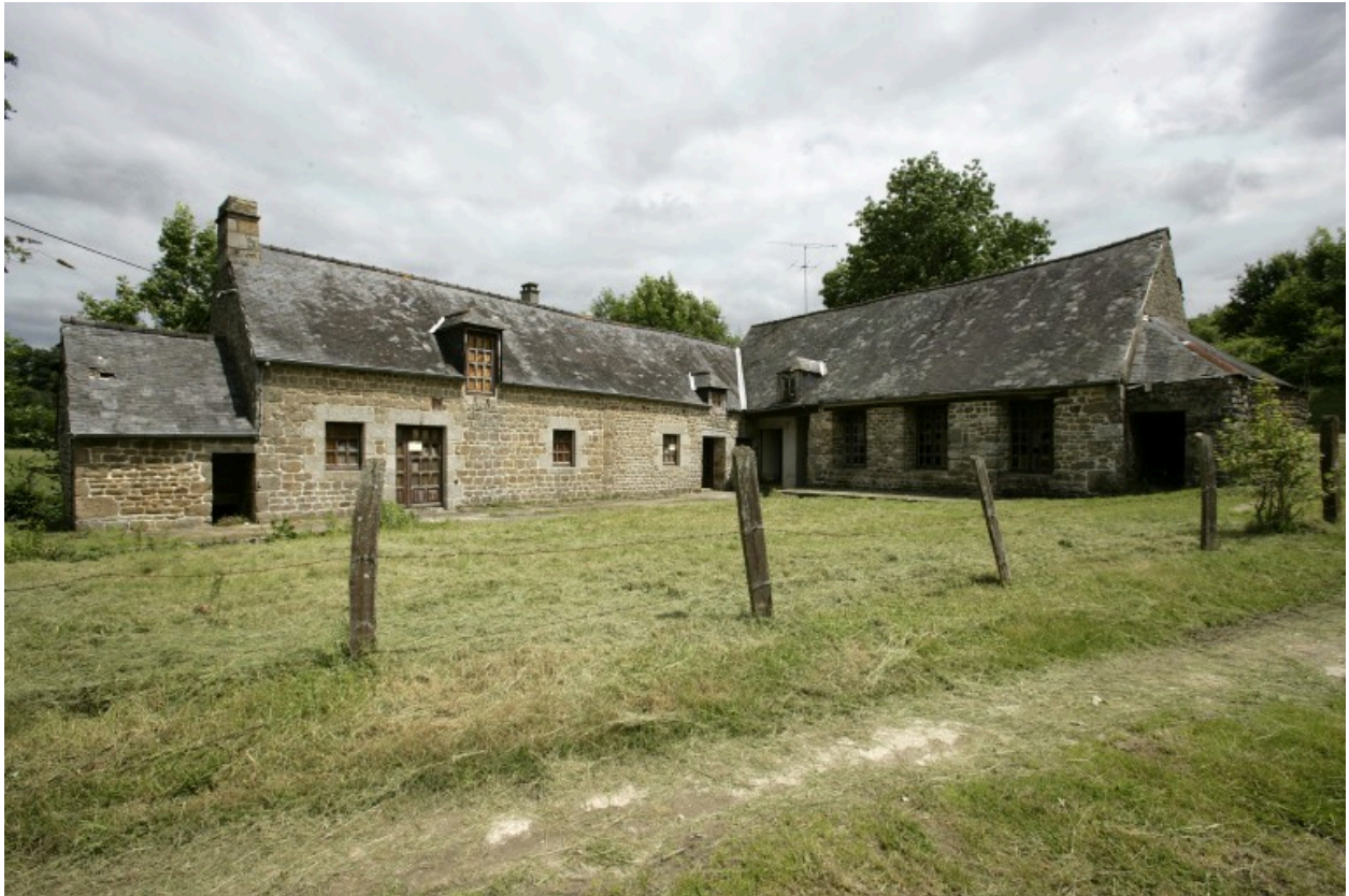
Vue d'ensemble depuis le sud-ouest : le logis et le moulin.