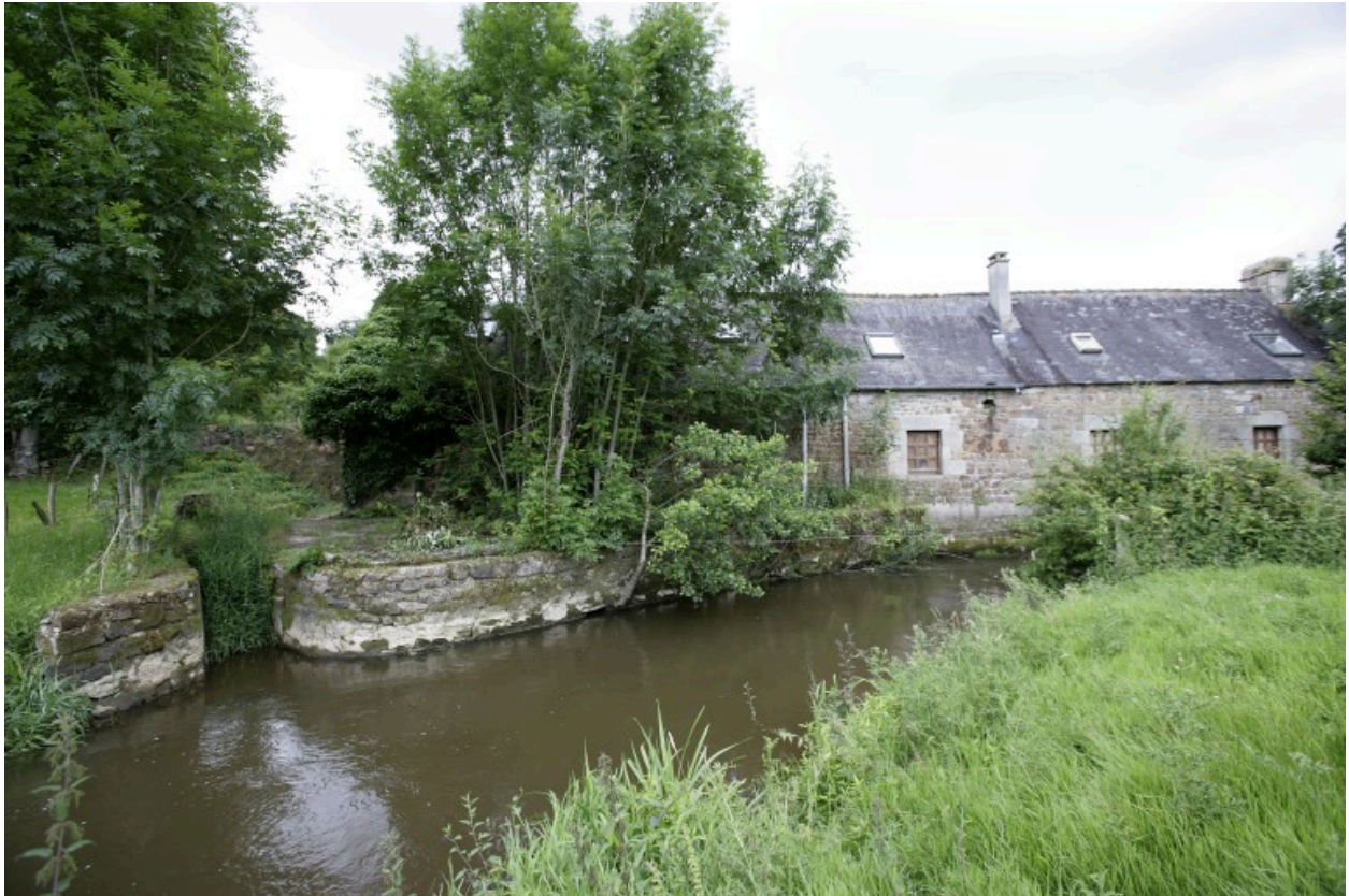
Le logis vu depuis le nord. A gauche l'endroit où le canal de décharge rejoignait la rivière.