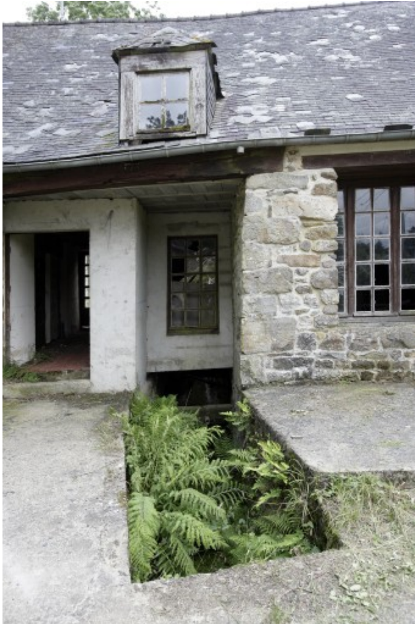
Vue partielle du moulin depuis l'ouest : l'emplacement du canal de fuite.