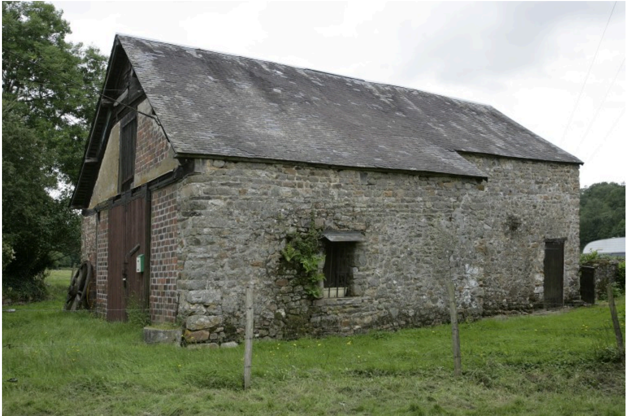
L'ancien logis, puis étable, vu depuis le nord-est.