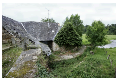
Le moulin vu depuis l'est. A gauche, l'extrémité du canal d'alimentation ; à droite, le canal de décharge ; au fond, la rivière.