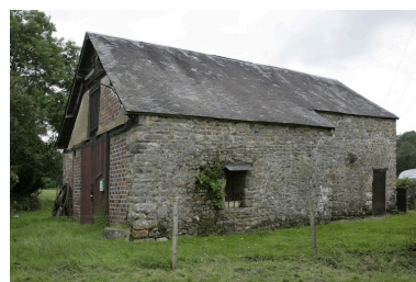
L'ancien logis, puis étable, vu depuis le nord-est. IVR52_20075300402NUCA