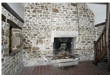
Vue intérieure du logis : la cheminée de la pièce ouest vue depuis l'est.