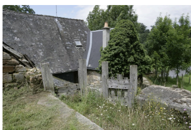
L'extrémité du canal d'alimentation : à gauche, la vanne d'alimentation des roues ; à droite, la vanne de décharge. IVR52_20075300396NUCA