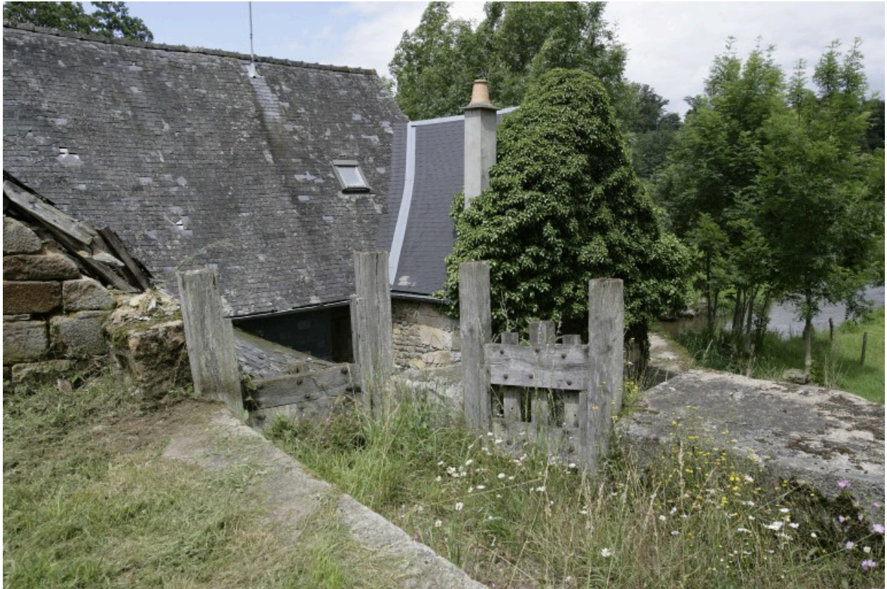
L'extrémité du canal d'alimentation : à gauche, la vanne d'alimentation des roues ; à droite, la vanne de décharge.