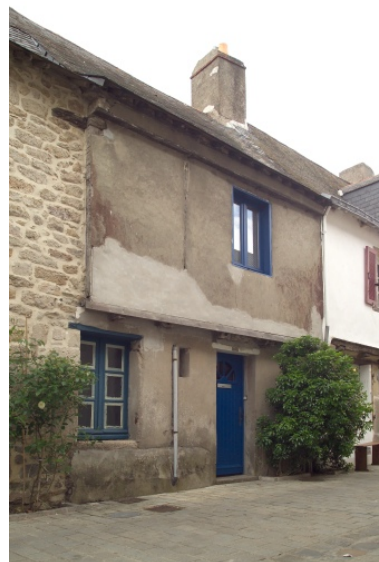
Partie arrière donnat dans la rue de la Psalette. IVR52_20064402526NUCA