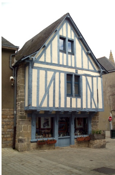
Vue de la façade à pignon. IVR52_20064402524NUCA