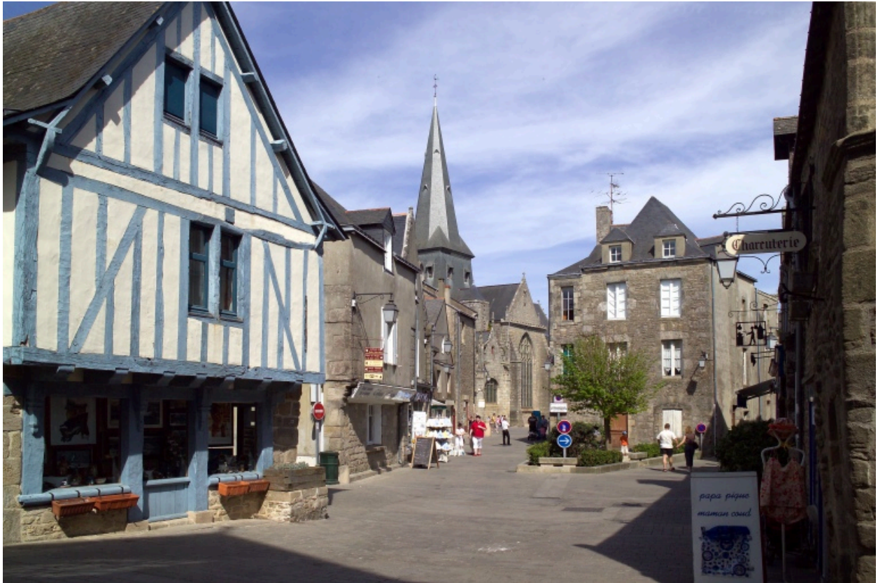
Vue générale de la place du Piloni.