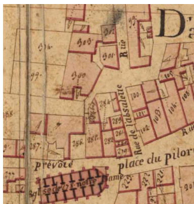
Extrait du plan cadastral de 1819, section Z, parcelles 279 à 281. IVR52_20074405150NUCA