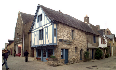
Vue générale vers le Nord-Ouest. IVR52_20064402525NUCA