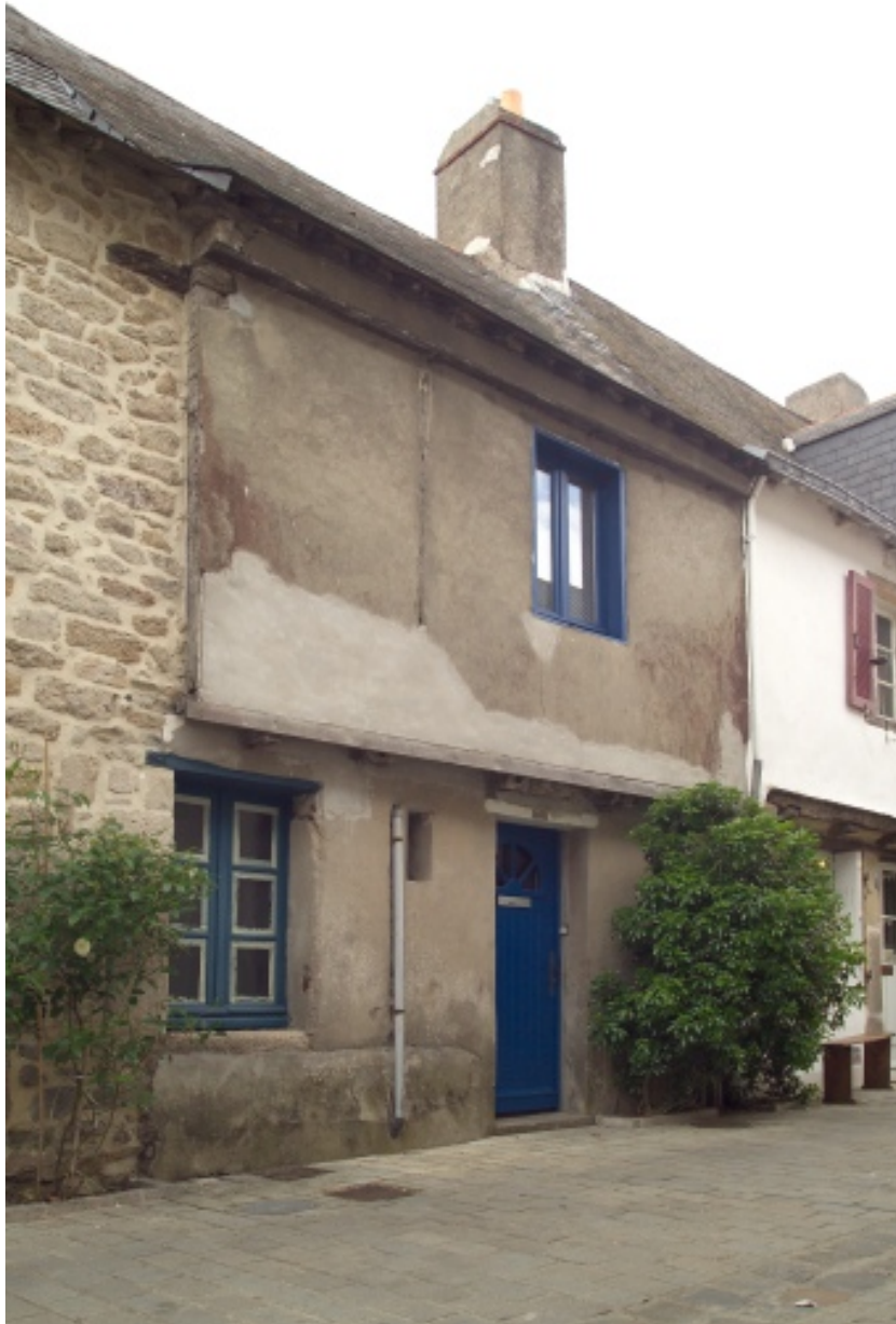
Partie arrière donnat dans la rue de la Psalette.