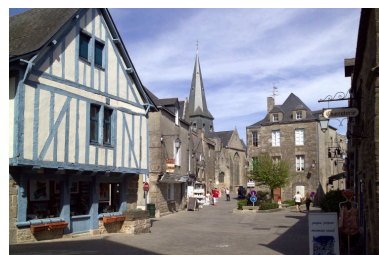
Vue générale de la place du Pilori.