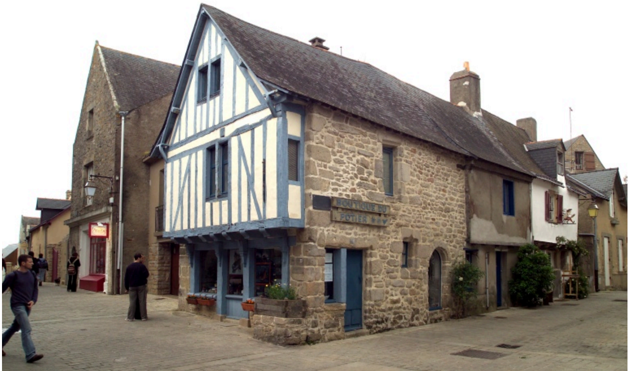
Vue générale vers le Nord-Ouest.