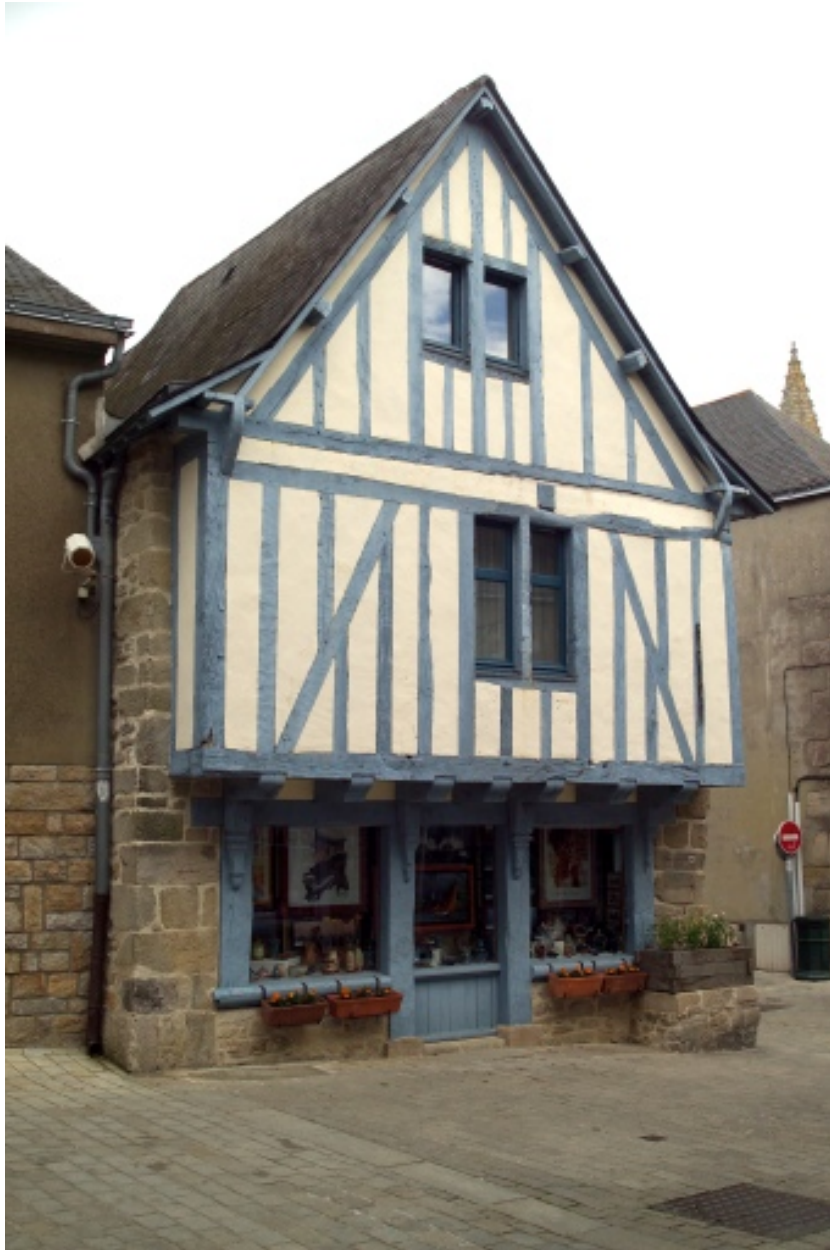
Vue de la façade à pignon.