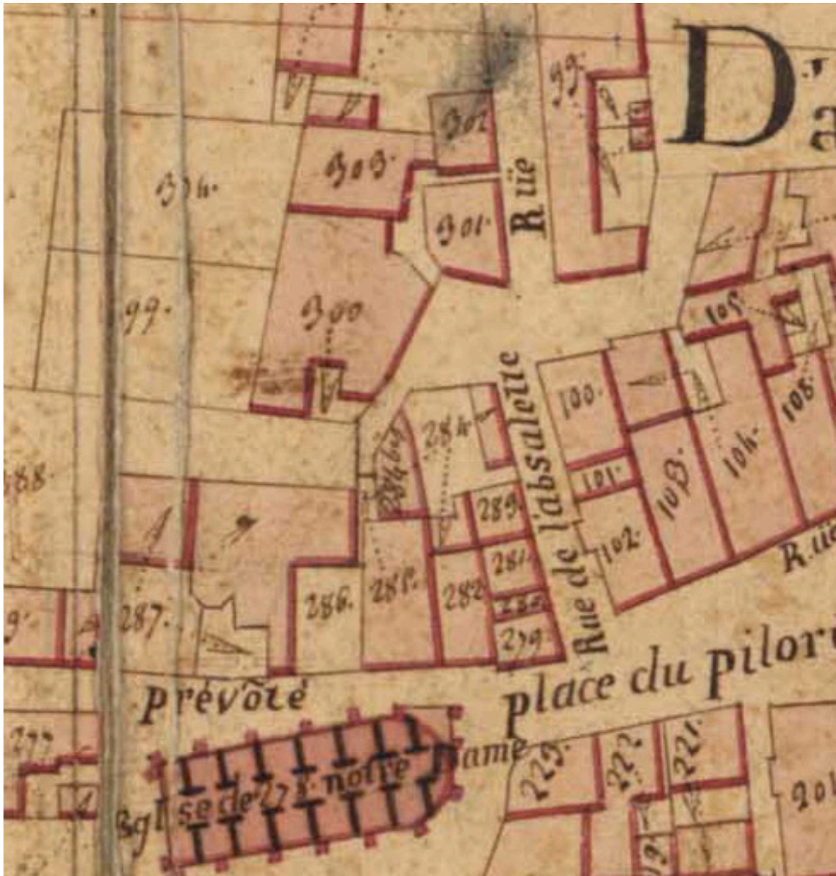
Extrait du plan cadastral de 1819, section Z, parcelles 279 à 281.