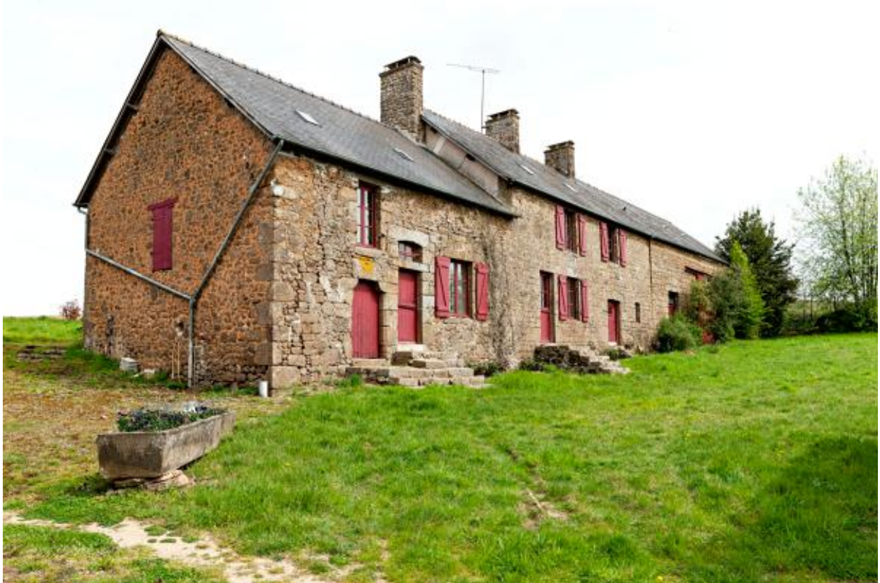
Alignement de deux logis et d'une grange-étable.