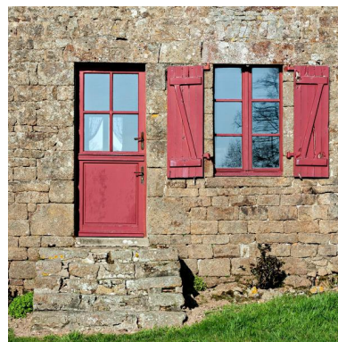
Alignement de deux logis et d'une grange-étable, porte et fenêtre du logis central.