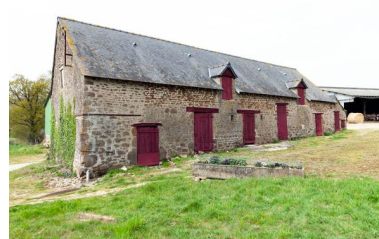
Alignement d'étables-fenils.