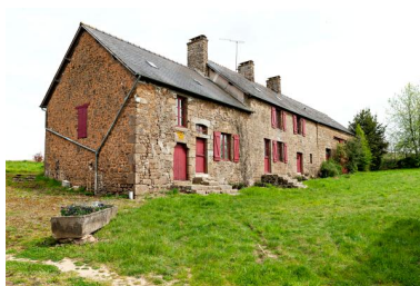
Alignement de deux logis et d'une grange-étable.