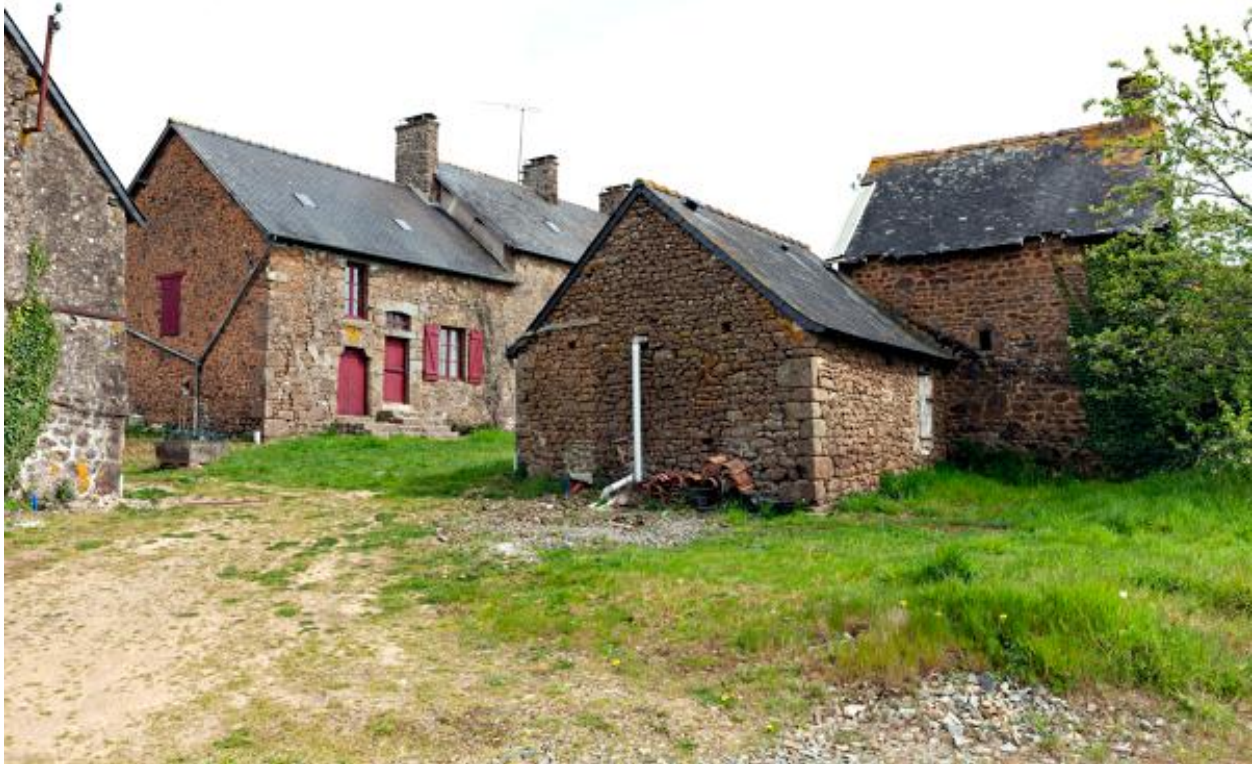
Ferme nord du village de Remieu, étable-fournil au premier plan.