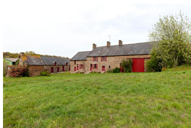
Ferme nord du village de Remieu, vue d'ensemble.