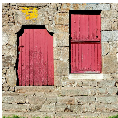
Alignement de deux logis et d'une grange-étable, portes du logis est. IVR52_20195300327NUCA