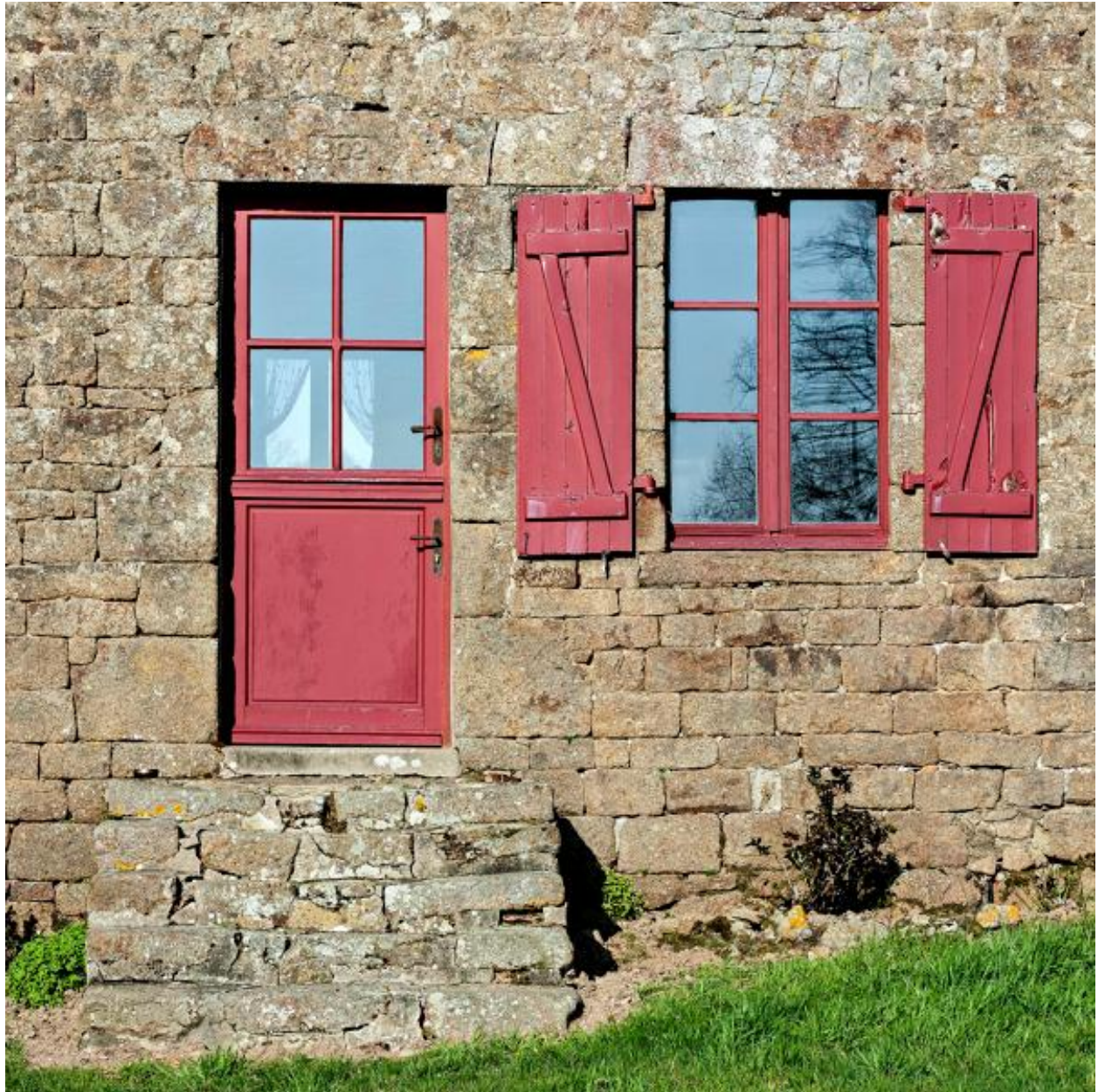
Alignement de deux logis et d'une grange-étable, porte et fenêtre du logis central.