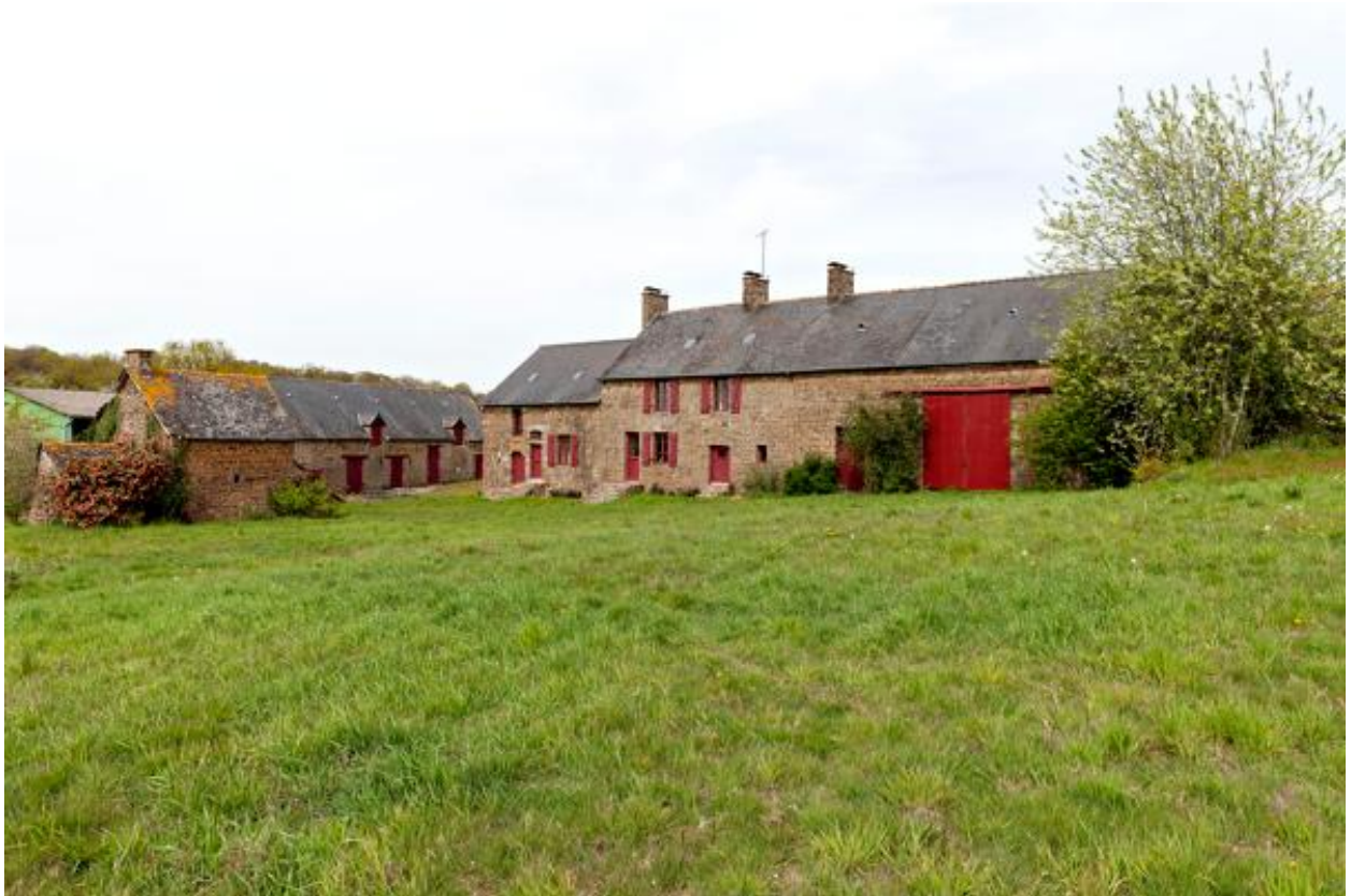
Ferme nord du village de Remieu, vue d'ensemble.