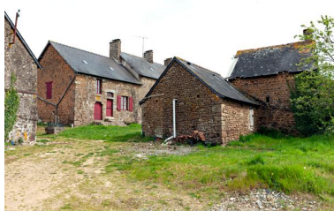
Ferme nord du village de Remieu, étable-fournil au premier plan. IVR52_20195300497NUCA