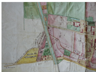
La partie ouest du bourg sur le plan terrier de la commanderie en 1789.

IVR52_20188500322NUCA