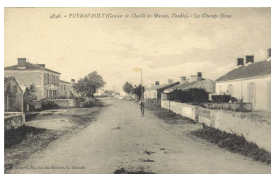
La rue Galerne, au croisement avec la rue de la Forge, vue en direction de l'ouest, début du 20e siècle.

IVR52_20178500245NUCA