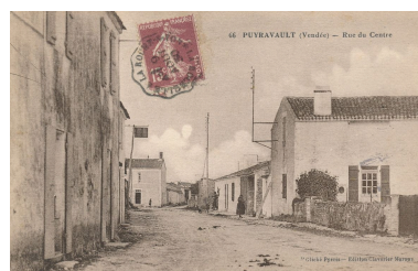
La rue de la Forge vue en direction de l'ouest vers 1930.

IVR52_20188500347NUCA