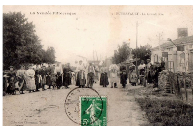
La rue Galerne, près du croisement avec la rue de la Forge, vue en direction de l'ouest, vers 1910.

Repro. Yannis Suire IVR52_20188500330NUCA