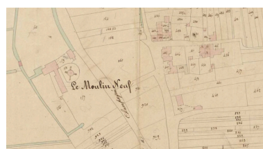
Extrait du plan cadastral de 1834 : la rue Galerne et la rue du Sablon.

Repro. Yannis Suire IVR52_20178500242NUCA