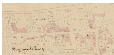
Extrait du plan cadastral de 1834 : la rue des Templiers.

IVR52_20188500325NUCA