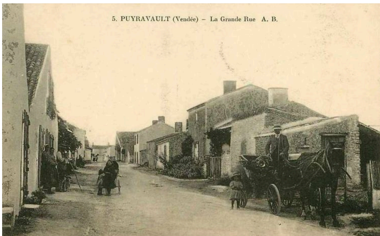
La rue des Templiers, vers les numéros 14 et 17, vue en direction du nord vers 1910.