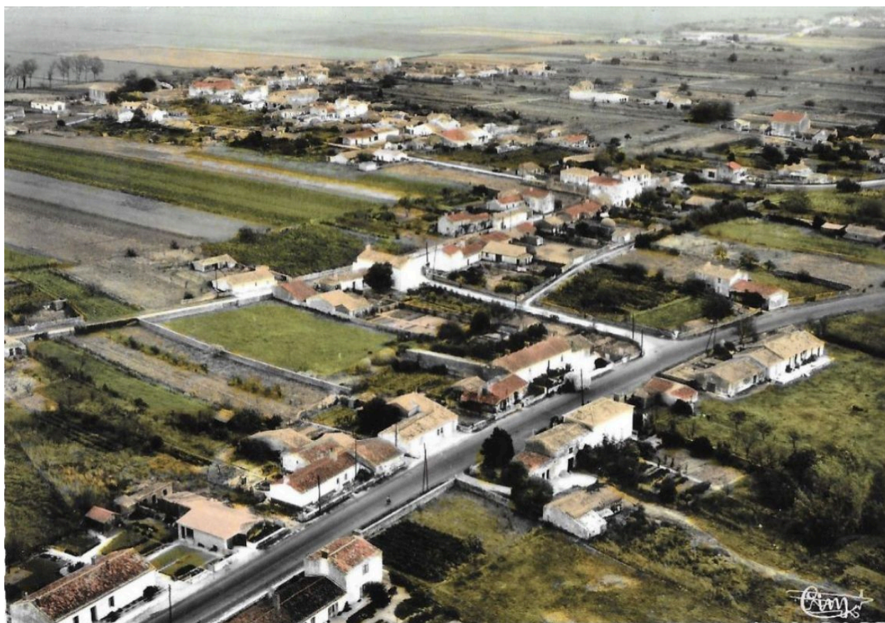
Vue aérienne du bourg depuis le sud-ouest vers 1970.