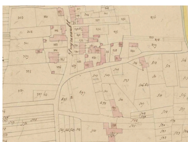
Extrait du plan cadastral de 1834 : la rue de la Voie et l'impasse de la Mairie.

Repro. Yannis Suire IVR52_20178500241NUCA