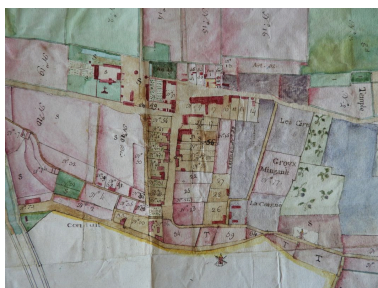
Le bourg sur le plan terrier de la commanderie en 1789.

IVR52_20188500322NUCA