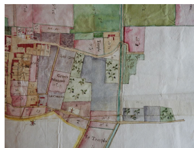
La partie est du bourg sur le plan terrier de la commanderie en 1789.

Repro. Yannis Suire IVR52_20188500323NUCA