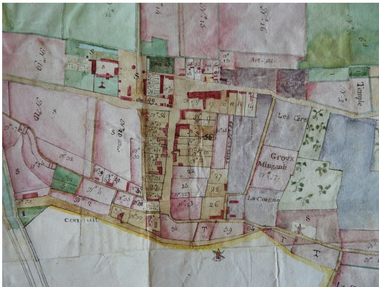
Le bourg sur le plan terrier de la commanderie en 1789.