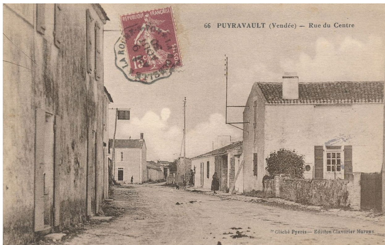
La rue de la Forge vue en direction de l'ouest vers 1930.