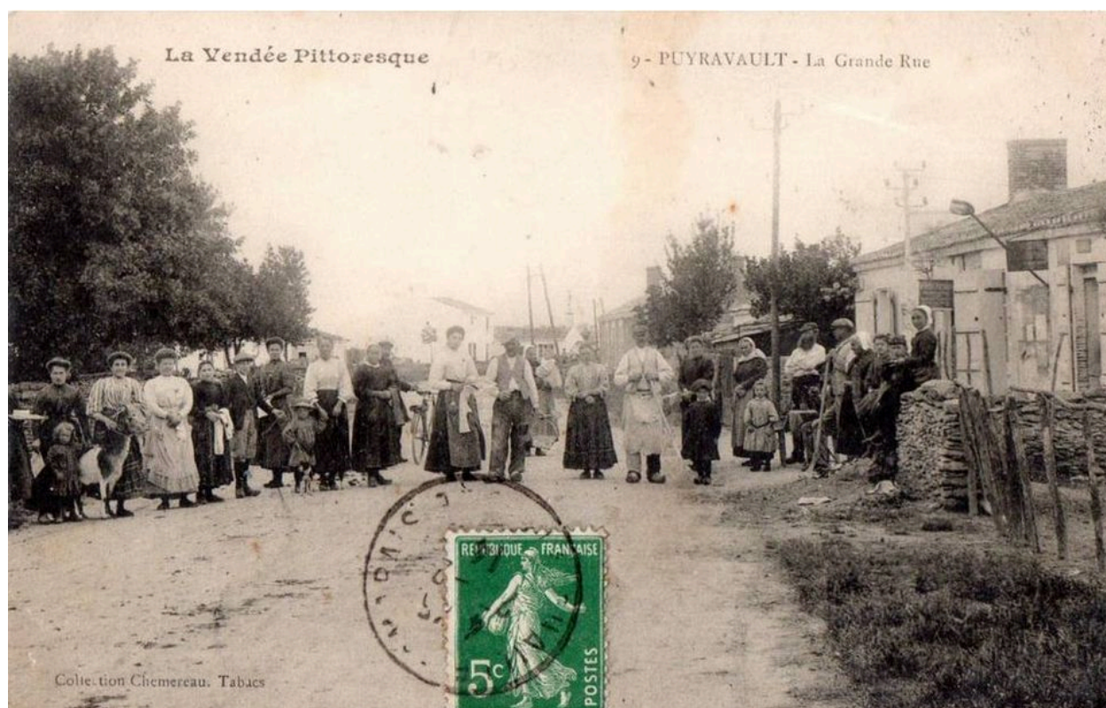
La rue Galerne, près du croisement avec la rue de la Forge, vue en direction de l'ouest, vers 1910.