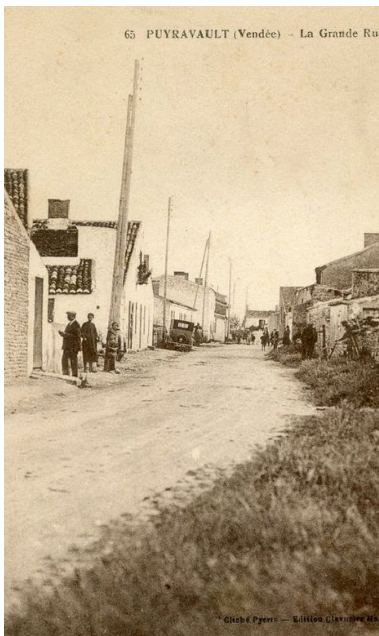
La rue des Templiers, au niveau du numéro 22, vue en direction du nord vers 1930.