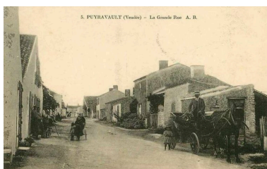
La rue des Templiers, vers les numéros 14 et 17, vue en direction du nord vers 1910.

Repro. Yannis Suire IVR52_20188500338NUCA