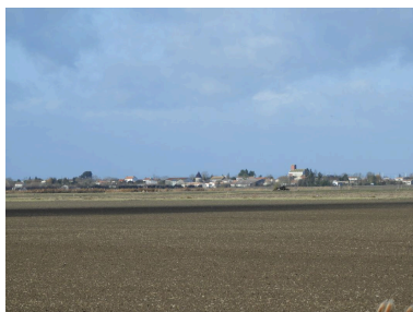
Le bourg, développé sur une faible surélévation, vu depuis le sud-est.

IVR52_20188500343NUCA