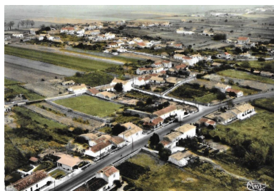
Vue aérienne du bourg depuis le sud-ouest vers 1970.

IVR52_20188500340NUCA