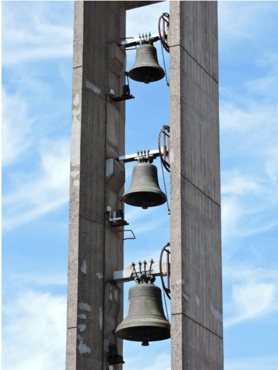
Les trois cloches dans le clocher.