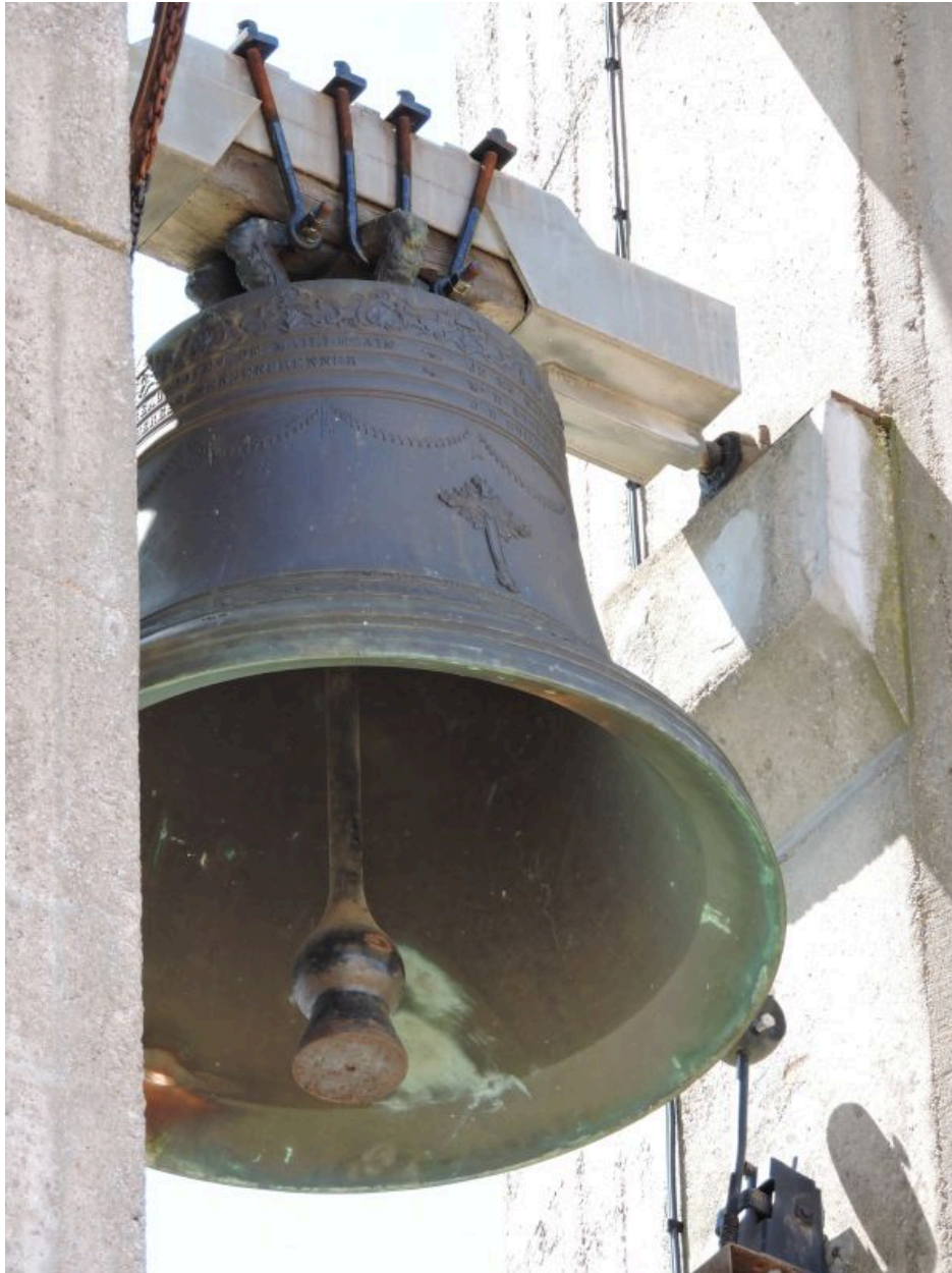
La cloche vue depuis l'est.