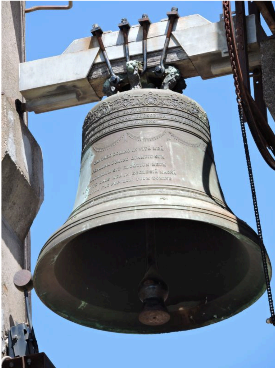
La grosse cloche dans le clocher de l'église de Vix, vue depuis le sud.