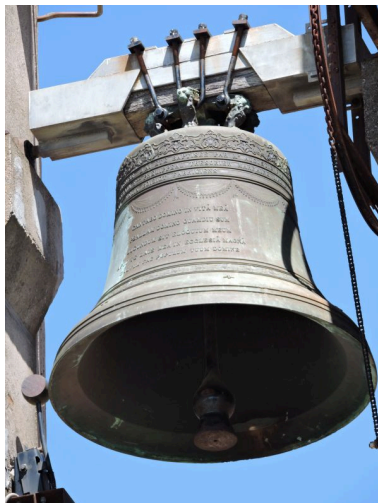
La grosse cloche dans le clocher de l'église de Vix, vue depuis le sud.