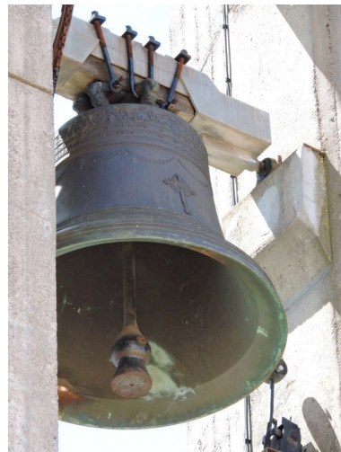
La cloche vue depuis l'est.