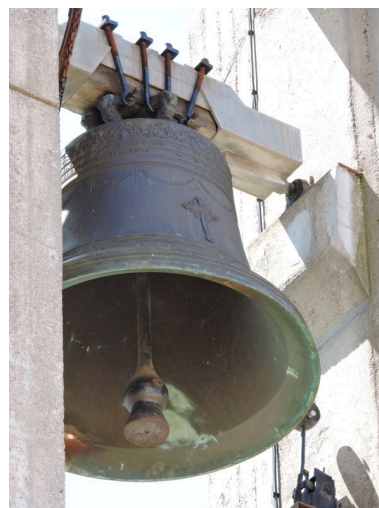
La cloche vue depuis l'est. IVR52_20198501249NUCA