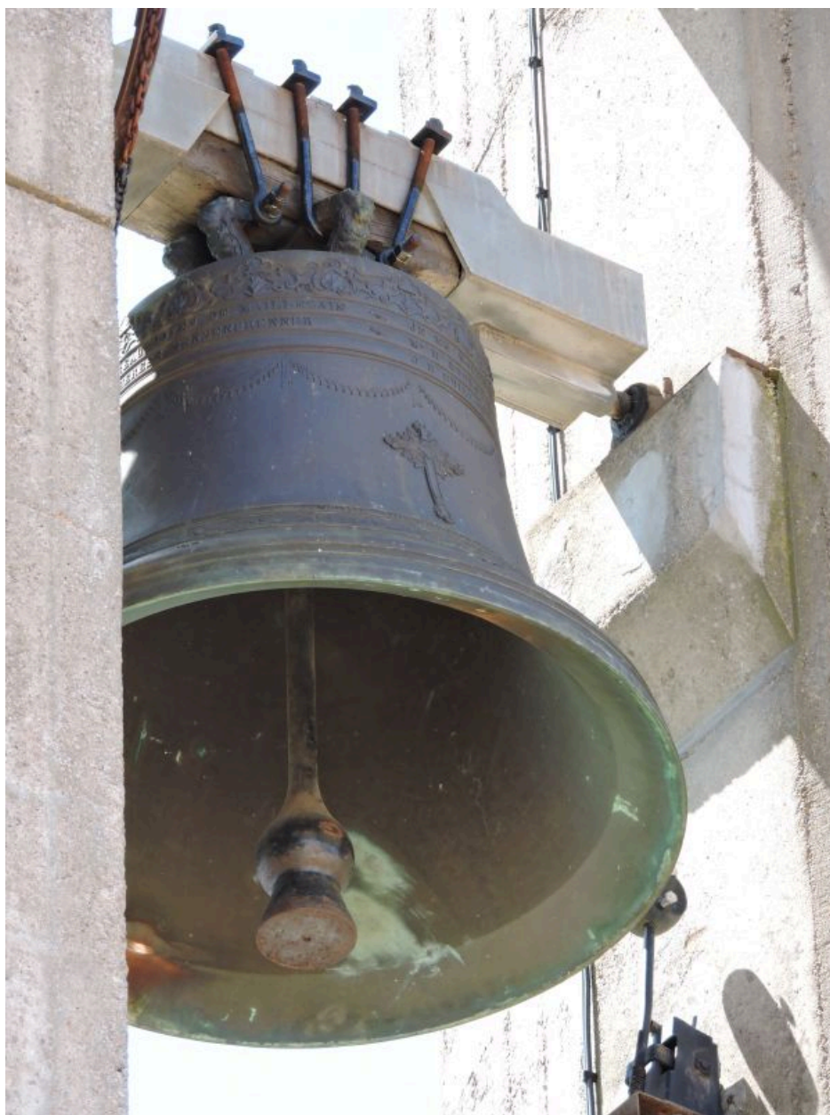
La cloche vue depuis l'est.