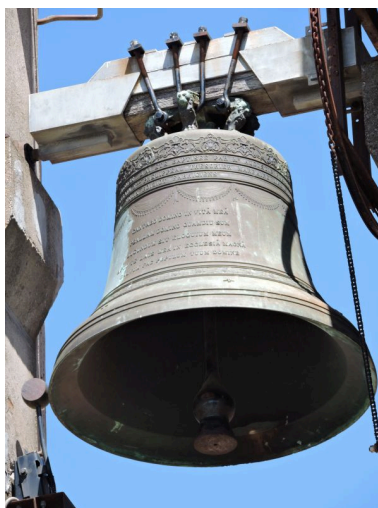
La grosse cloche dans le clocher de l'église de Vix, vue depuis le sud.