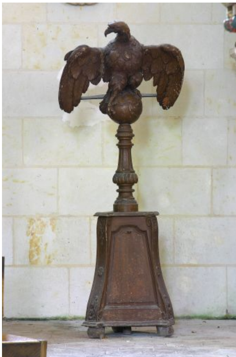
Lutrin, vue d'ensemble.