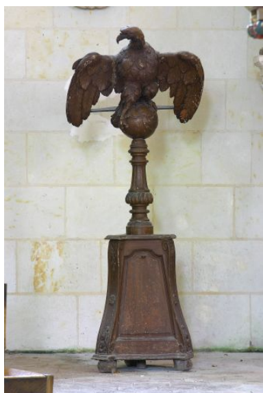
Lutrin, vue d'ensemble. IVR52_20047204229NUCA