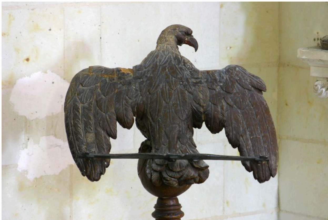
Lutrin, détail de l'aigle.