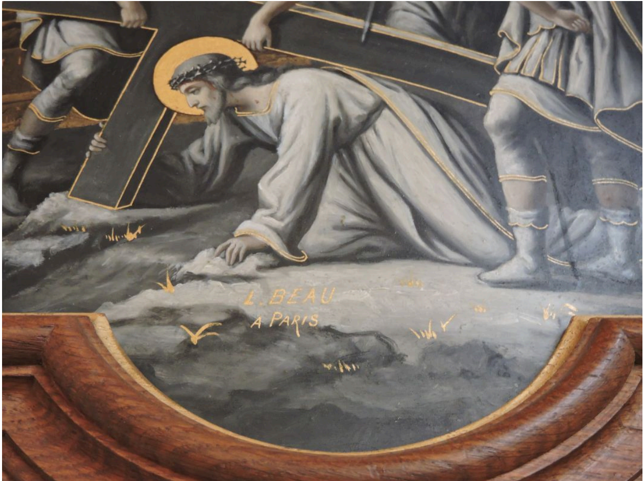
Signature de L. Beau sur la 7e station.