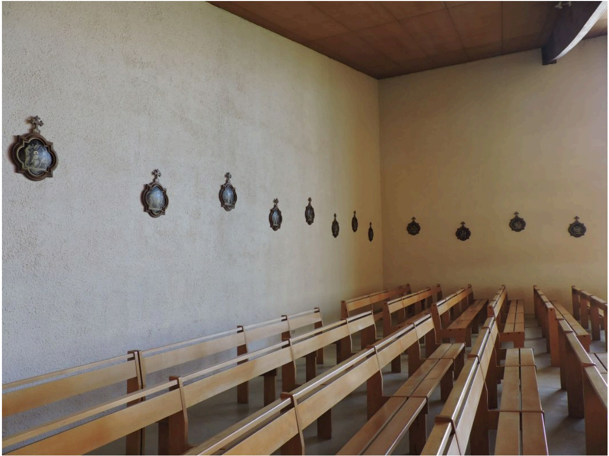
Le chemin de croix sur les murs ouest et nord de l'église.