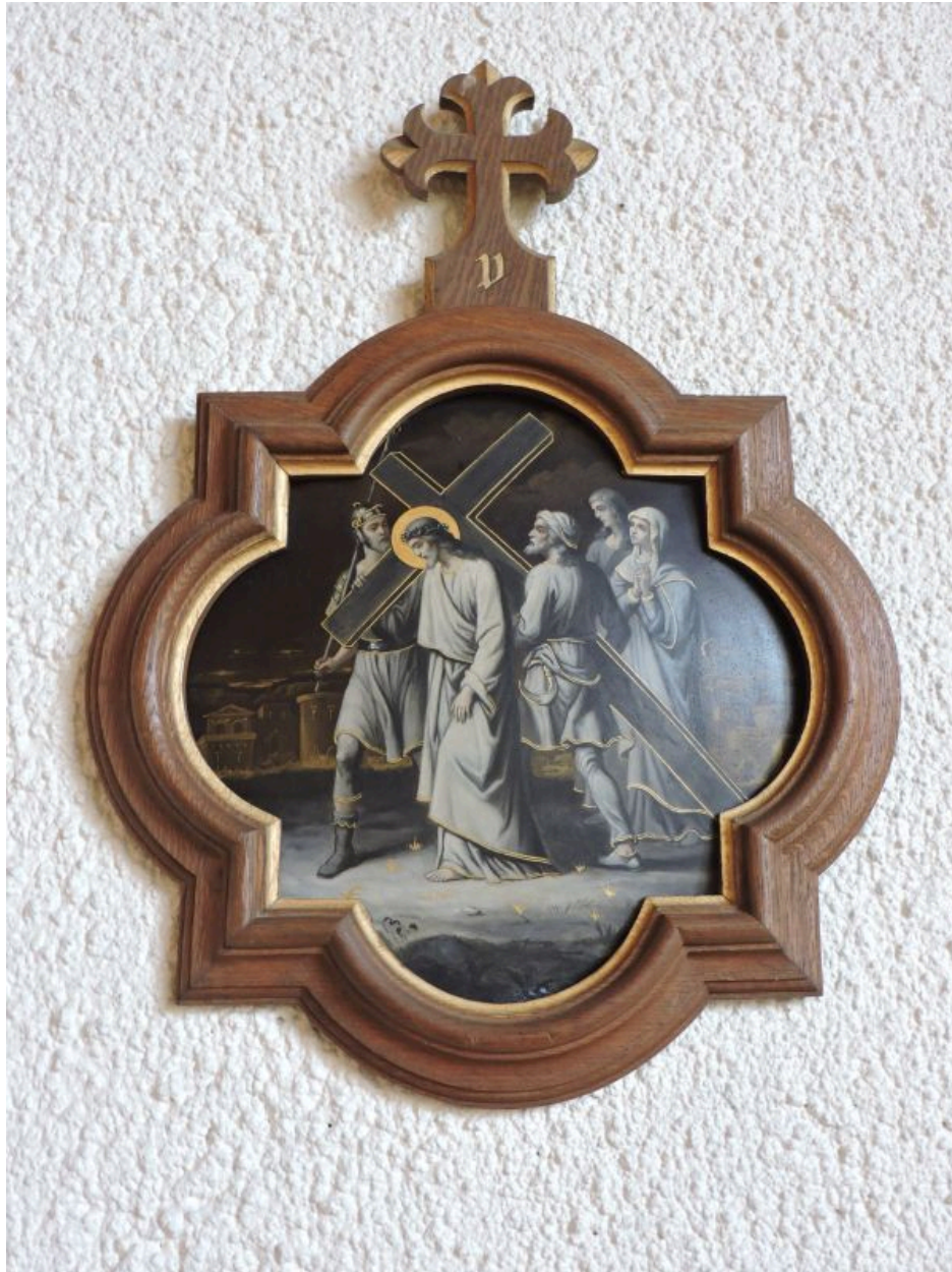
Exemple de station, la 5e.