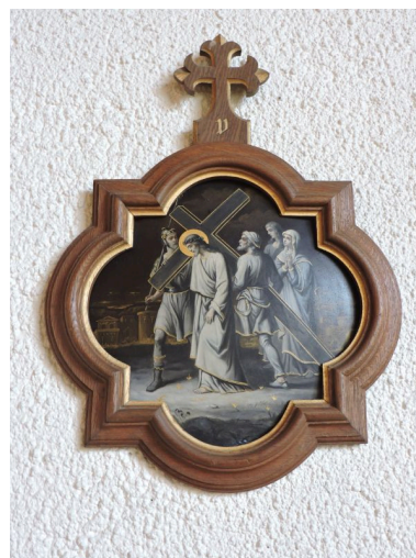
Exemple de station, la 5e.