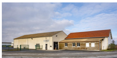
Vue générale, depuis la rue des Alouettes. IVR52_20224400021NUCA