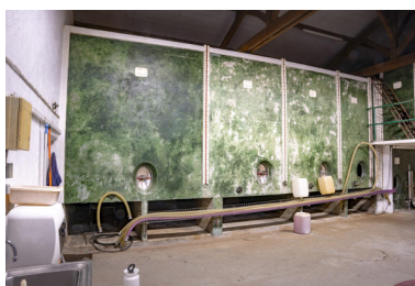
Cuverie principale, depuis le sud-est. IVR52_20224400027NUCA