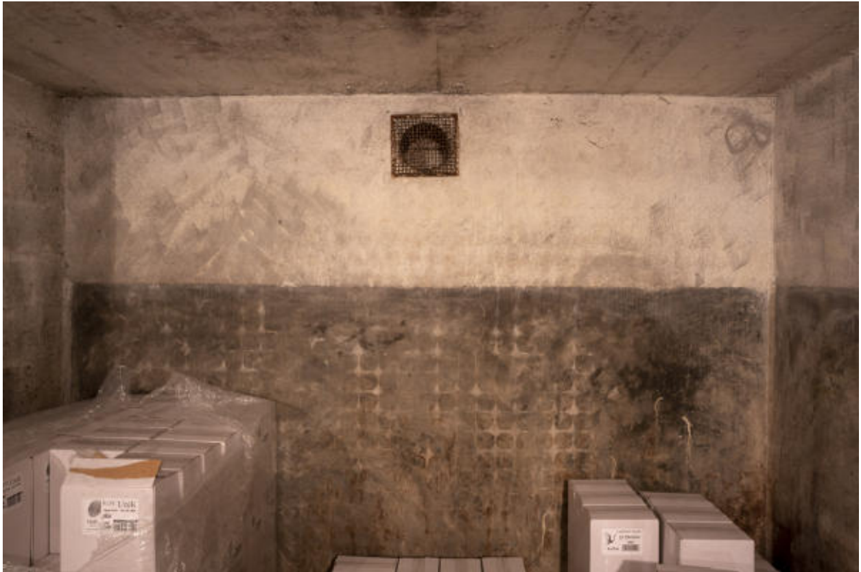
Détail d'une cellule de stockage.