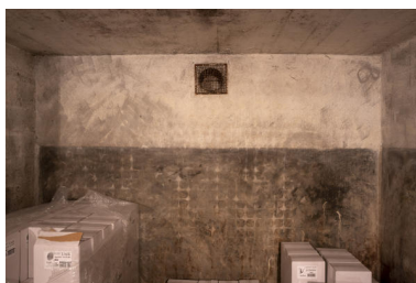
Détail d'une cellule de stockage. IVR52_20224400025NUCA