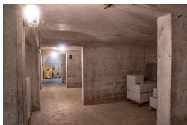
Cellules de stockage des bouteilles.