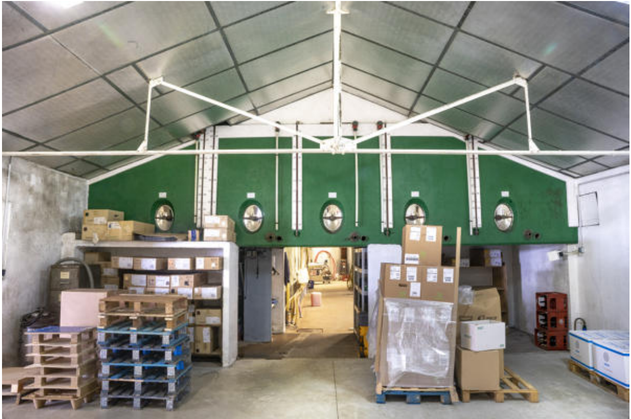
Cuverie principale, depuis le nord-ouest.