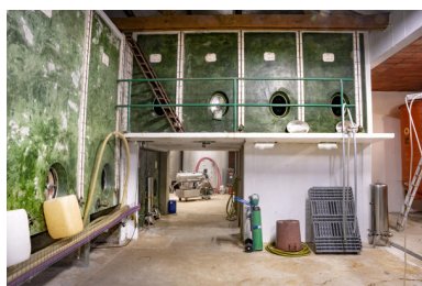
Cuverie principale, depuis le sud-est.