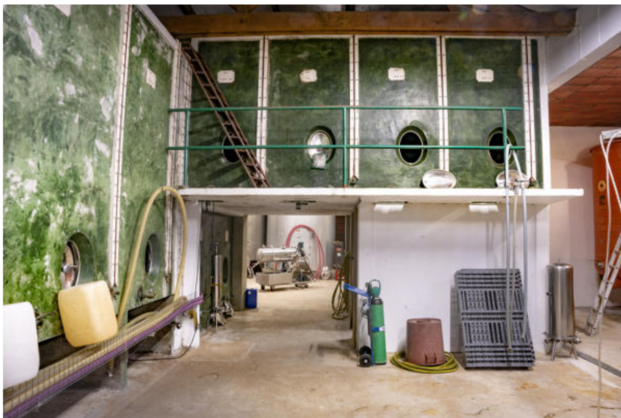
Cuverie principale, depuis le sud-est.