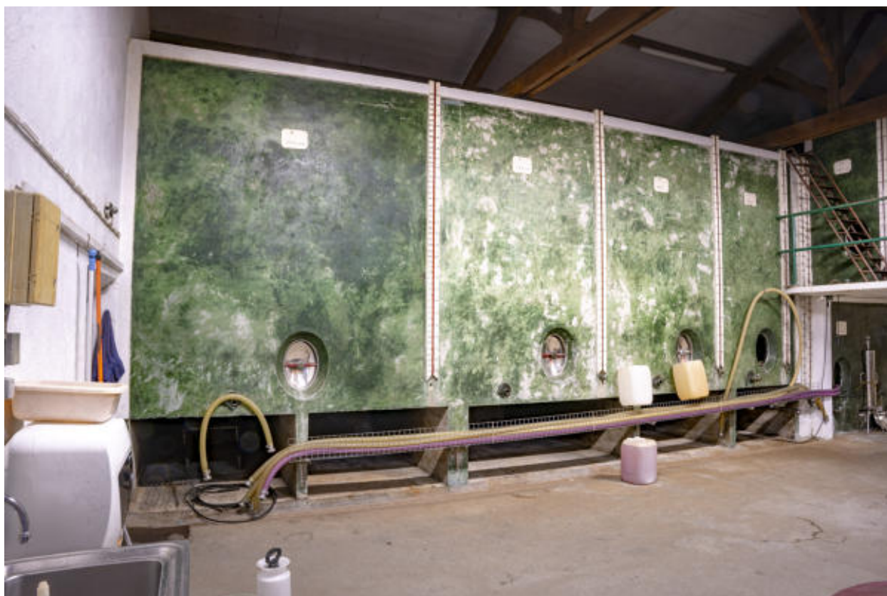
Cuverie principale, depuis le sud-est.