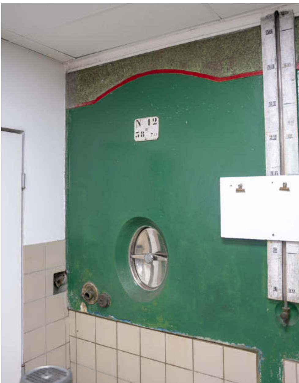
Détail d'une cuve, dans le bâtiment primitif.