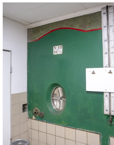
Détail d'une cuve, dans le bâtiment primitif. IVR52_20224400028NUCA