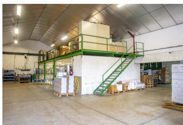
Vue générale du bâtiment primitif, depuis l'entrée.