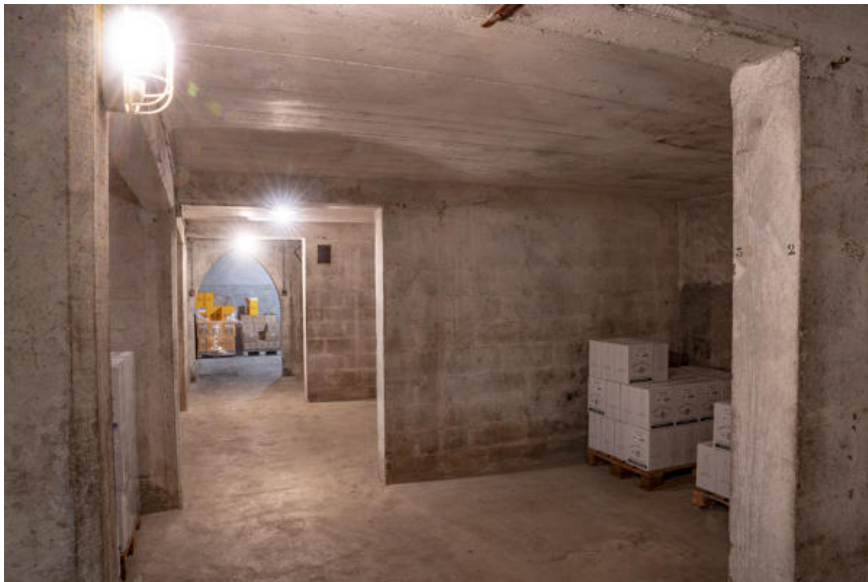
Cellules de stockage des bouteilles.