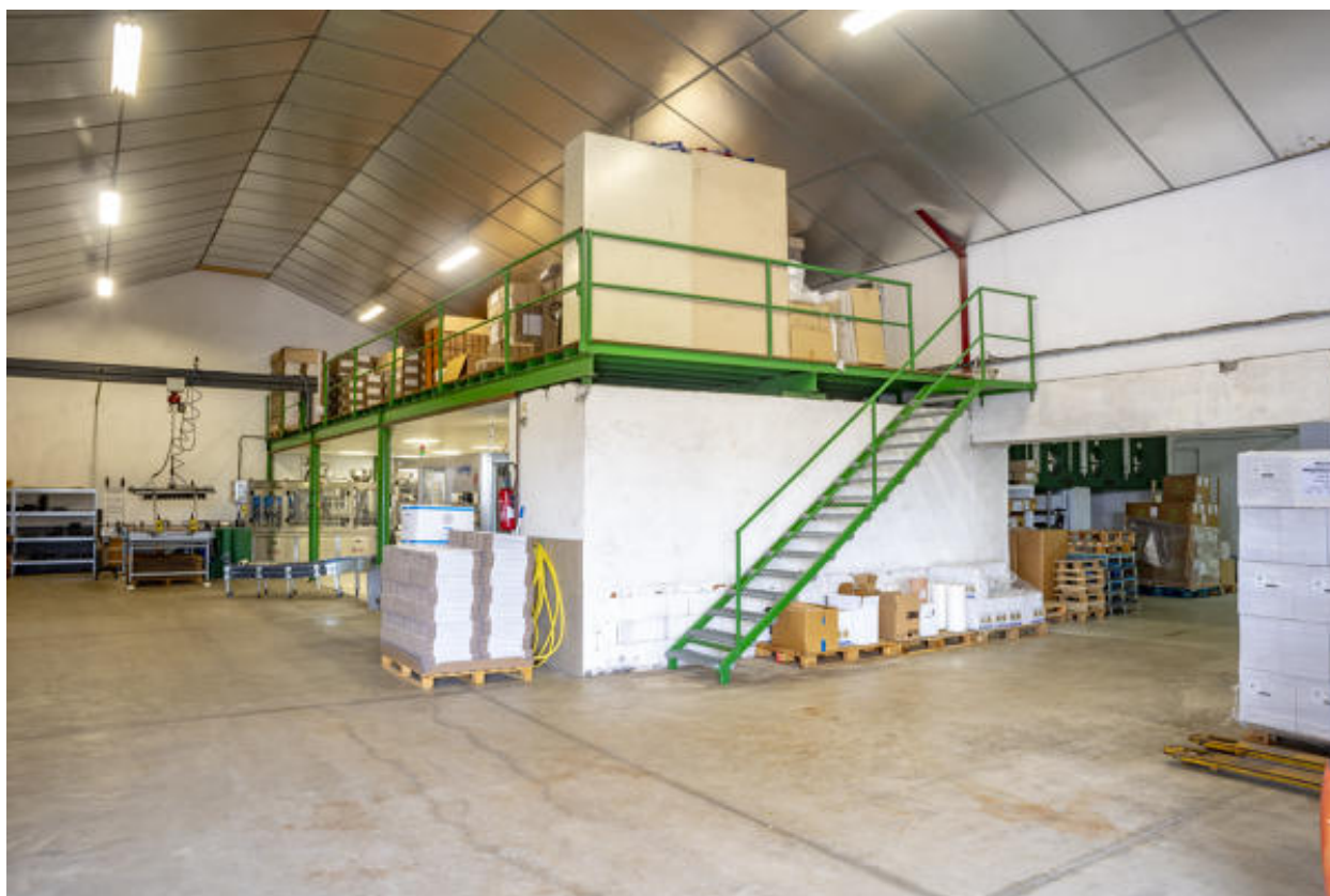
Vue générale du bâtiment primitif, depuis l'entrée.