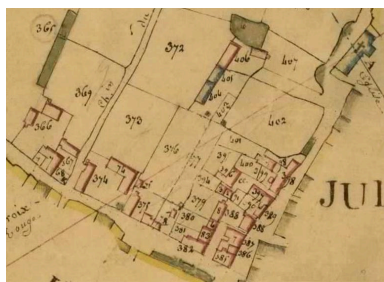
Extrait du plan cadastral de 1818. IVR52_20097202125NUCA