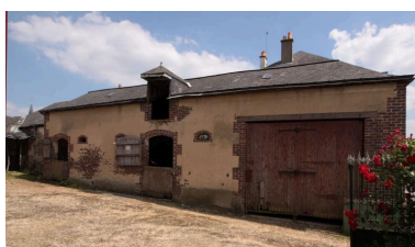
Grange et étables face à la maison : façade sur cour. IVR52_20107201255NUCA