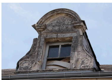
Maison, façade sur cour, comble : détail de la lucarne centrale. IVR52_20107201254NUCA