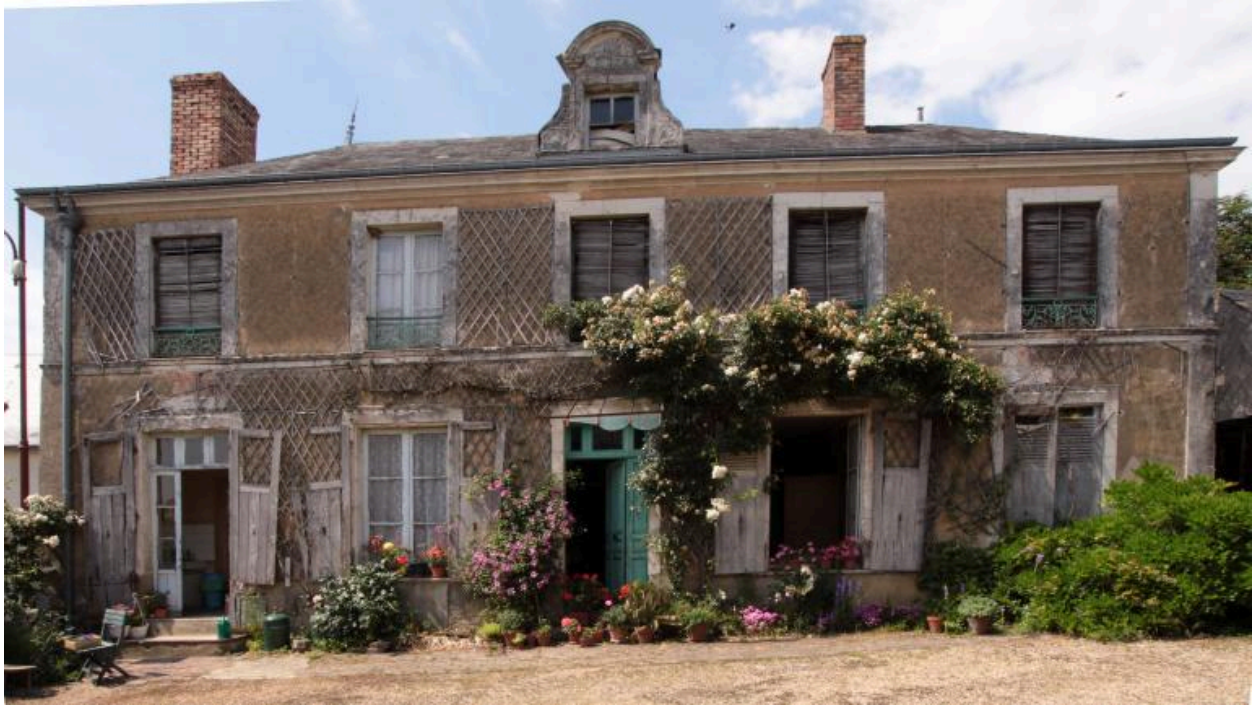
Maison : façade sur cour.