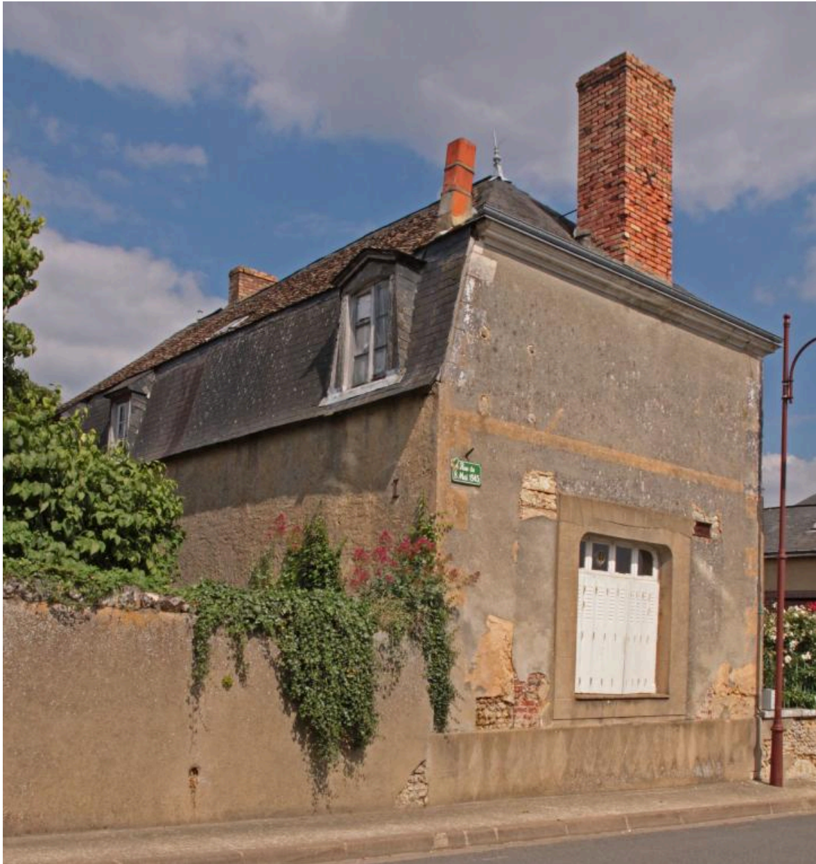
Vue de volume avec façade postérieure.