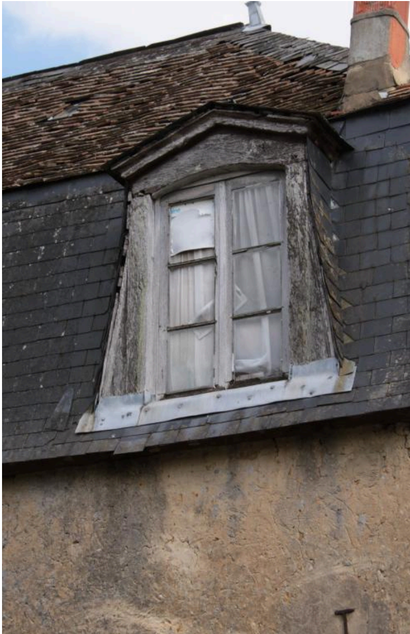
Maison, façade postérieure, comble : détail d'une baie.