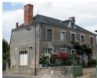
Vue de volume de la maison depuis la rue. IVR52_20107201251NUCA