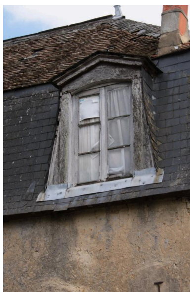
Maison, façade postérieure, comble : détail d'une baie. IVR52_20107201268NUCA