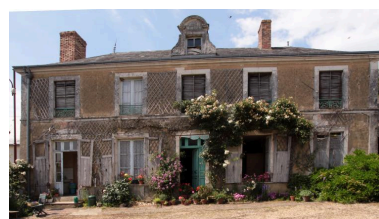
Maison : façade sur cour. IVR52_20107201253NUCA