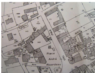
Extrait du plan cadastral de 2005. IVR52_20097202178NUCA