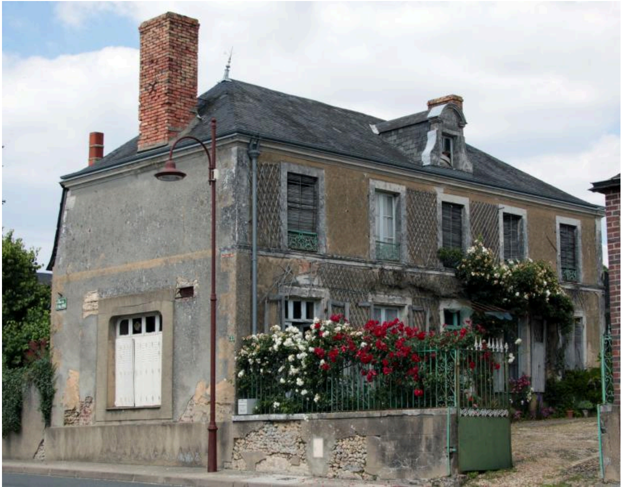
Vue de volume de la maison depuis la rue.