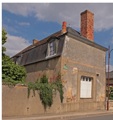
Vue de volume avec façade postérieure. IVR52_20107201267NUCA