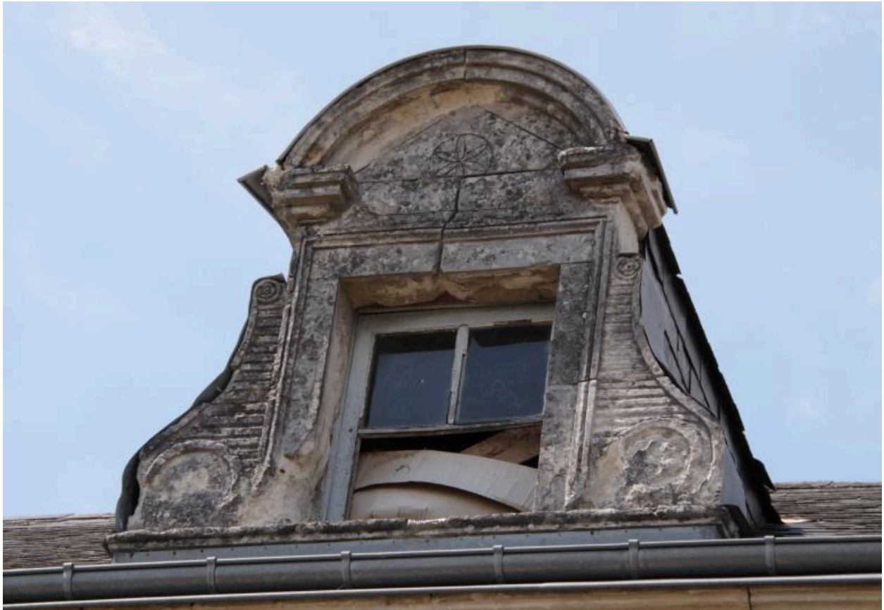
Maison, façade sur cour, comble : détail de la lucarne centrale.