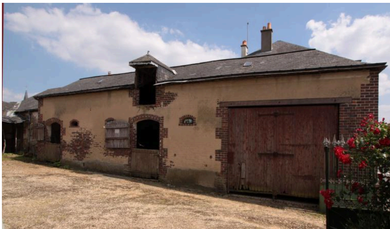
Grange et étables face à la maison : façade sur cour.