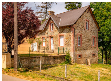
Ecart du Pont de Couterne, maison (ZE 109).

IVR52_20235300859NUCA