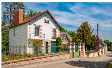
Ecart du Pont de Couterne, maison (ZE 108). IVR52_20235300857NUCA