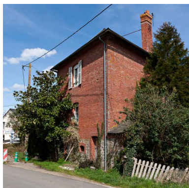
Ecart du Pont de Couterne, maison (ZE 134). IVR52_20195300450NUCA