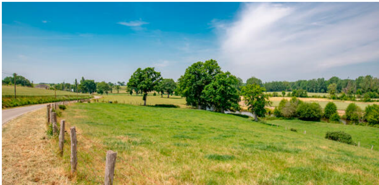
Vue sur la Mayenne depuis le hameau du Pont de Couterne.