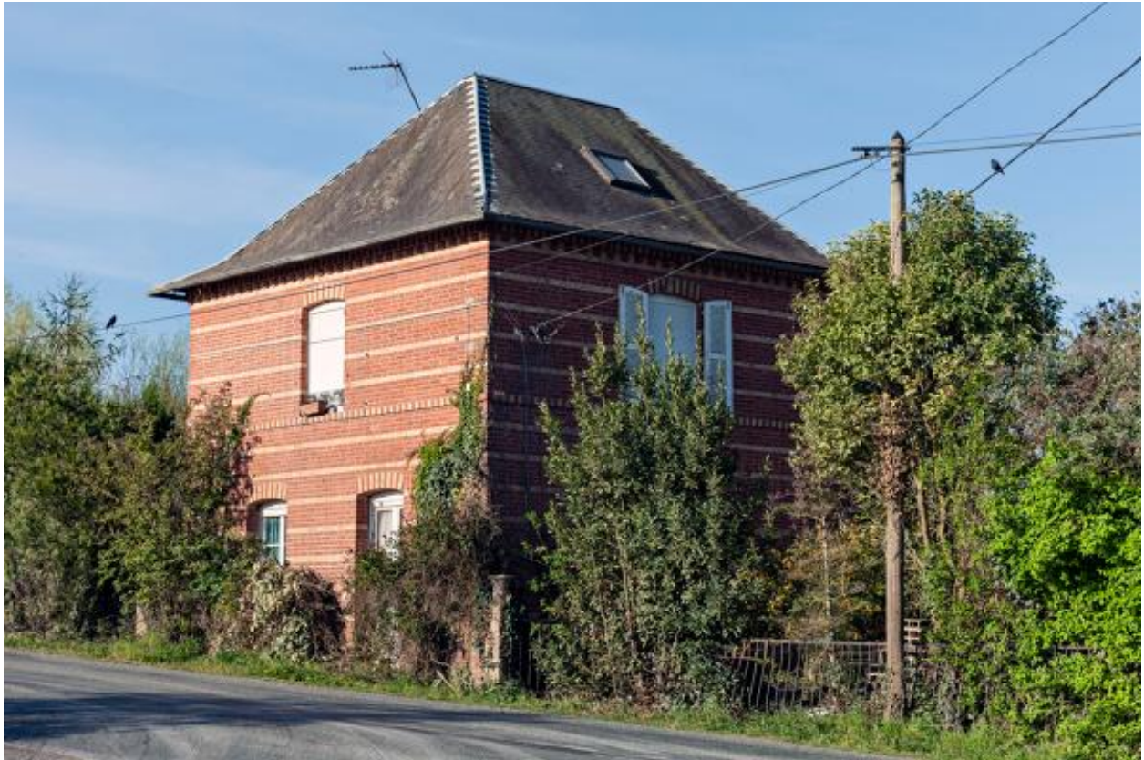
Ecart du Pont de Couterne, maison (ZE 134).