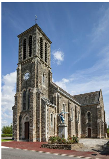
Eglise Saint-Julien.