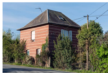
Ecart du Pont de Couterne, maison (ZE 134). IVR52_20195300522NUCA