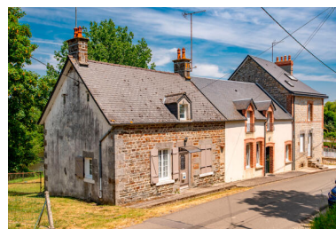
Ecart du Pont de Couterne, maisons (ZE 136-141). IVR52_20235300858NUCA