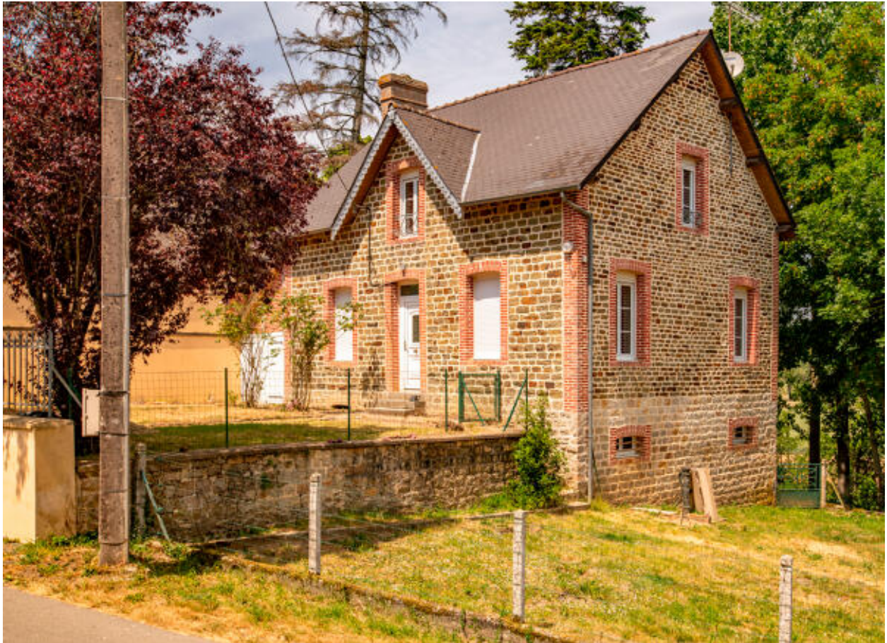
Ecart du Pont de Couterne, maison (ZE 109).