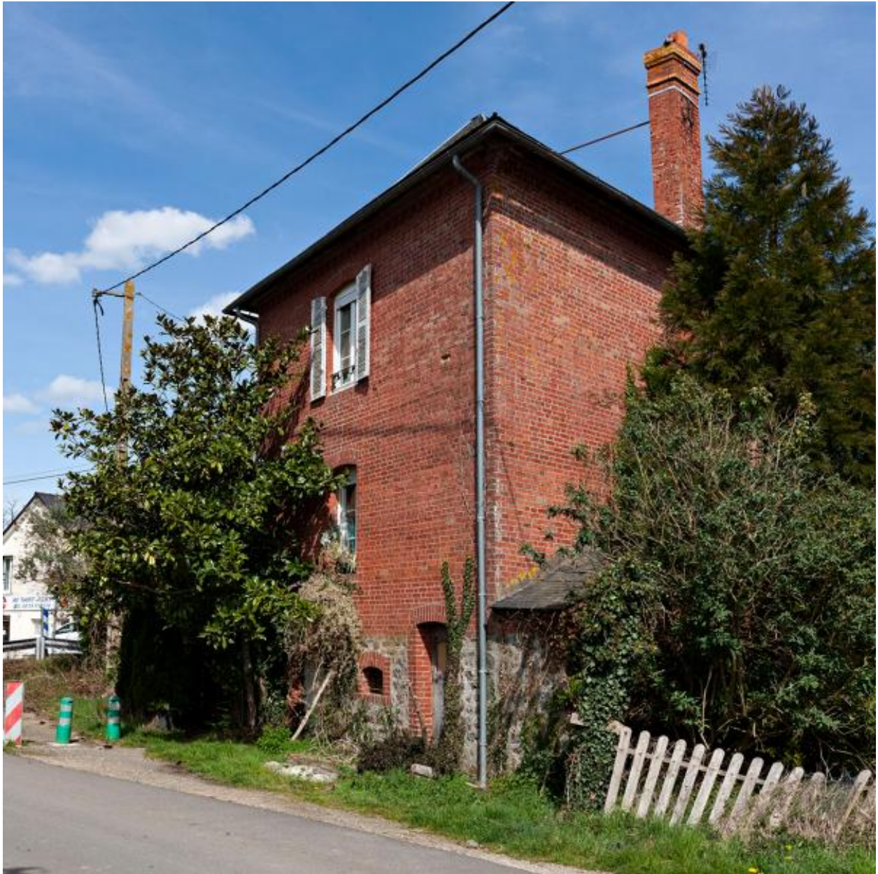
Ecart du Pont de Couterne, maison (ZE 134).