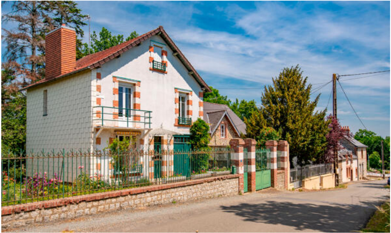
Ecart du Pont de Couterne, maison (ZE 108).