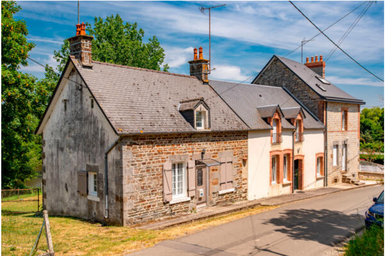
Ecart du Pont de Couterne, maisons (ZE 136-141).