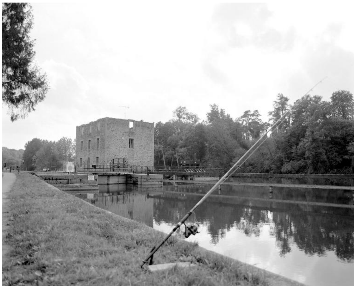
Vue prise de l'amont de l'écluse, du moulin (façades est et nord) et de la centrale hydroélectrique.