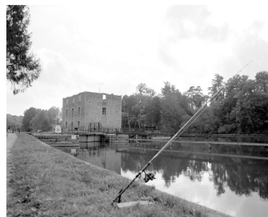
Vue prise de l'amont de l'écluse, du moulin (façades est et nord) et de la centrale hydroélectrique.