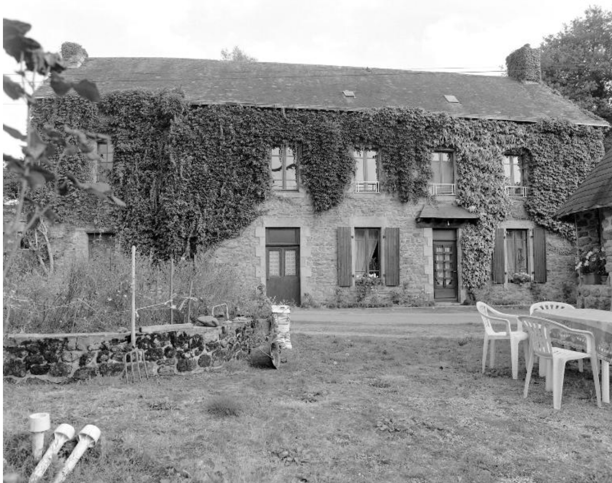
L'ancienne maison de meunier : façade antérieure.