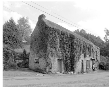
L'ancienne maison de meunier : façade antérieure et pignon nord. IVR52_20015300469X