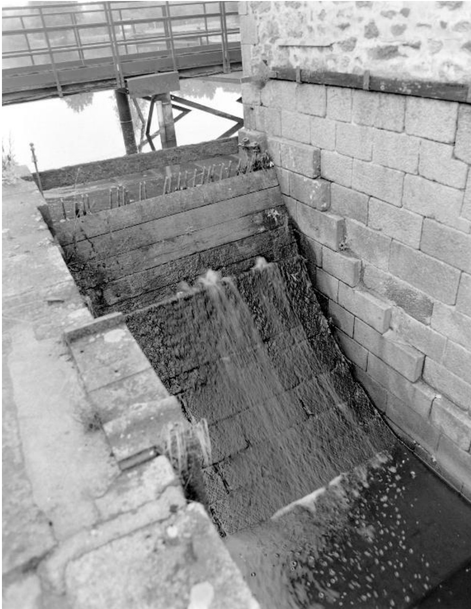
L'emplacement de la roue vu du sud.