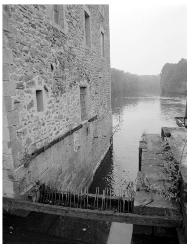
Le passage d'eau de la roue disparue, depuis la passerelle d'accès à la centrale hydro- électrique au nord (en amont).