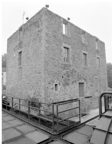
Les façades nord et ouest vues depuis la passerelle d'accès à la micro-centrale électrique.