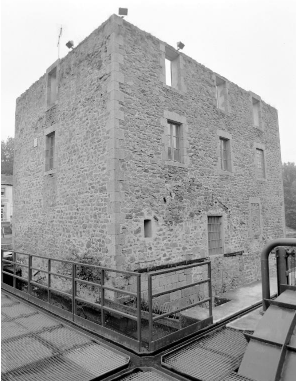
Les façades nord et ouest vues depuis la passerelle d'accès à la micro-centrale électrique.