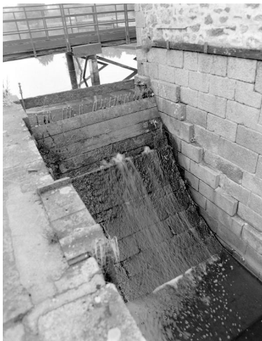
L'emplacement de la roue vu du sud. IVR52_20025301203X