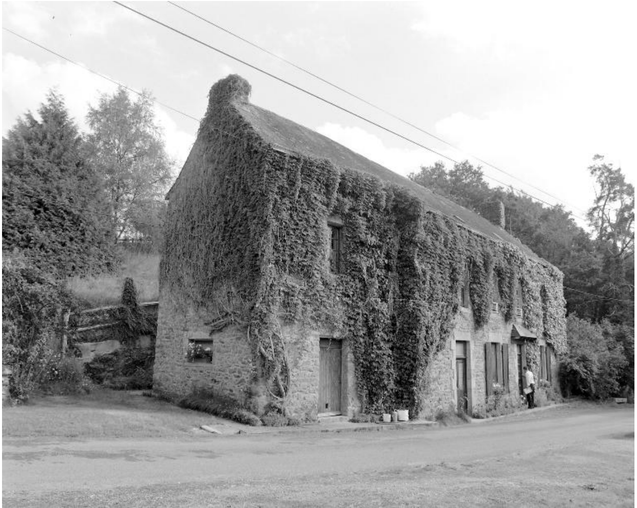
L'ancienne maison de meunier : façade antérieure et pignon nord.