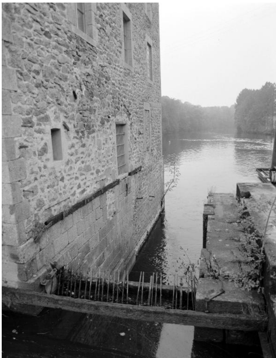
Le passage d'eau de la roue disparue, depuis la passerelle d'accès à la centrale hydro-électrique au nord (en amont).