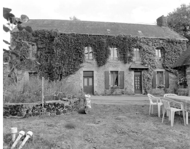
L'ancienne maison de meunier : façade antérieure. IVR52_20015300470X