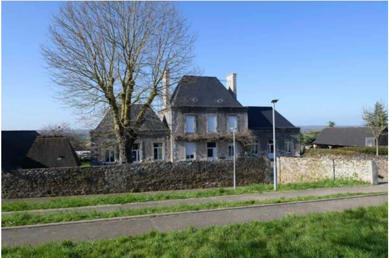
L'école primaire de garçons Saint-Joseph. Vue d'ensemble depuis le sud-ouest.