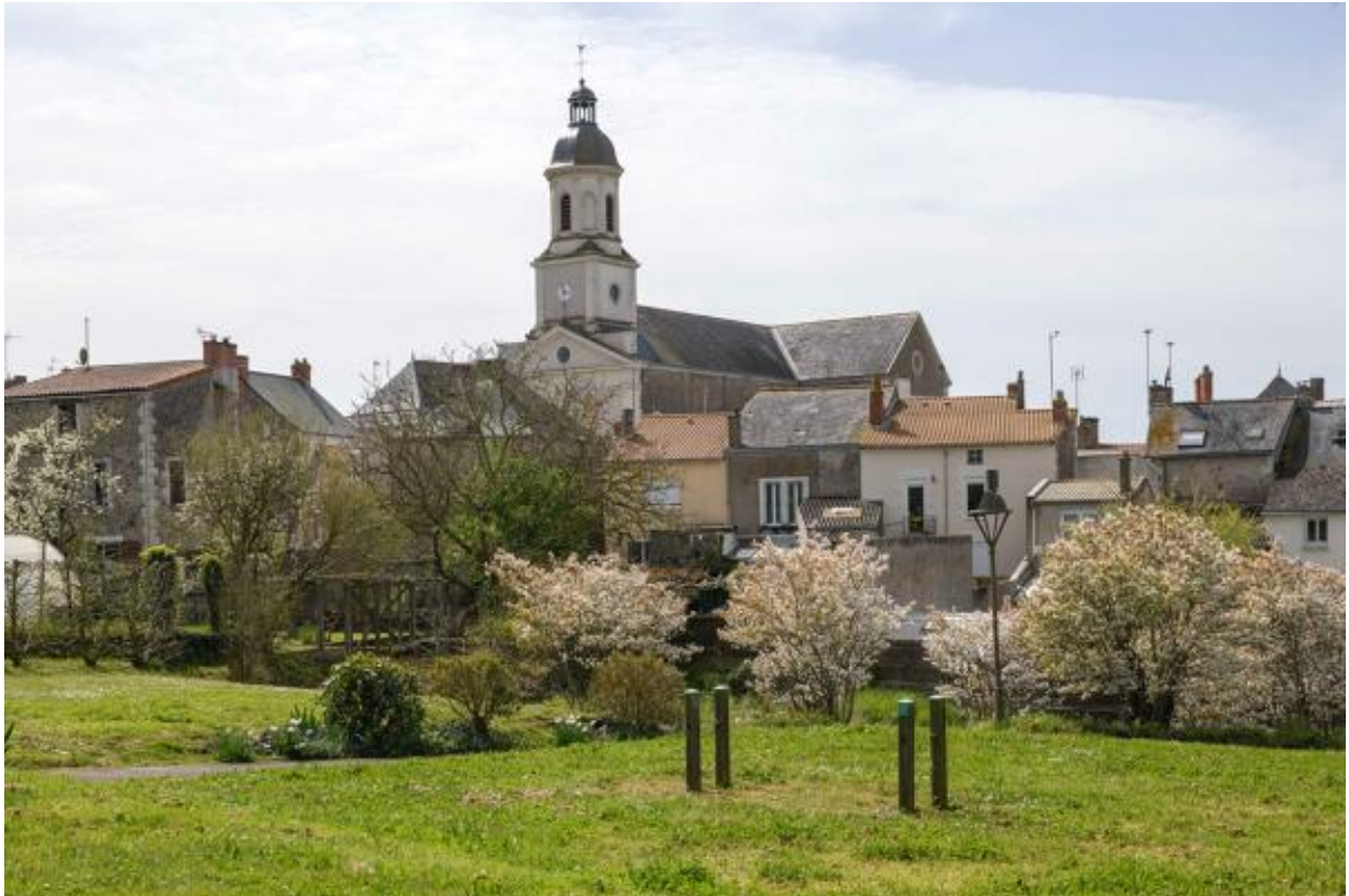
Vue du bourg et de l'église paroissiale depuis la Peltrie.