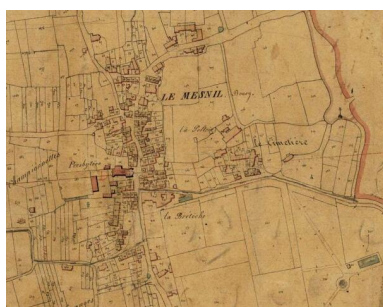
Le bourg du Mesnil. Extrait du plan cadastral de 1827, section C (unique du bourg). (AD Maine-et-Loire ; 3 P 4/212/6). IVR52_20254900472NUCA