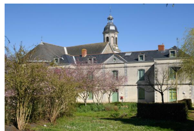
Le prebytère. Vue d'ensemble depuis le jardin.