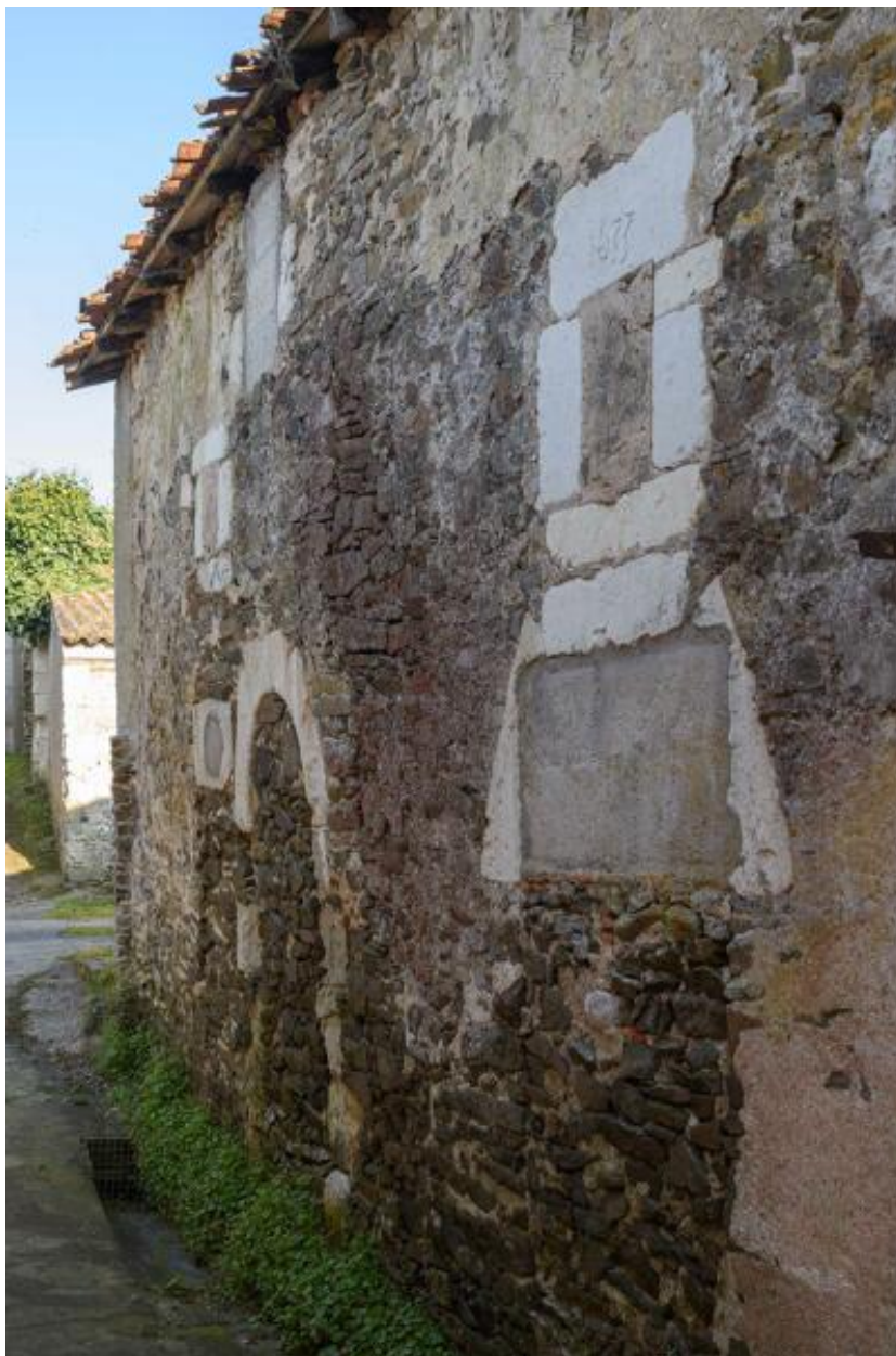
10 rue des Mauges. Vestige d'une maison datée 1633.