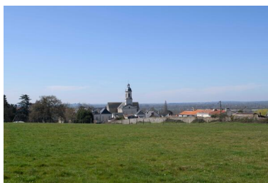
Vue du bourg du Mesnil depuis les anciens jardins de la Bretèche.