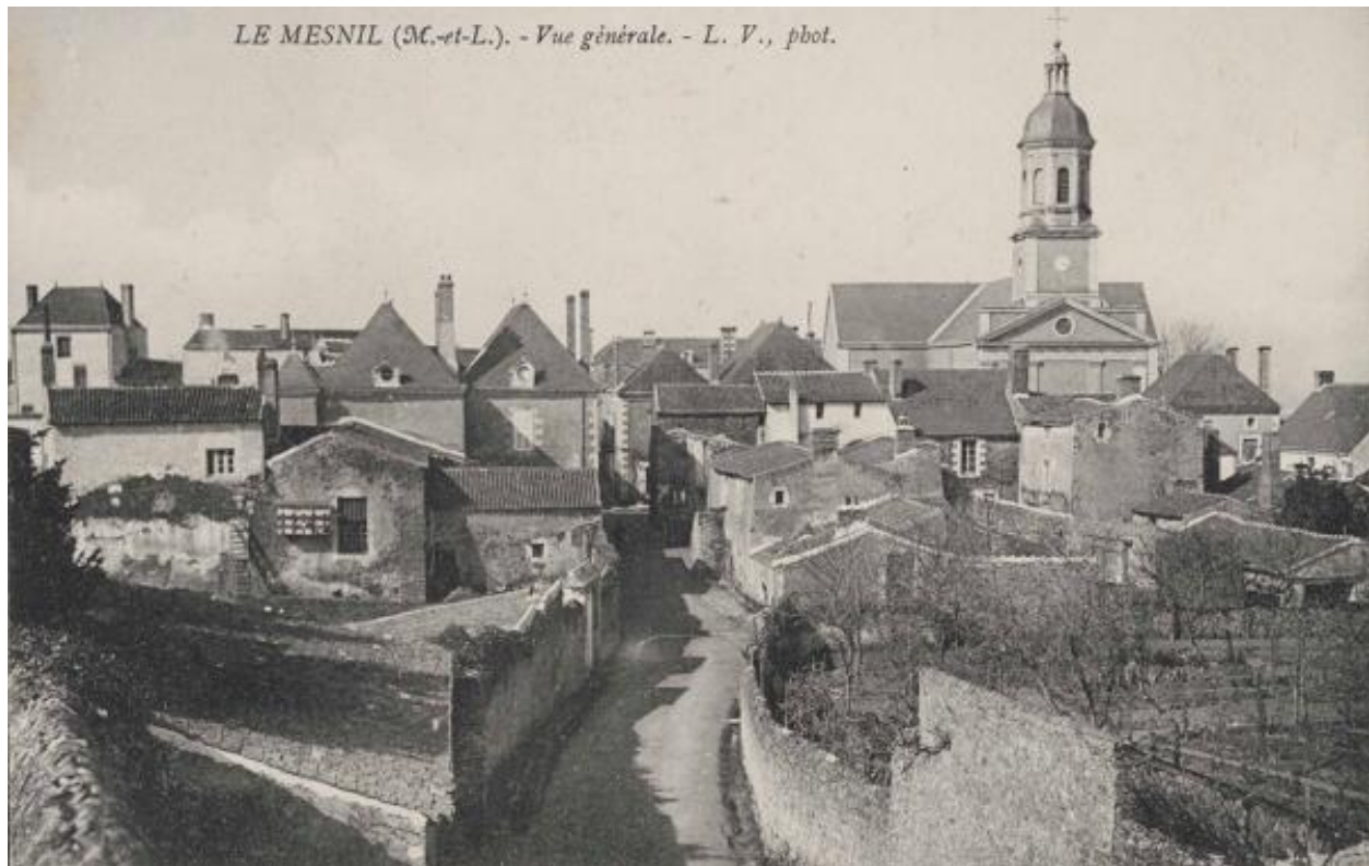
Le bourg du Mesnil. Vue depuis l'est. Carte postale. 1er quart 20e siècle. (Coll. part.).