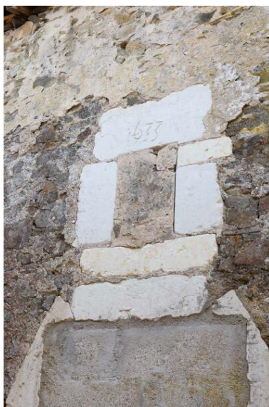
10 rue des Mauges. Vestige d'un jour daté 1633.