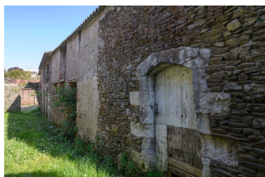
Vue d'ensemble des dépendances à l'arrière du 10 rue des Mauges (XVIIe-XVIIIe siècle).