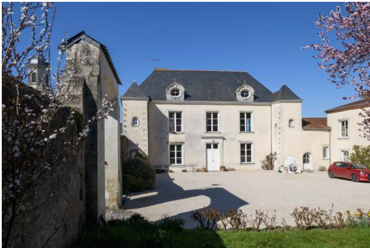
Le château de la Bretèche. Vue d'ensemble depuis la cour.