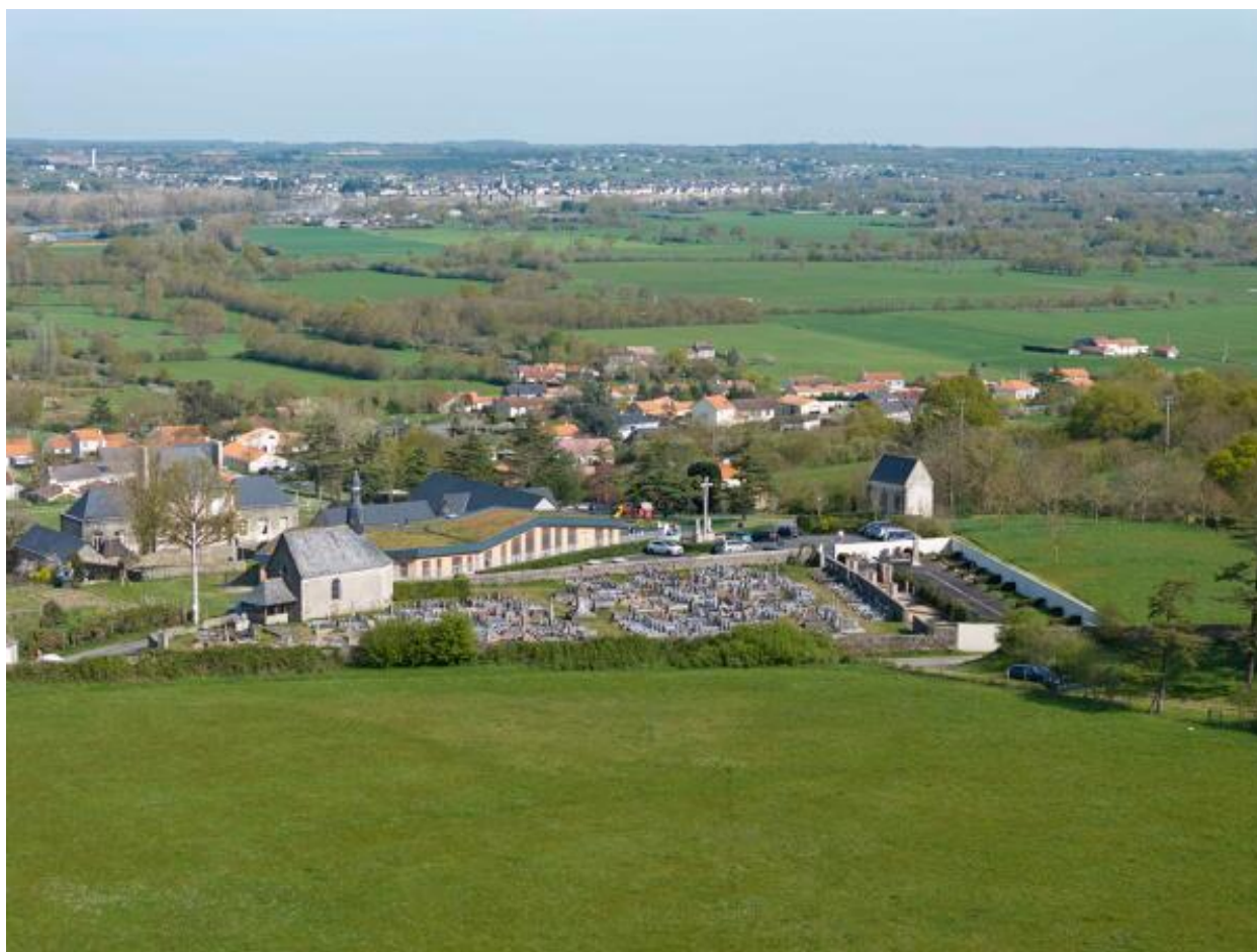
Vue aérienne du cimetière depuis le sud.