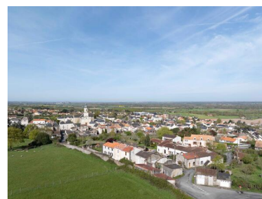
Vue aérienne du bourg du Mesnil et l'écart du Haut-Cimetière depuis le sud-est.