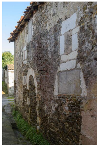
10 rue des Mauges. Vestige d'une maison datée 1633.