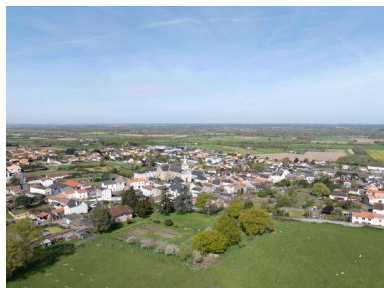
Vue aérienne du bourg du Mesnil-en-Vallée et de la vallée de la Loire depuis le sud-est.