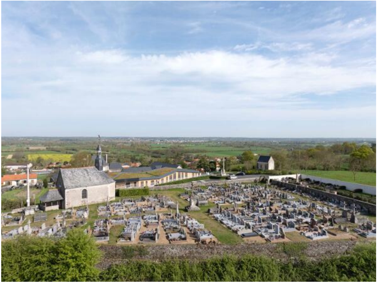
Vue aérienne du cimetière depuis le sud.