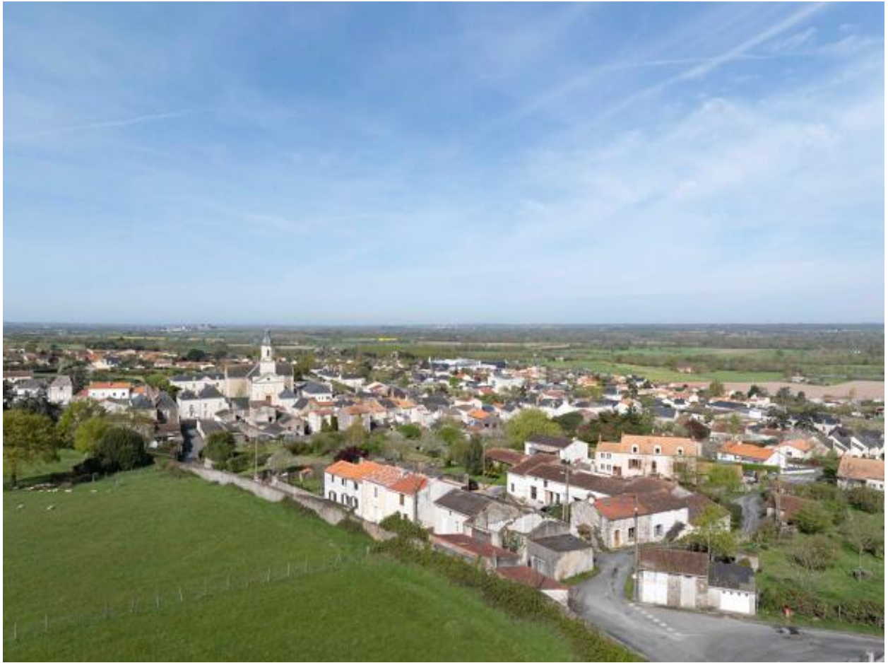
Vue aérienne du bourg du Mesnil et l'écart du Haut-Cimetière depuis le sud-est.