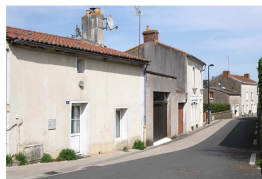
Vue de la rue du Pavillon depuis l'ouest.