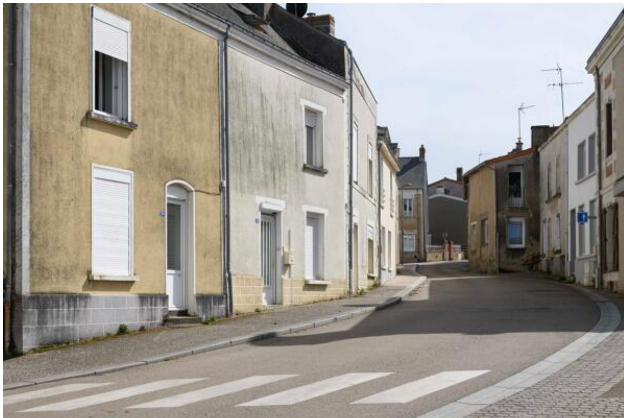
Vue de la rue des Mauges depuis le nord.