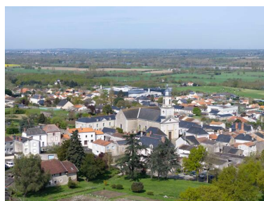
Vue aérienne du bourg et de l'église paroissiale Notre-Dame depuis le sud.