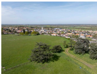
Vue aérienne du bourg du Mesnil et de la vallée de la Loire depuis l'est.