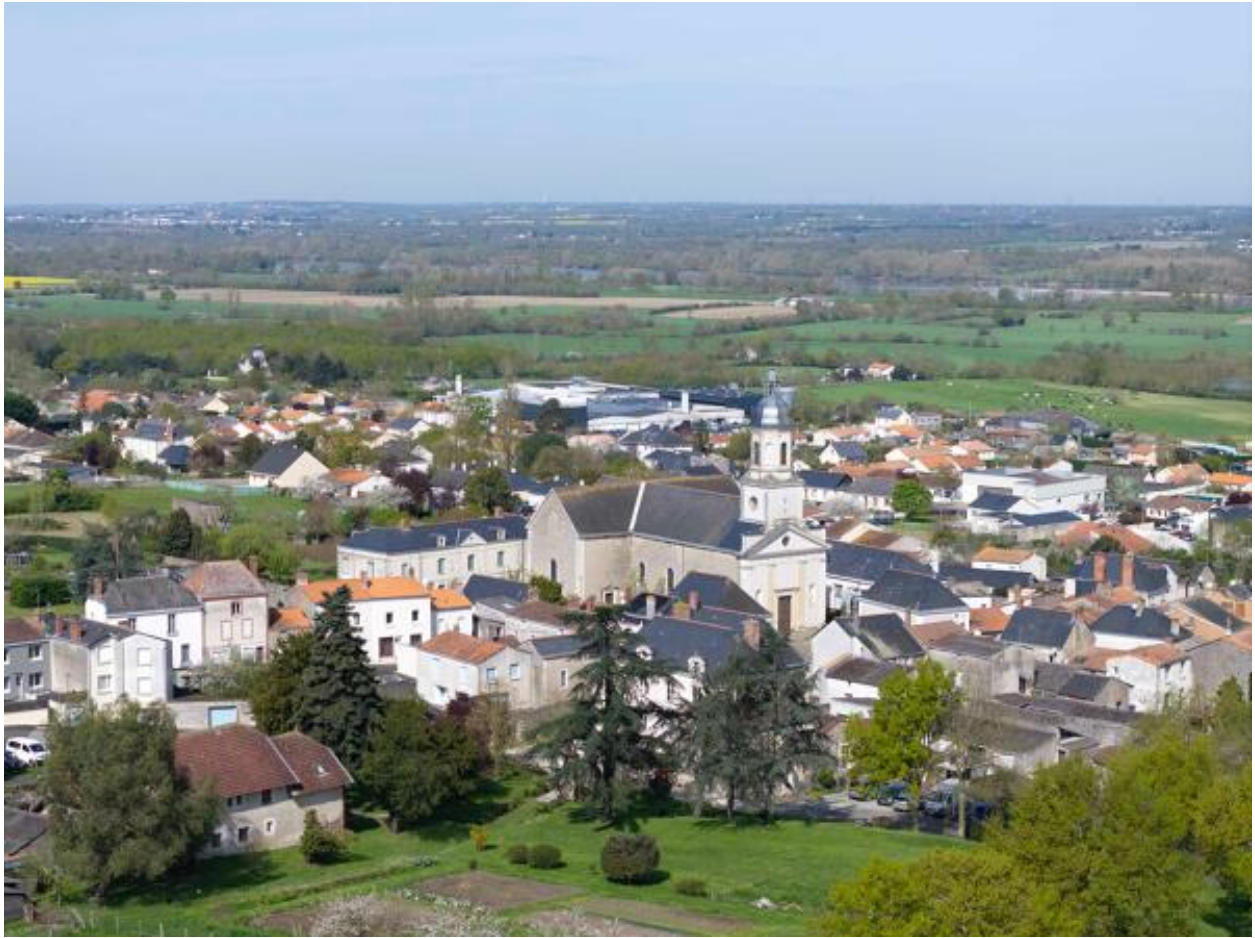
Vue aérienne du bourg et de l'église paroissiale Notre-Dame depuis le sud.