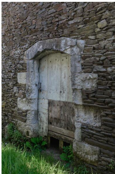
10 rue des Mauges. Détail d'une porte couverte en arc segmentaire.