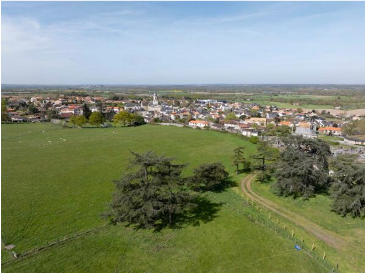
Vue aérienne du bourg du Mesnil et de la vallée de la Loire depuis l'est.