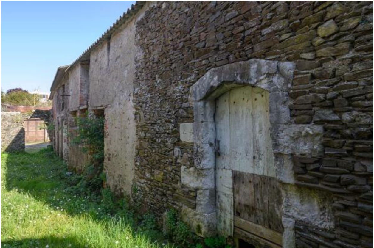
Vue d'ensemble des dépendances à l'arrière du 10 rue des Mauges (XVIIe-XVIIIe siècle).