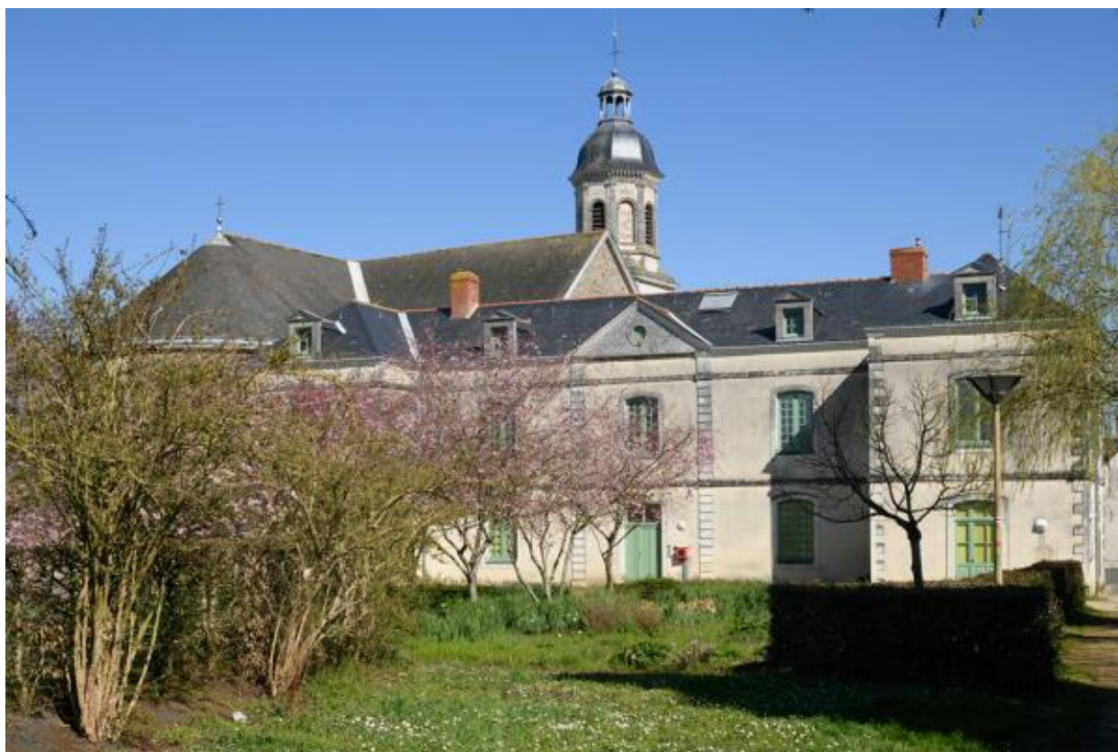
Le presbytère. Vue d'ensemble depuis le jardin.