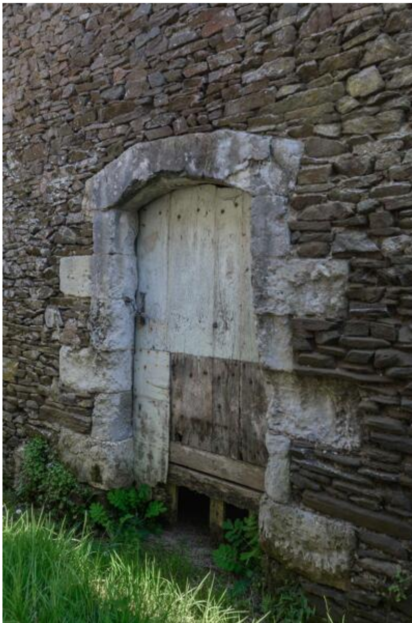
10 rue des Mauges. Détail d'une porte couverte en arc segmentaire.