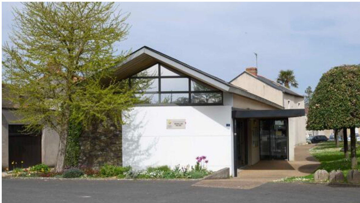
La mairie du Mesnil-en-Vallée. Vue depuis l'ouest.