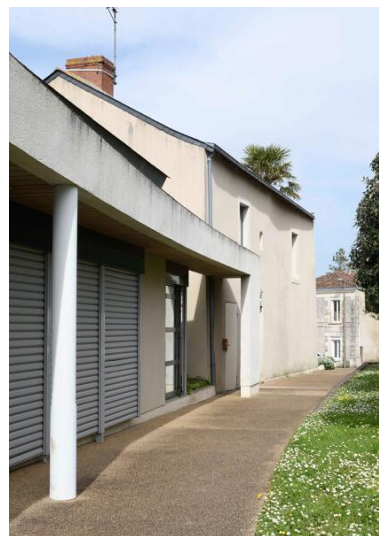
La mairie du Mesnil-en-Vallée. Vue depuis le nord-ouest.