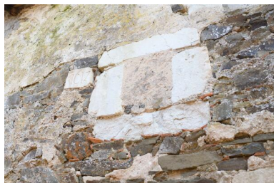
10 rue des Mauges. Détail d'un bloc de tuffeau (en remploi ?) daté 1613.