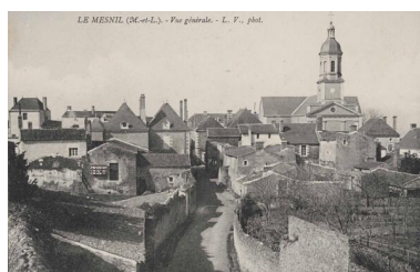
Le bourg du Mesnil. Vue depuis l'est. Carte postale. 1er quart 20e siècle. IVR52_20244901140NUCA