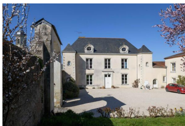
Le château de la Bretèche. Vue d'ensemble depuis la cour.