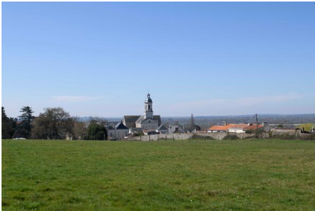
Vue du bourg du Mesnil depuis les anciens jardins de la Bretèche.