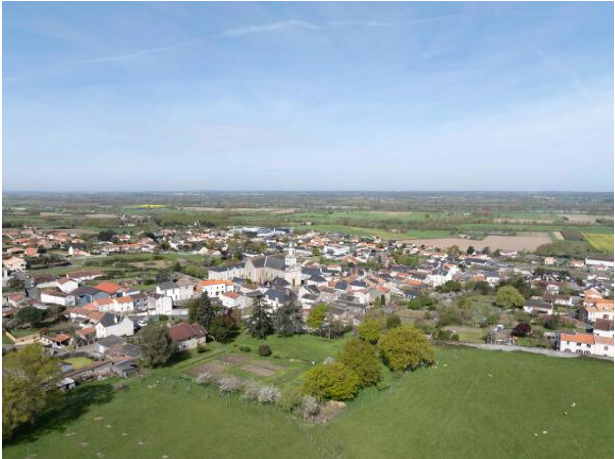
Vue aérienne du bourg du Mesnil-en-Vallée et de la vallée de la Loire depuis le sud-est.