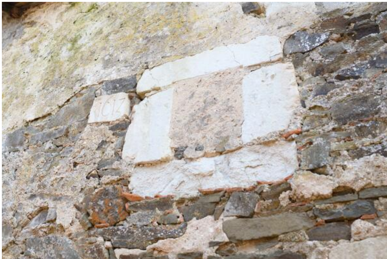
10 rue des Mauges. Détail d'un bloc de tuffeau (en remploi ?) daté 1613.