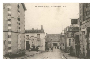
Le Mesnil-en-Vallée. La Grande-Rue. Carte postale. 1er quart du 20e siècle. IVR52_20234900075NUCA