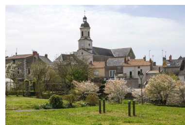
Vue du bourg et de l'église paroissiale depuis la Peltrie.