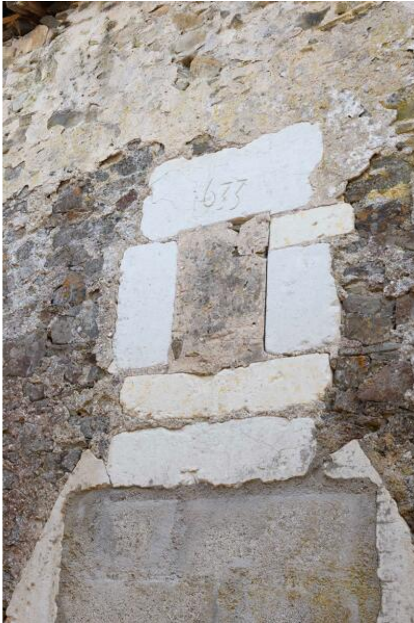
10 rue des Mauges. Vestige d'un jour daté 1633.