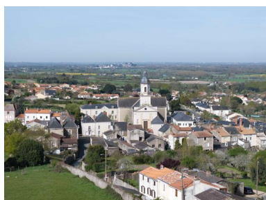
Vue aérienne du bourg et de l'église paroissiale Notre-Dame depuis le sud-est.