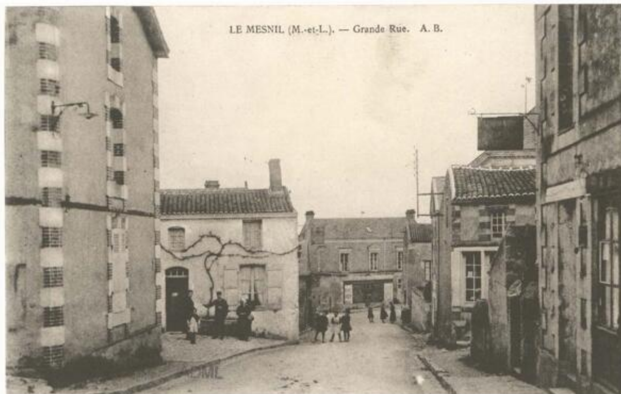
Le Mesnil-en-Vallée. La Grande-Rue. Carte postale. 1er quart du 20e siècle.