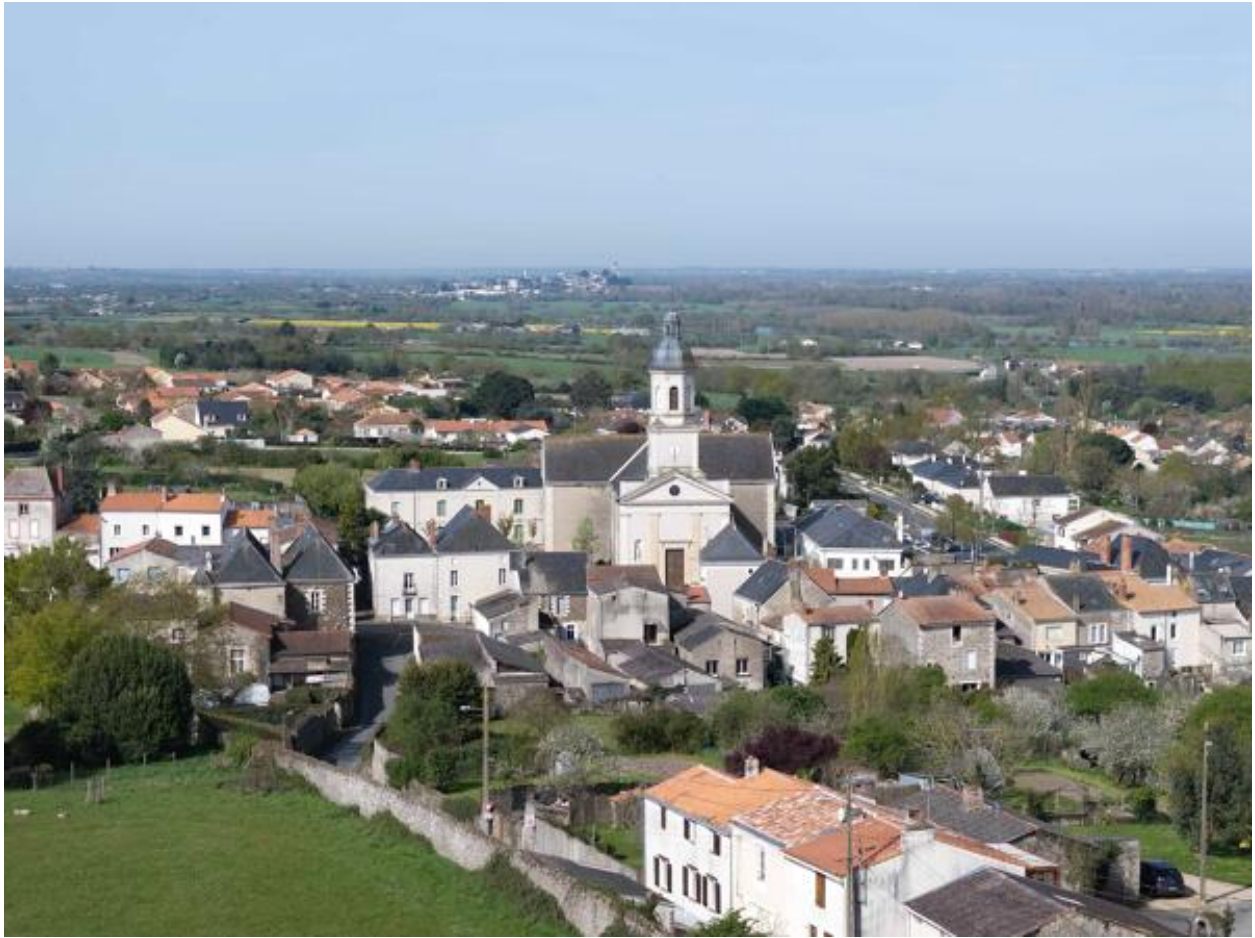
Vue aérienne du bourg et de l'église paroissiale Notre-Dame depuis le sud-est.