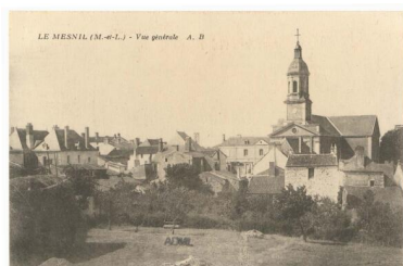
Le Mesnil-en-Vallée. Vue générale. Carte postale. 1er quart du 20e siècle. IVR52_20234900072NUCA