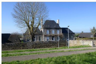
L'école primaire de garçons Saint-Joseph. Vue d'ensemble depuis le sud-ouest.