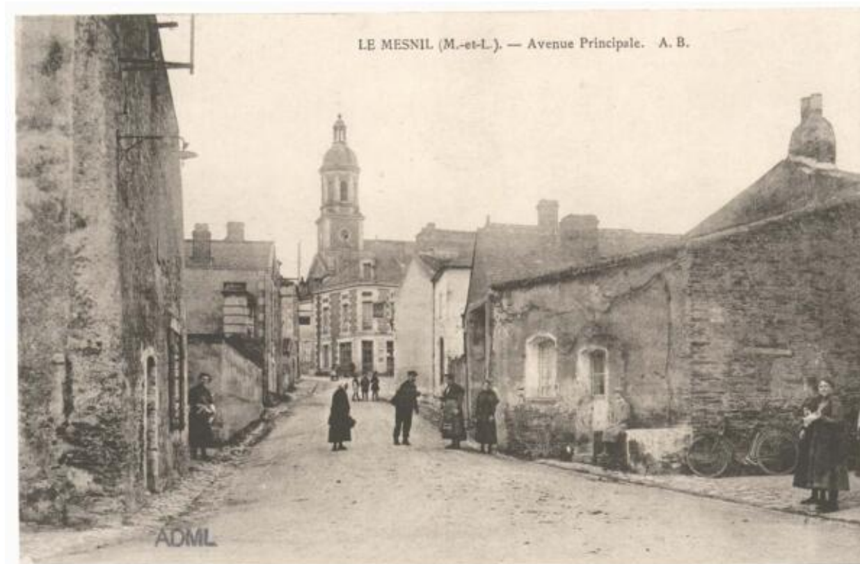
Le Mesnil-en-Vallée. Avenue principale. Carte postale. 1er quart du 20e siècle. (AD Maine-et-Loire, 6 Fi 3177).