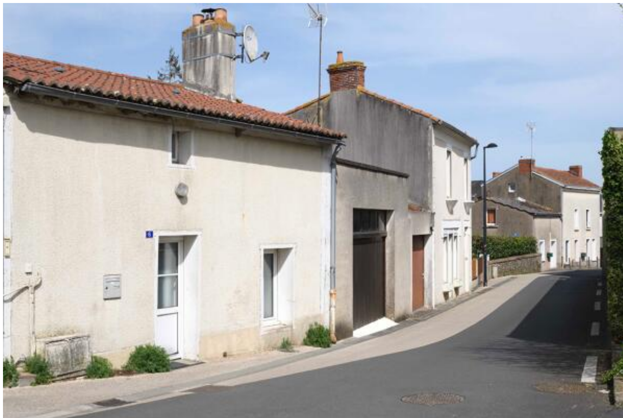
Vue de la rue du Pavillon depuis l'ouest.