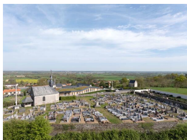
Vue aérienne du cimetière depuis le sud. IVR52_20254900411NUCA