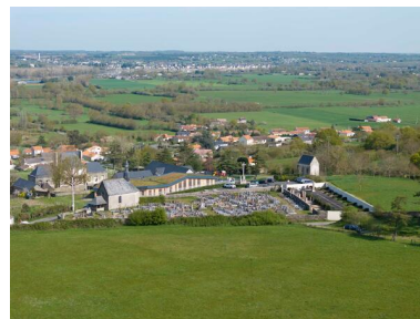
Vue aérienne du cimetière depuis le sud. IVR52_20254900417NUCA