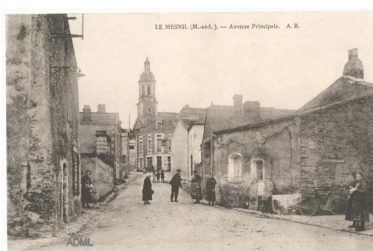
Le Mesnil-en-Vallée. Avenue principale. Carte postale. 1er quart du 20e siècle. IVR52_20234900074NUCA