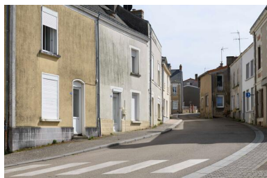
Vue de la rue des Mauges depuis le nord. IVR52_20254900546NUCA