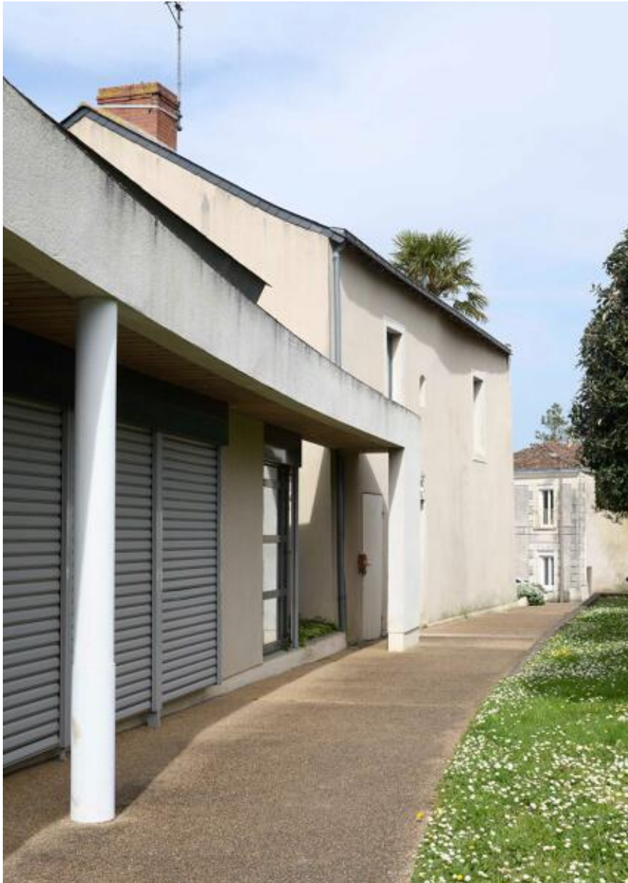
La mairie du Mesnil-en-Vallée. Vue depuis le nord-ouest.