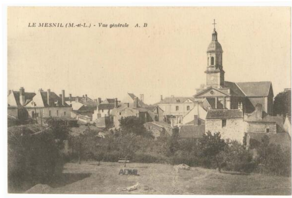
Le Mesnil-en-Vallée. Vue générale. Carte postale. 1er quart du 20e siècle. (AD Maine-et-Loire, 6 Fi 3174).