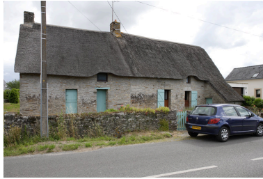
Vue d'ensemble. IVR52_20084401998NUCA