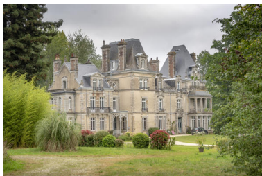
Le château.