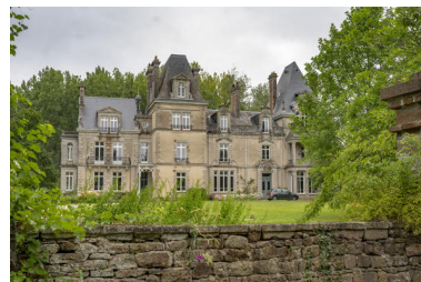
Le château. IVR52_20215301046NUCA