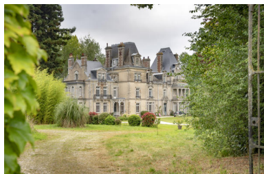
Le château. IVR52_20215301043NUCA