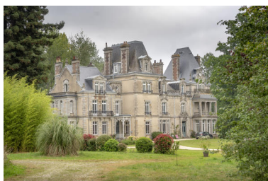
Le château.