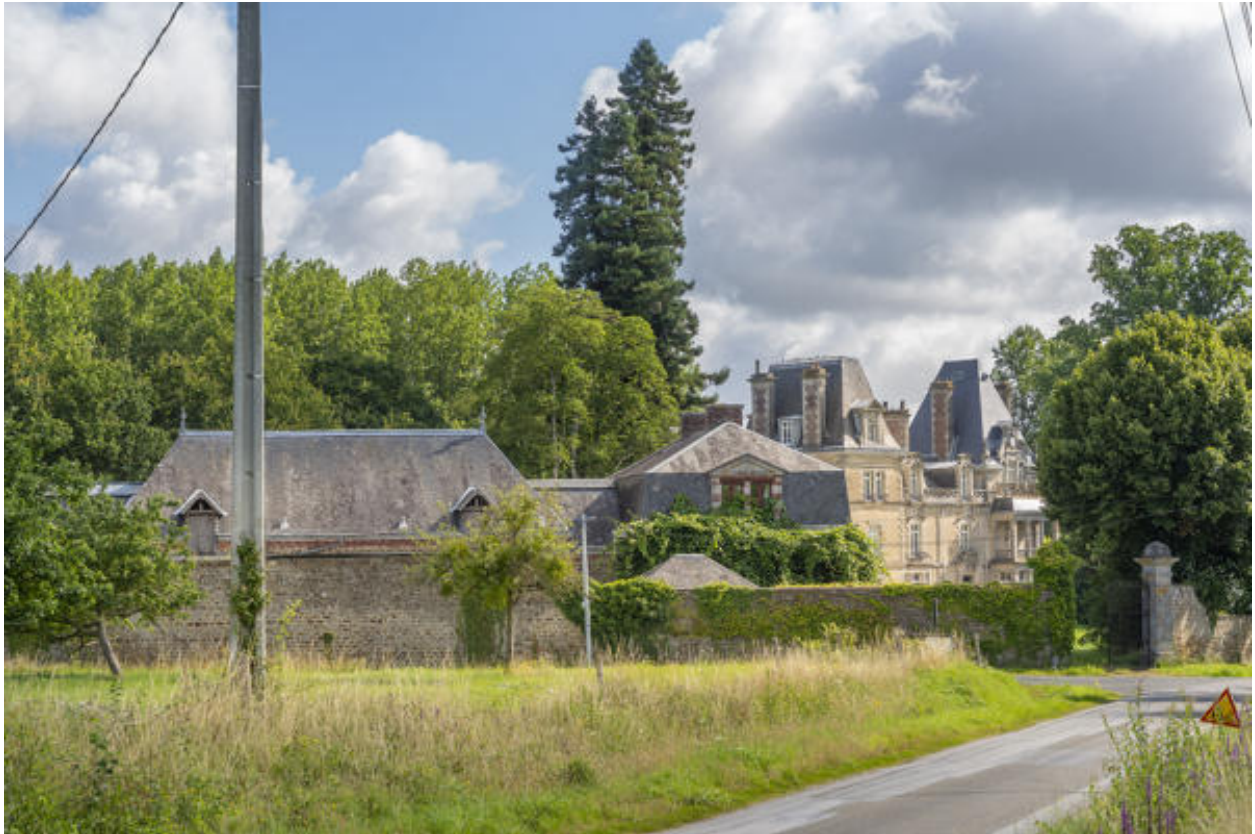
Une vue d'ensemble depuis l'ouest.