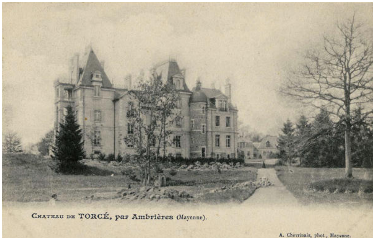
La façade postérieure du château, carte postale du début du XXe siècle.