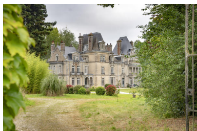
Le château. IVR52_20215301043NUCA