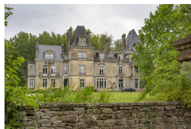
Le château.