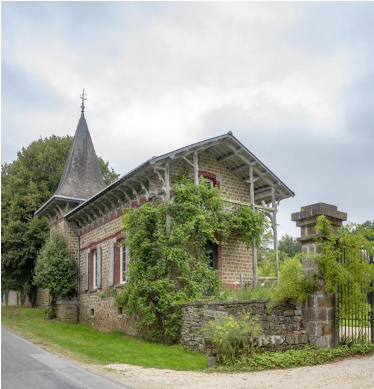
La maison de gardien.