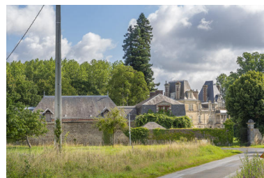
Une vue d'ensemble depuis l'ouest.