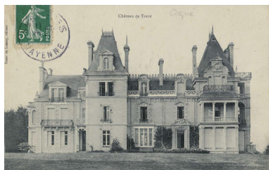
La façade antérieure du château, carte postale du début du XXe siècle.