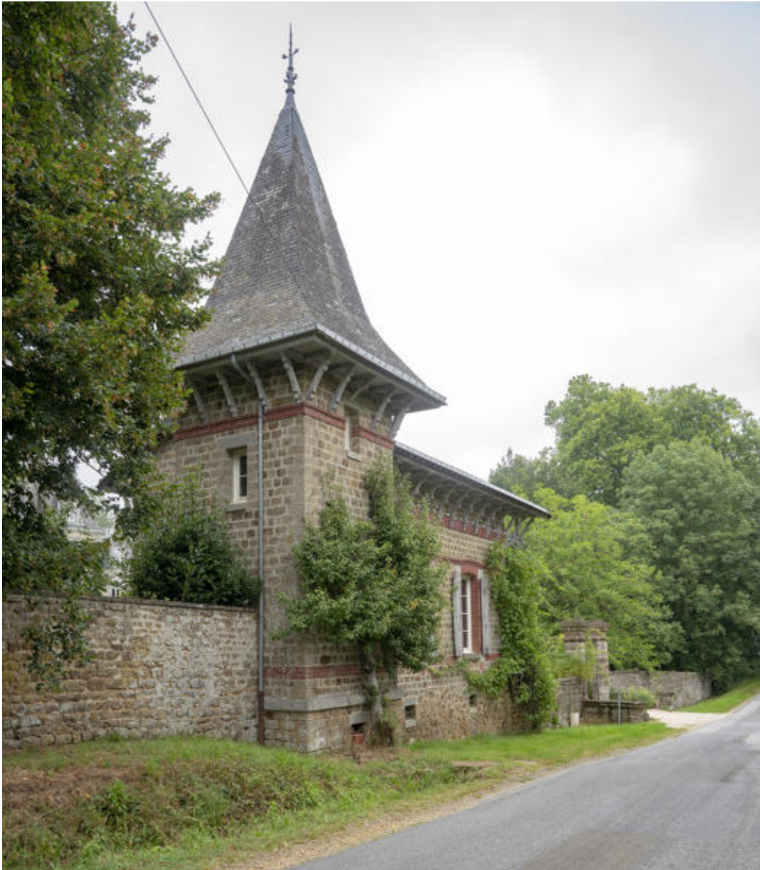
La maison de gardien.