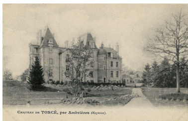
La façade postérieure du château, carte postale du début du XXe siècle.