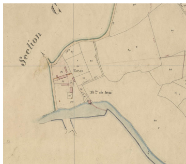
Torcé sur le plan cadastral napoléonien de 1837.