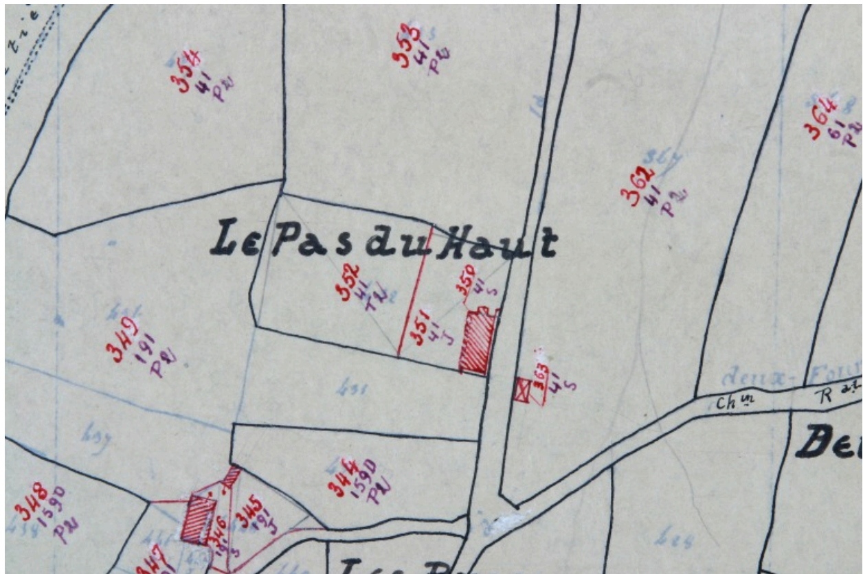
Extrait du plan cadastral de 1937, section F3.