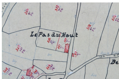
Extrait du plan cadastral de 1937, section F3.