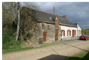
Vue d'ensemble depuis le sud-ouest. IVR52_20035301438NUCA