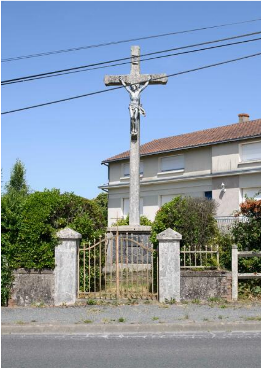
Croix monumentale, 12 rue de la Loire.