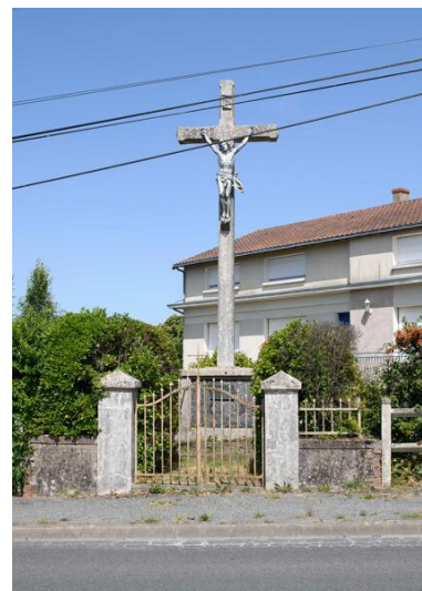
Croix monumentale, 12 rue de la Loire.