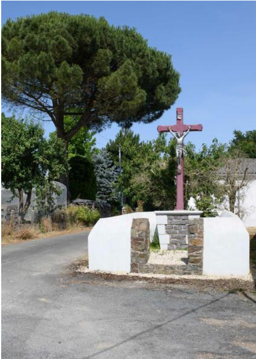
Croix de chemin, dite Croix Rouge.