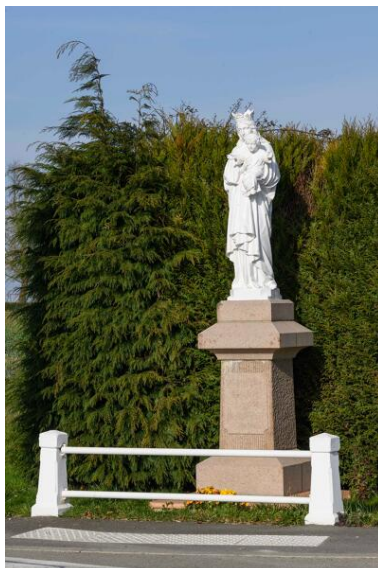
Vue d'ensemble de la statue de la Vierge à l'Enfant (1950). IVR52_20254900246NUCA