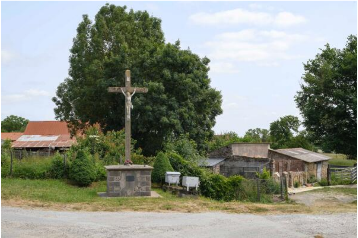
Croix de chemin de la Touche Fleury.