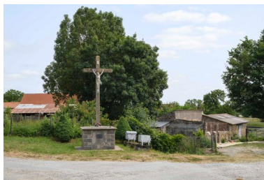
Croix de chemin de la Touche Fleury.