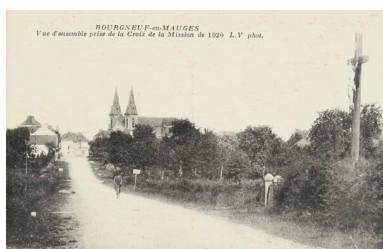
Vue d'ensemble de la croix de mission de 1920 (croix n° 10 du tableau de repérage), carte postale, début du XXe siècle.