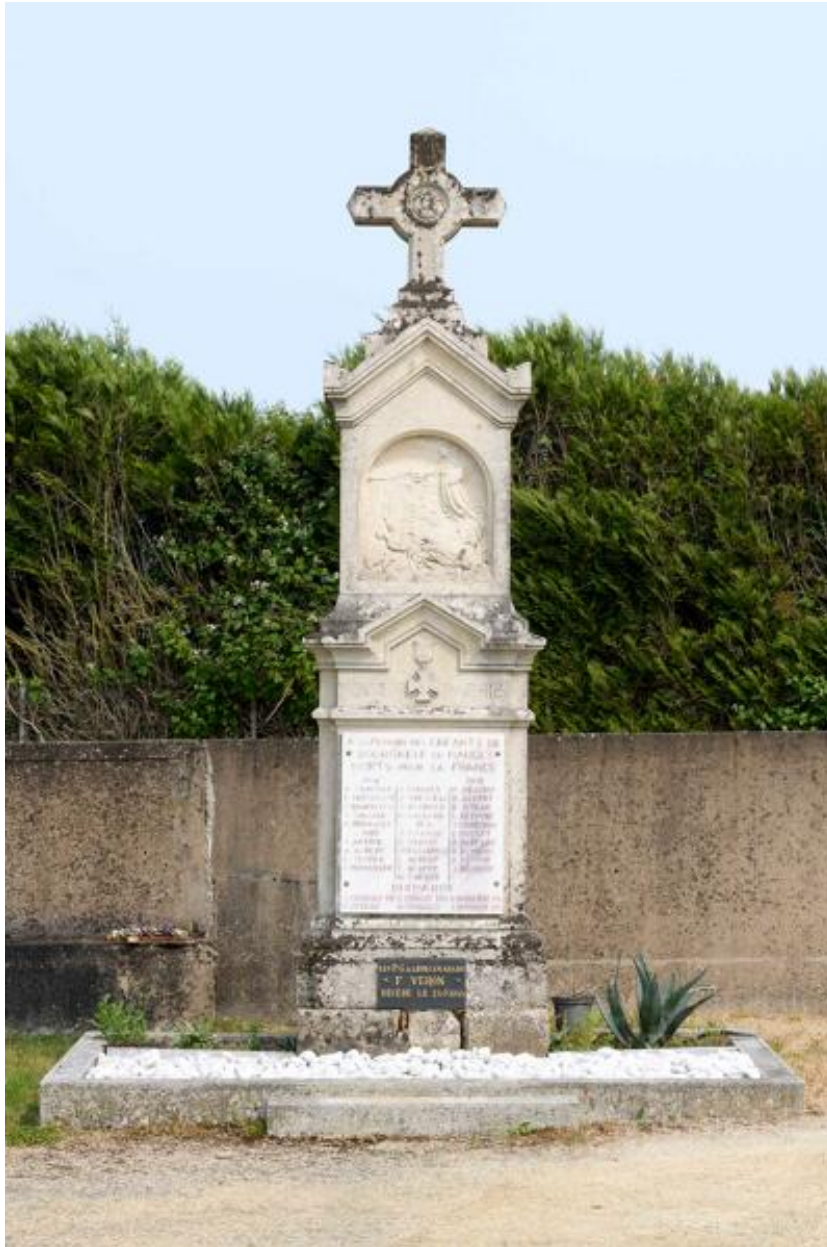
Monument aux morts.