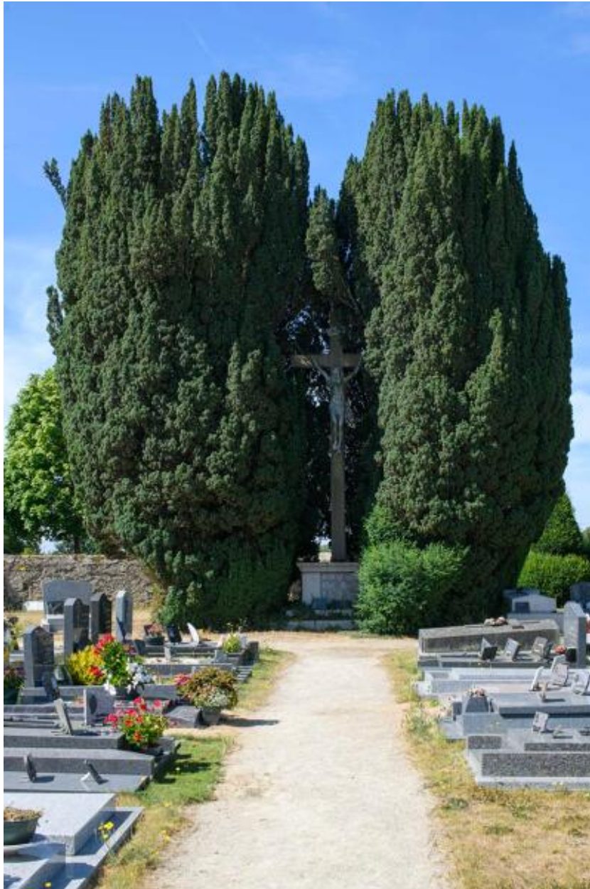
Vue d'ensemble de la croix de cimetière.