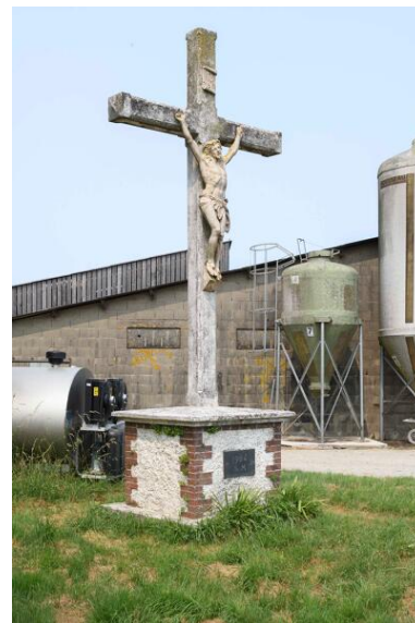
Croix de chemin de la Bonnière.