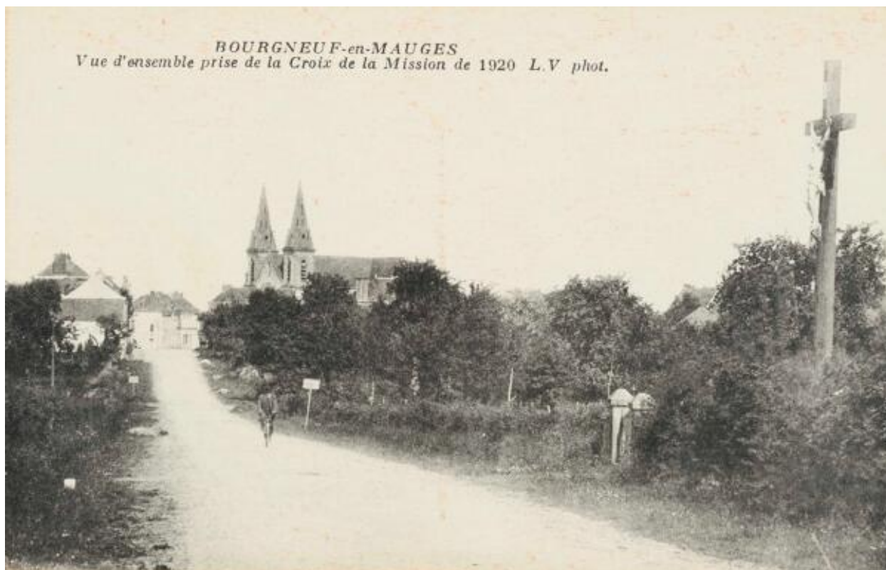
Vue d'ensemble de la croix de mission de 1920 (croix n° 10 du tableau de repérage), carte postale, début du XXe siècle. (AD Maine-et-Loire ; 19 Fi 1719).