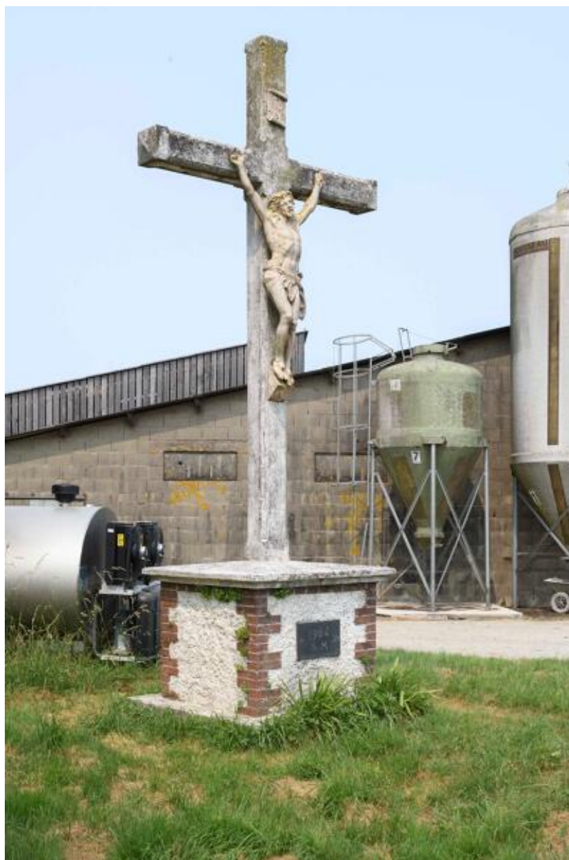
Croix de chemin de la Bonnière.