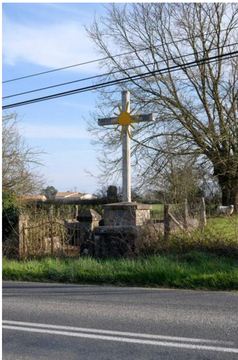
Vue de la croix monumentale à la sortie du bourg rue Jeanne Grimault (route départementale n° 17).