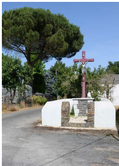
Croix de chemin, dite Croix Rouge. IVR52_20254900934NUCA