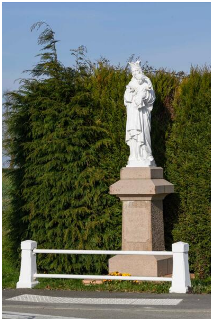
Vue d'ensemble de la statue de la Vierge à l'Enfant (1950).