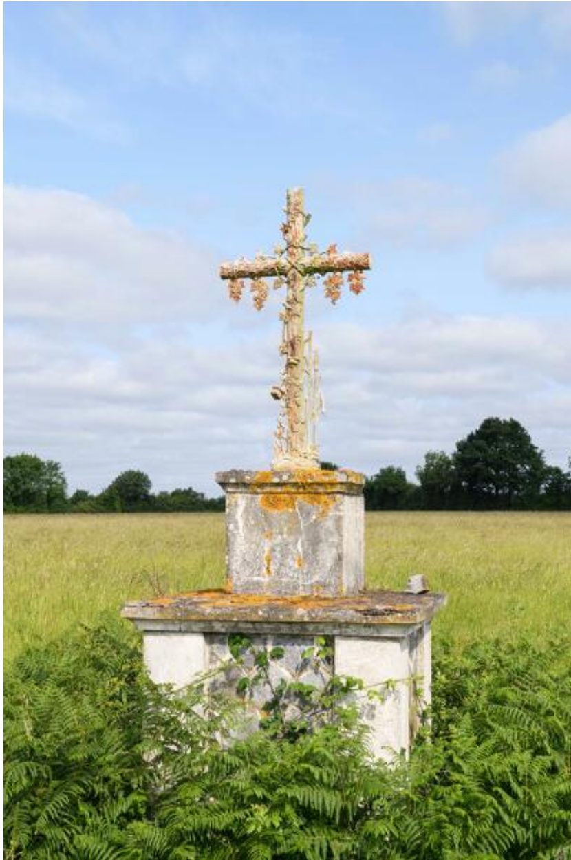
Croix de chemin du Plessis.