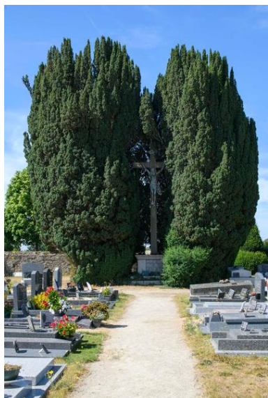
Vue d'ensemble de la croix de cimetière. IVR52_20254900902NUCA