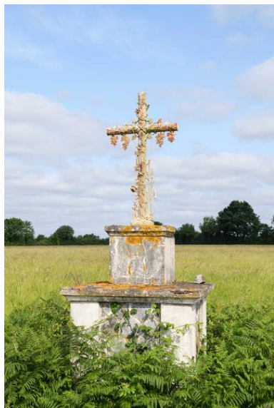
Croix de chemin du Plessis. IVR52_20254900640NUCA