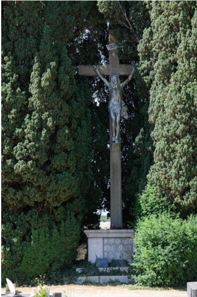
Croix de cimetière.