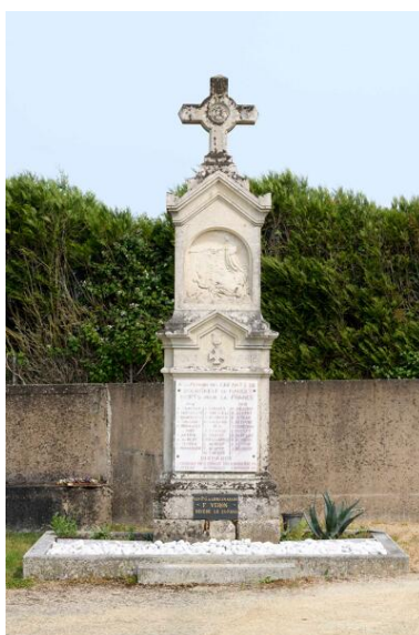
Monument aux morts. IVR52_20254900691NUCA