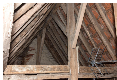
Vue du poinçon central de la charpente.