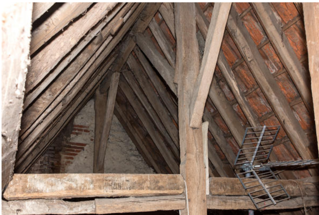
Vue du poinçon central de la charpente.