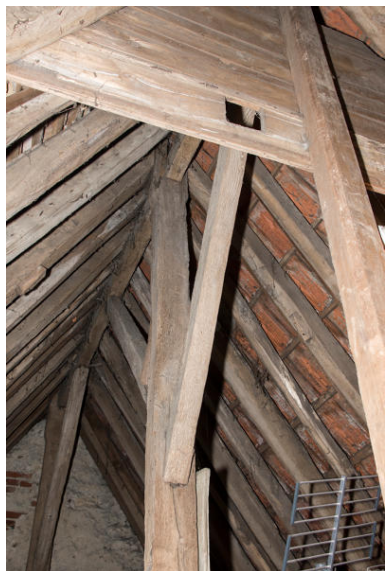
Vue de la ferme de charpente.