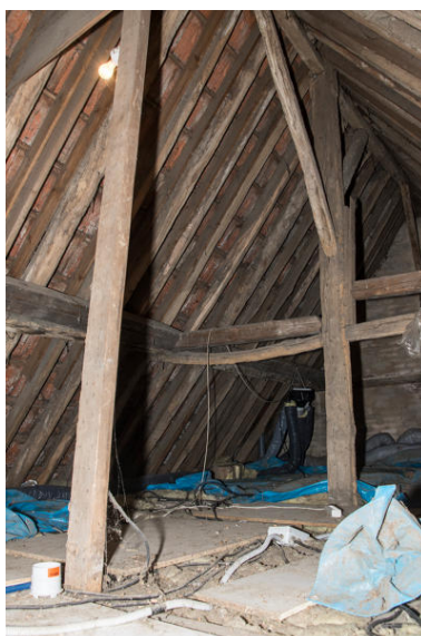
Vue générale de la charpente. IVR52_20207201193NUCA