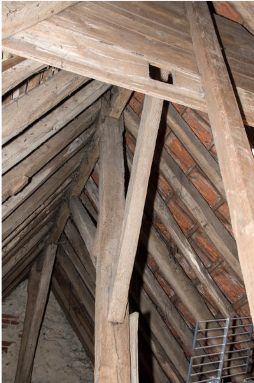
Vue de la ferme de charpente.