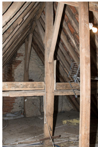
Vue générale de la charpente. IVR52_20207201195NUCA