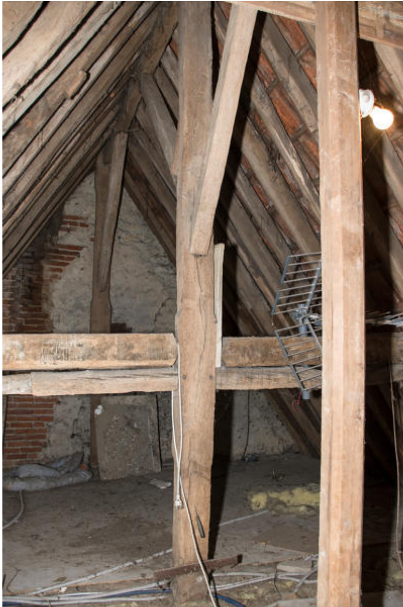
Vue générale de la charpente.