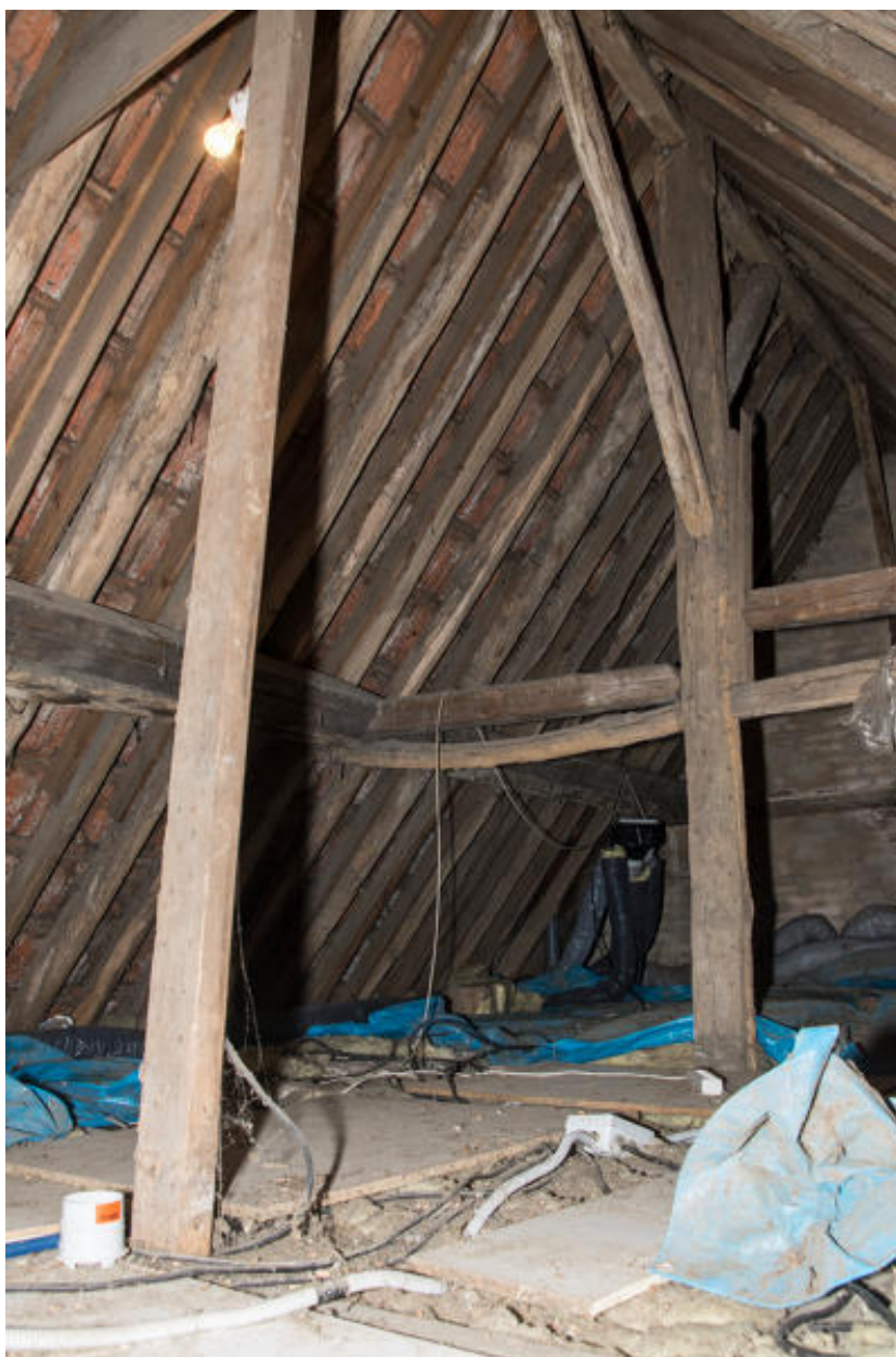
Vue générale de la charpente.