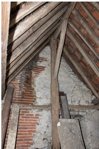
Vue du poinçon latéral nord. IVR52_20207201192NUCA