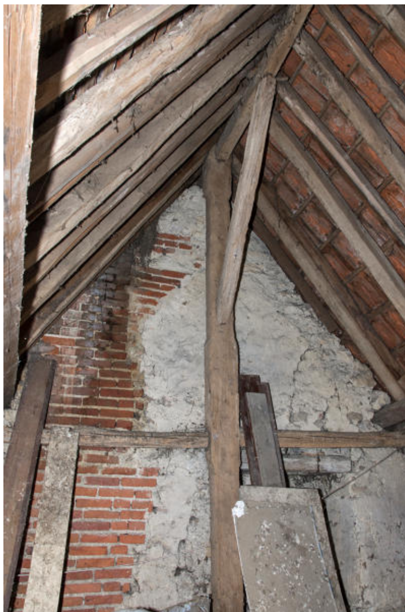
Vue du poinçon latéral nord.