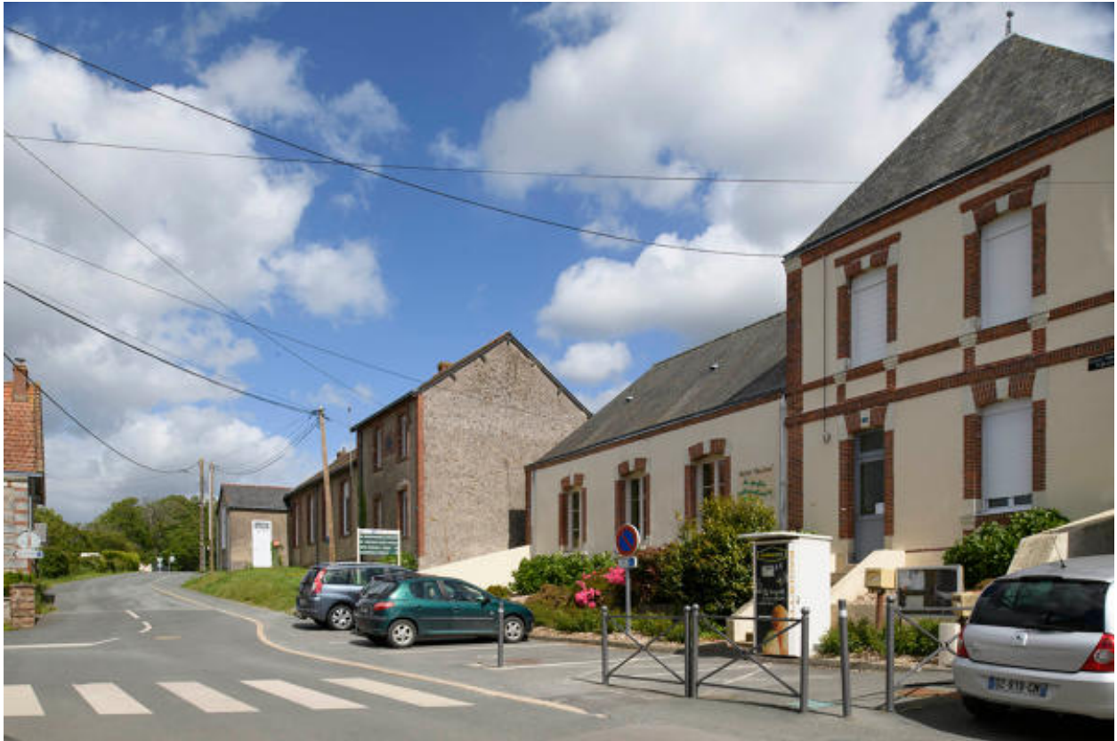
Les deux écoles de Beausse : publique au premier plan et privée au second.