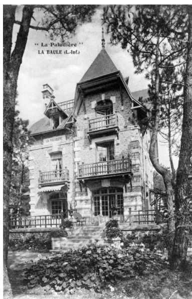
Façade sud de la villa La Paludière.