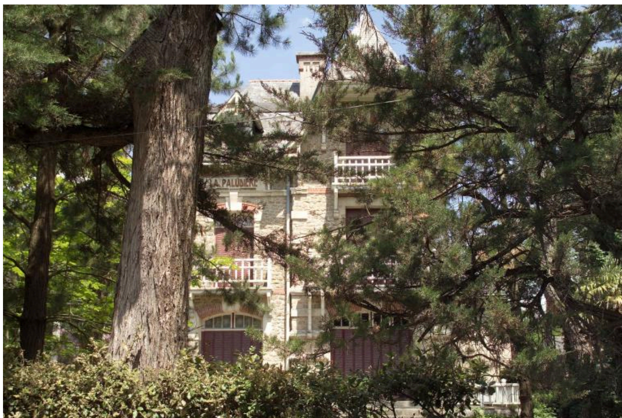
Vue d'ensemble de la villa La Paludière.