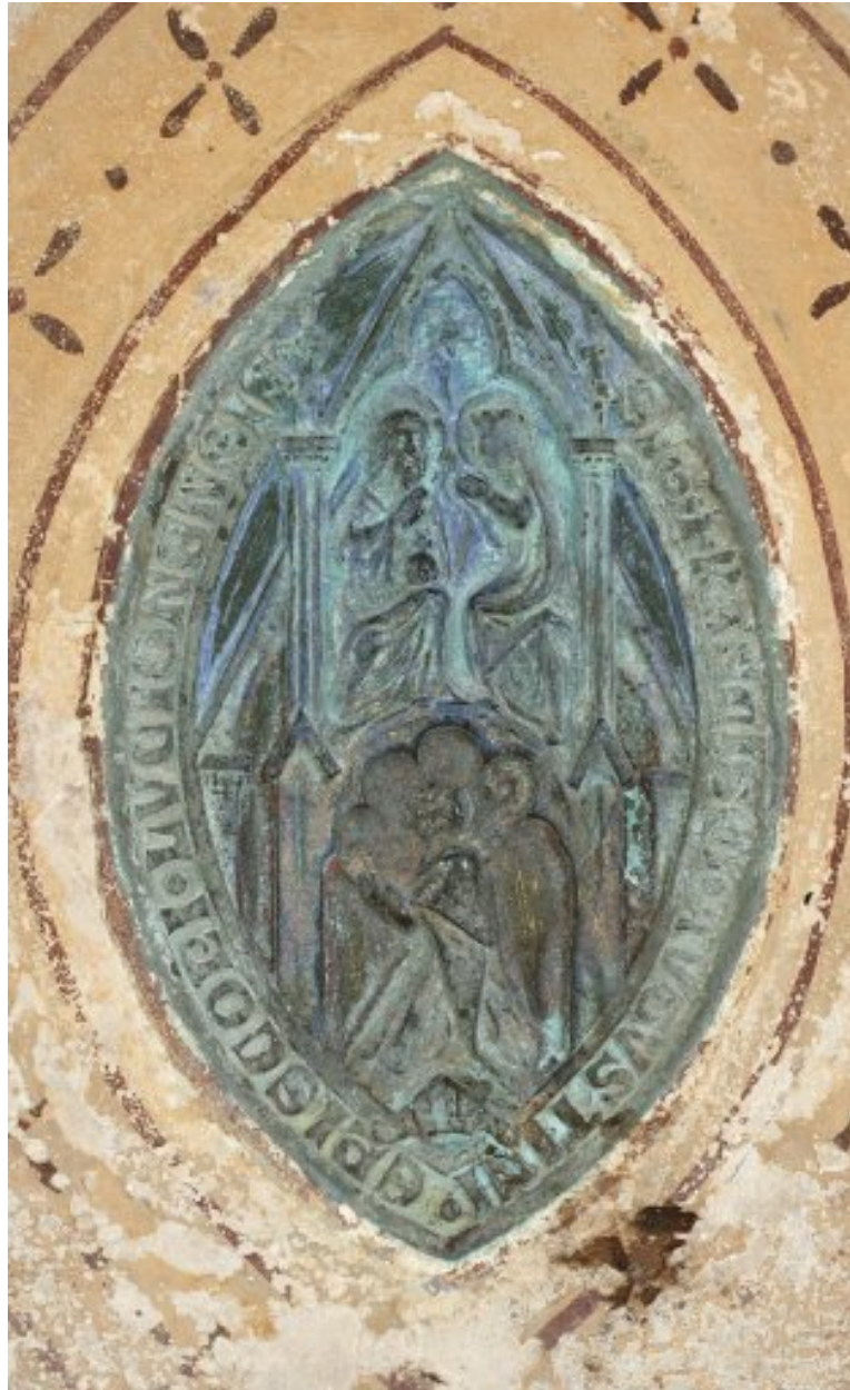
Sceau de Mgr Delamare, évêque de Luçon de 1856 à 1861.