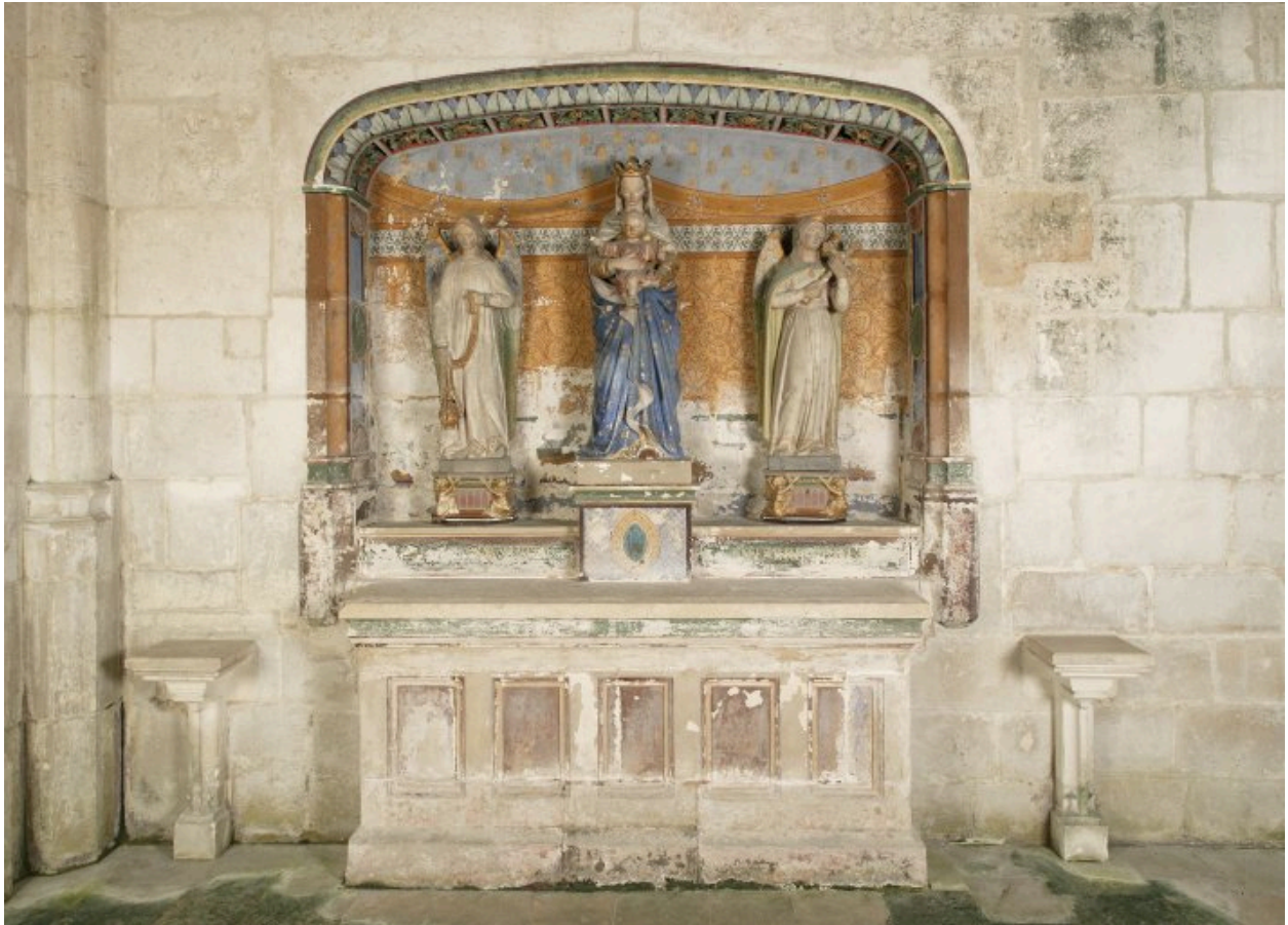
Vue d'ensemble du retable, avec l'autel et les crédences.