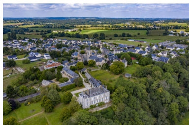
Une vue aérienne du bourg, depuis l'est.