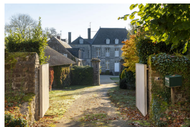
Le château de la Cour. IVR52_20215301656NUCA