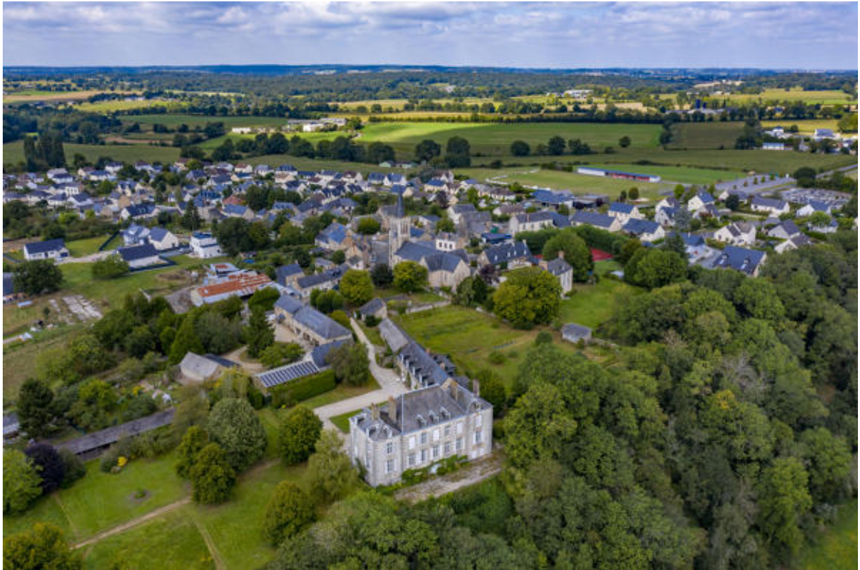
Une vue aérienne du bourg, depuis l'est.