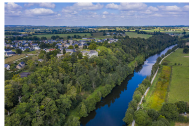
Une vue aérienne du bourg et de la Mayenne, depuis le sud. IVR52_20215301187NUCA