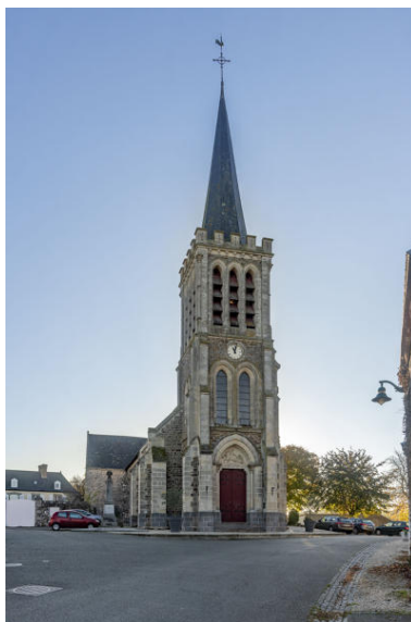
L'église.