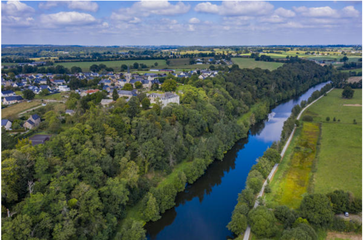
Une vue aérienne du bourg et de la Mayenne, depuis le sud.