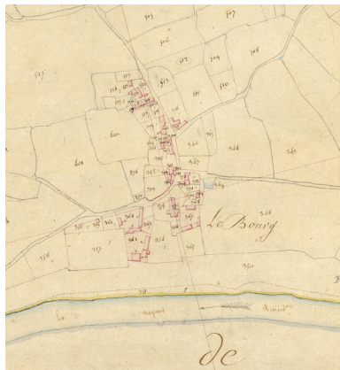
Le bourg sur le plan cadastral de 1820. IVR52_20215301533NUCA