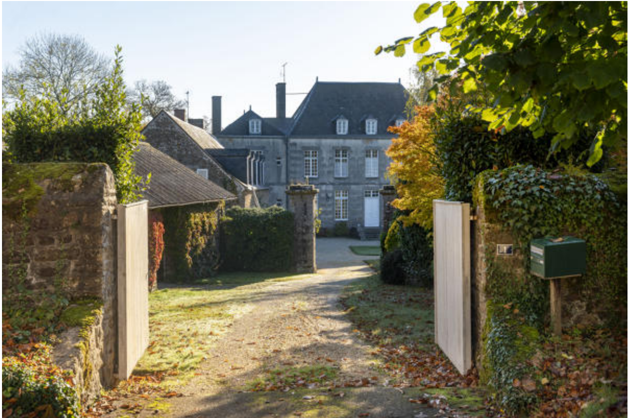
Le château de la Cour.