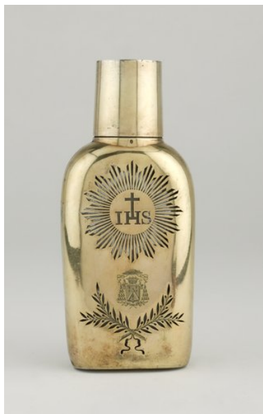
Réserve à saint Chrême, vue de face.