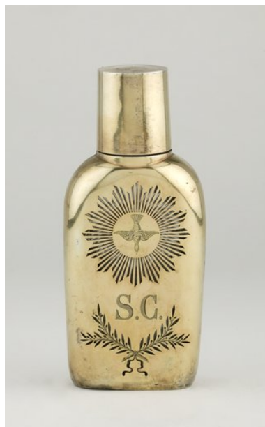
Réserve à saint Chrême, vue de dos.