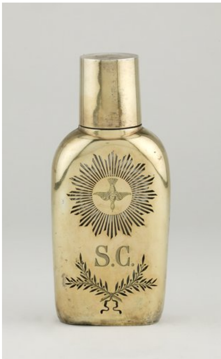
Réserve à saint Chrême, vue de dos.