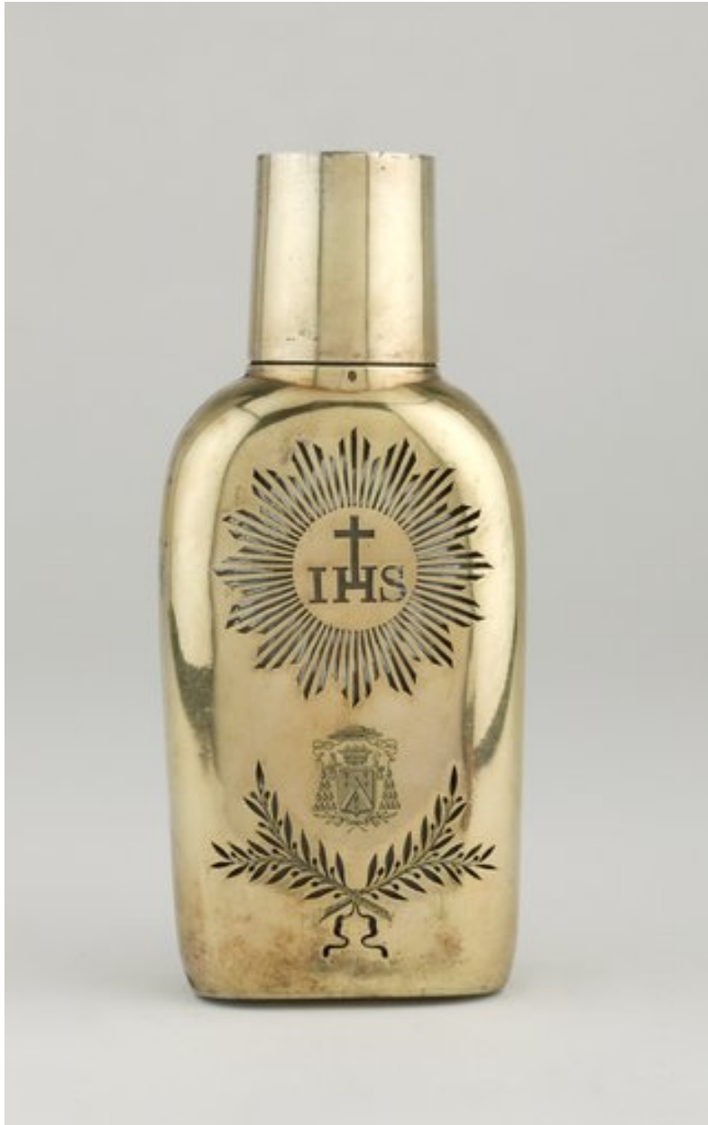
Réserve à saint Chrême, vue de face.