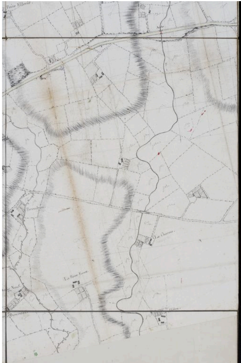
Plan de la route royale de Paris à Nantes, vers 1747-1748. En bas : Le Hidou.