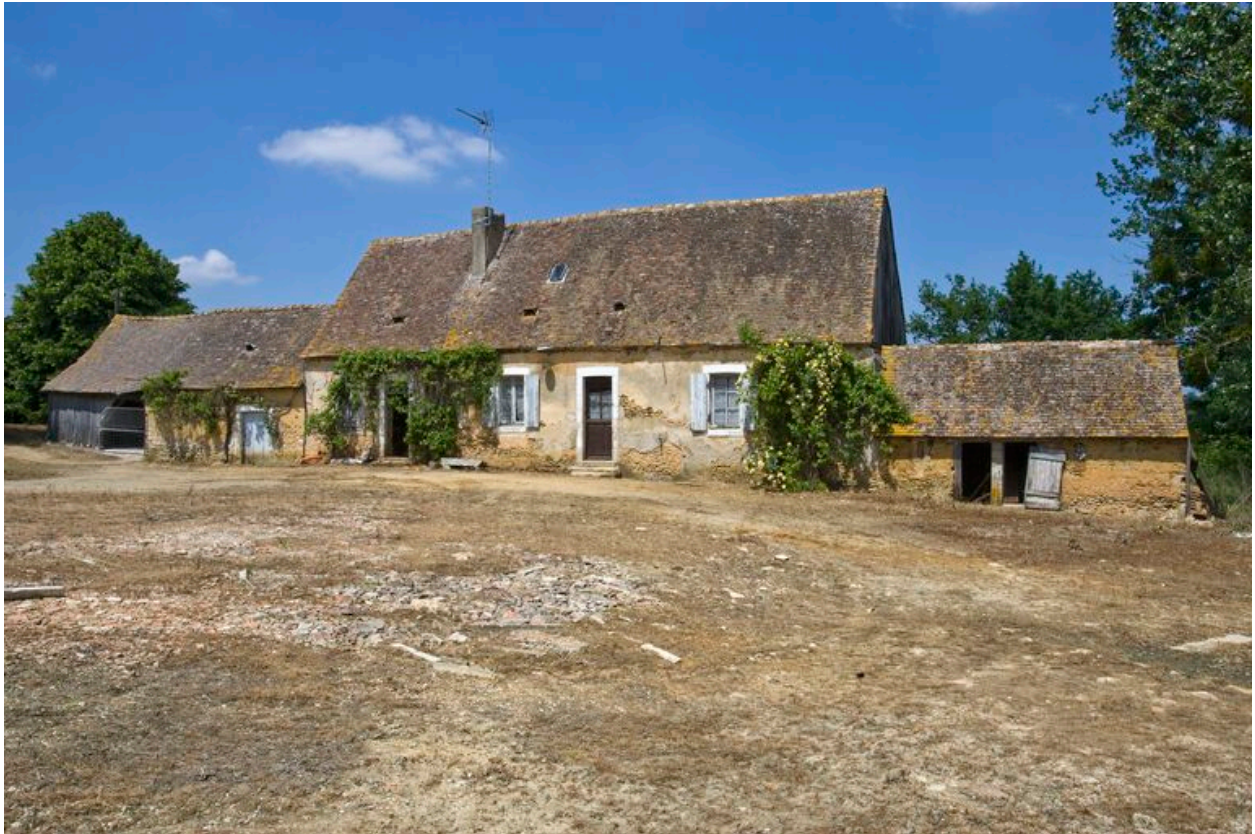
Logis avec fournil à gauche et porcheries à droite.