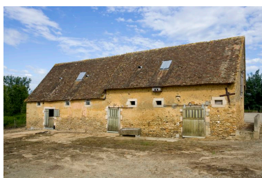
Étables-fenil.