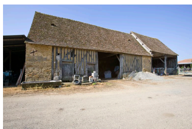
Grange-étable avec remise accolée. IVR52_20107202346NUCA