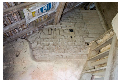
Logis, essentage de bardeaux de l'ancien pignon sud du logis. IVR52_20107202348NUCA