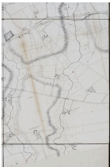
Plan de la route royale de Paris à Nantes, vers 1747-1748. En bas : Le Hidou. Autr. Jacques Oudry, IVR52_20087201295NUCA