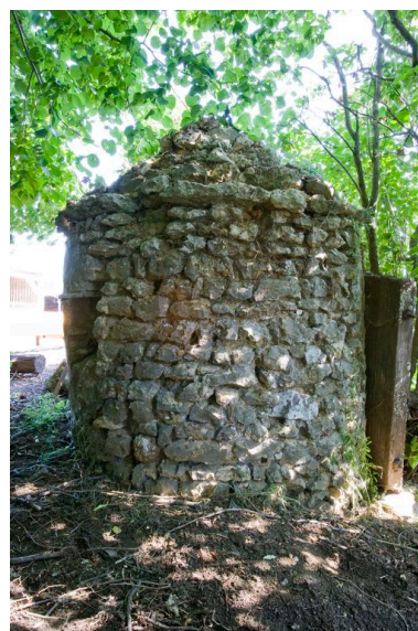
Puits.