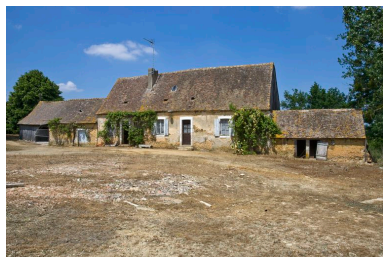
Logis avec fournil à gauche et porcheries à droite.