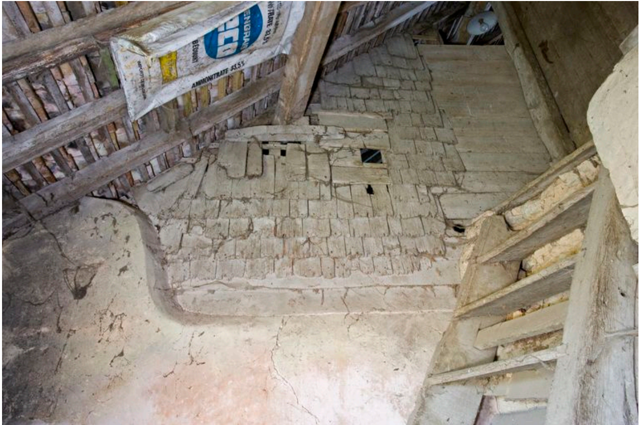
Logis, essentage de bardeaux de l'ancien pignon sud du logis.