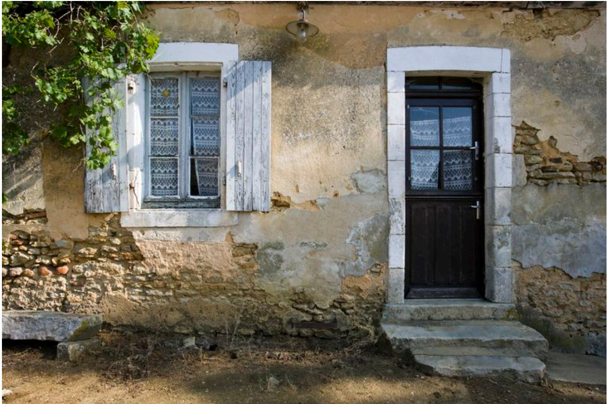
Logis, détail de l'élévation sur cour.