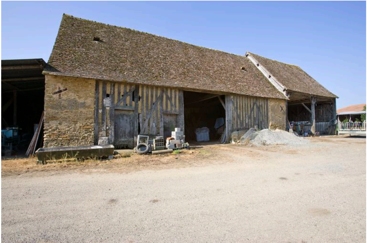
Grange-étable avec remise accolée.