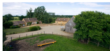
Vue générale. IVR52_20107202411NUCA