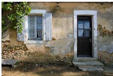
Logis, détail de l'élévation sur cour.