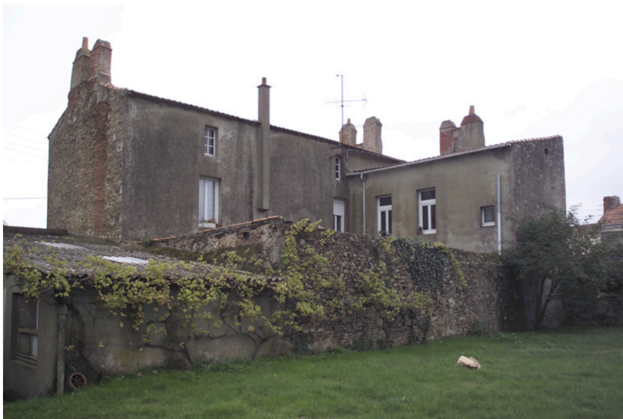
La façade postérieure vue depuis le jardin de la maison n° 5 rue Saint-Gilles.