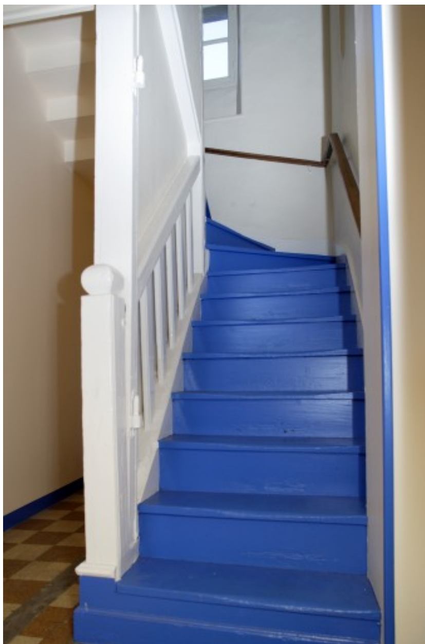
Le départ de l'escalier.