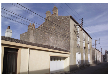
Vue de la façade depuis la rue. IVR52_20034401626NUCA