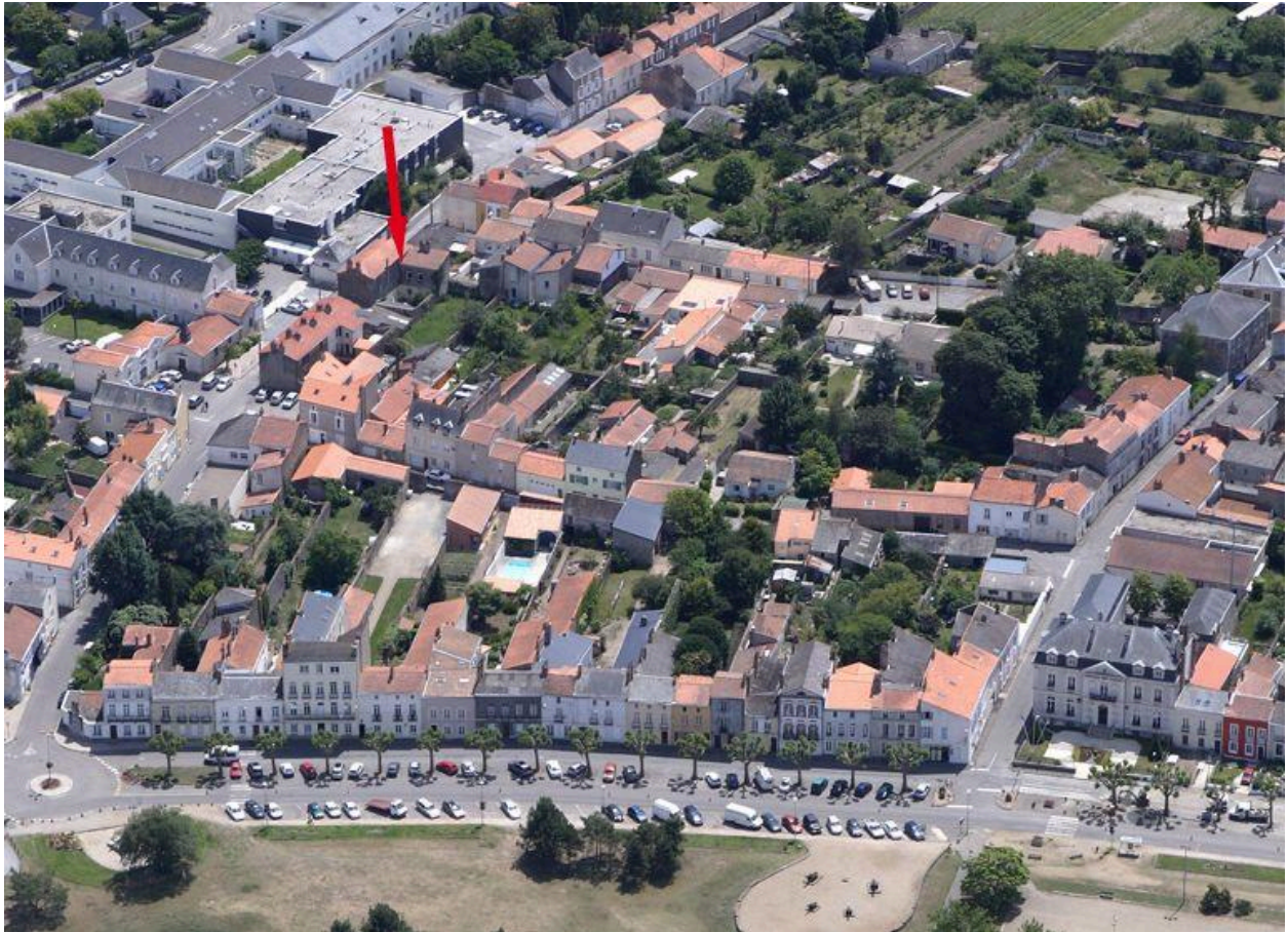
Situation sur la vue aérienne, 2010.