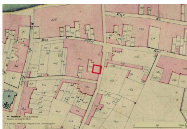
Situation sur cadastre 1810. IVR52_20094400503NUDA