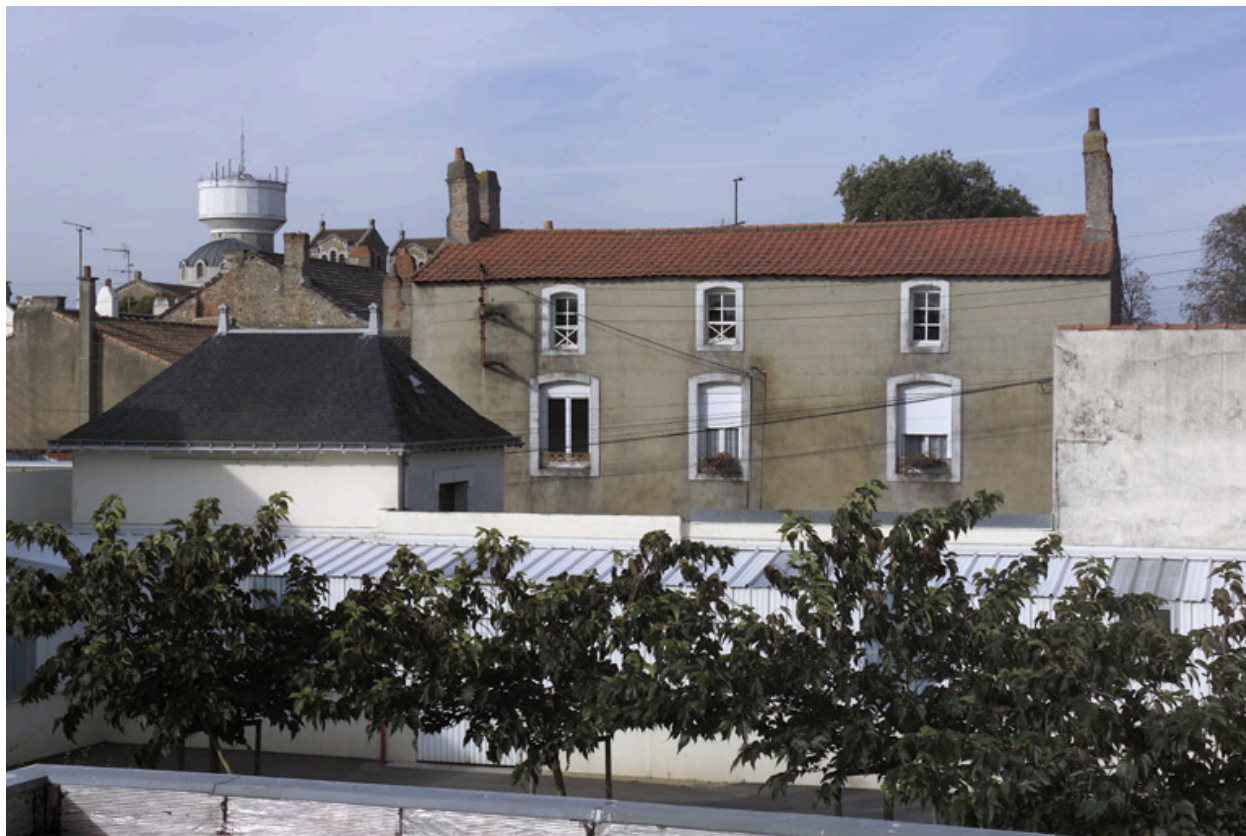
La façade sur la rue vue depuis l'hôpital.