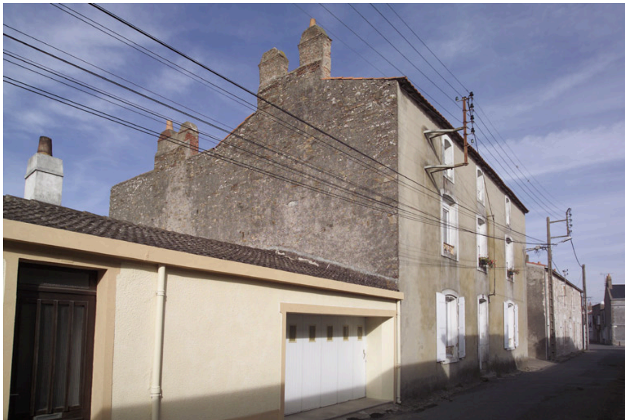
Vue de la façade depuis la rue.