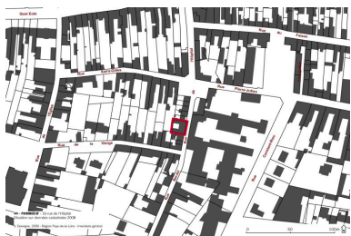
Situation sur données cadastrales 2008. IVR52_20094400504NUDA