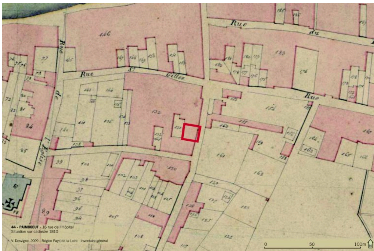
Situation sur cadastre 1810.