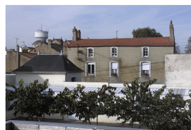
La façade sur la rue vue depuis l'hôpital.