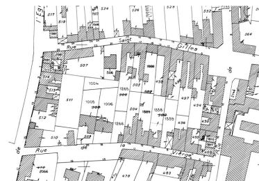
Plan cadastral, 1999, extrait. IVR52_20034400112NUCA