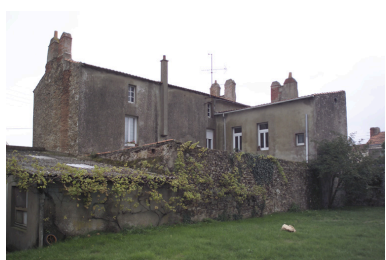
La façade postérieure vue depuis le jardin de la maison n° 5 rue Saint-Gilles.