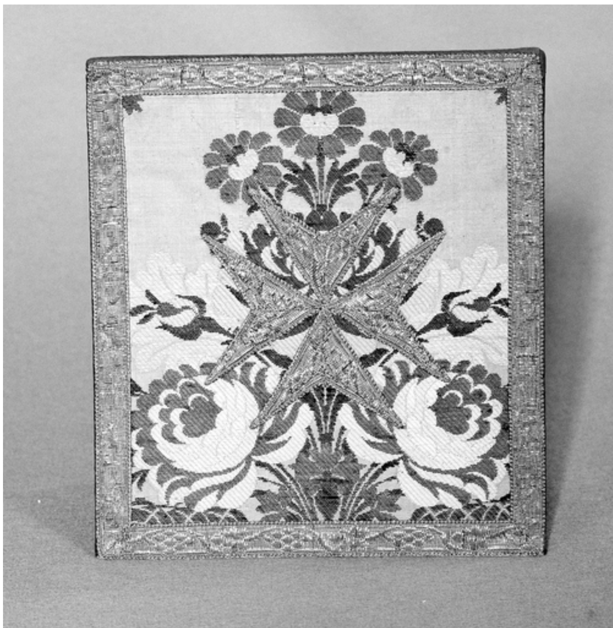
La bourse de corporal.