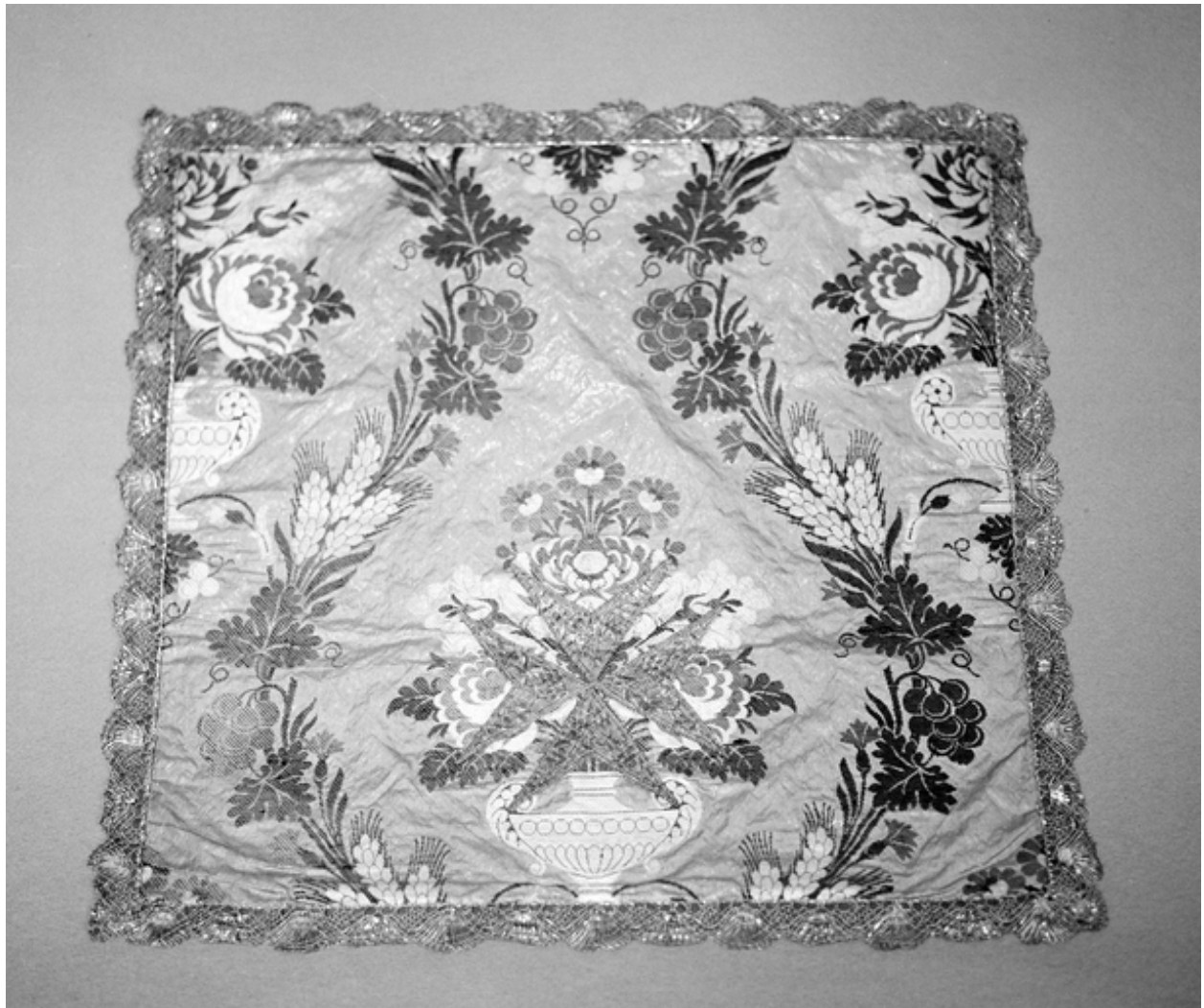
Le voile de calice.