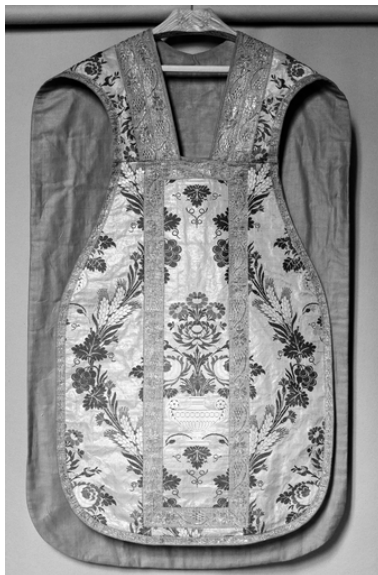
Vue du devant de la chasuble.