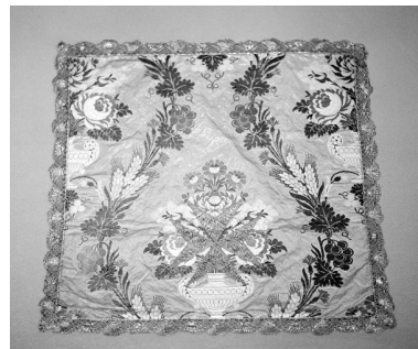
Le voile de calice.