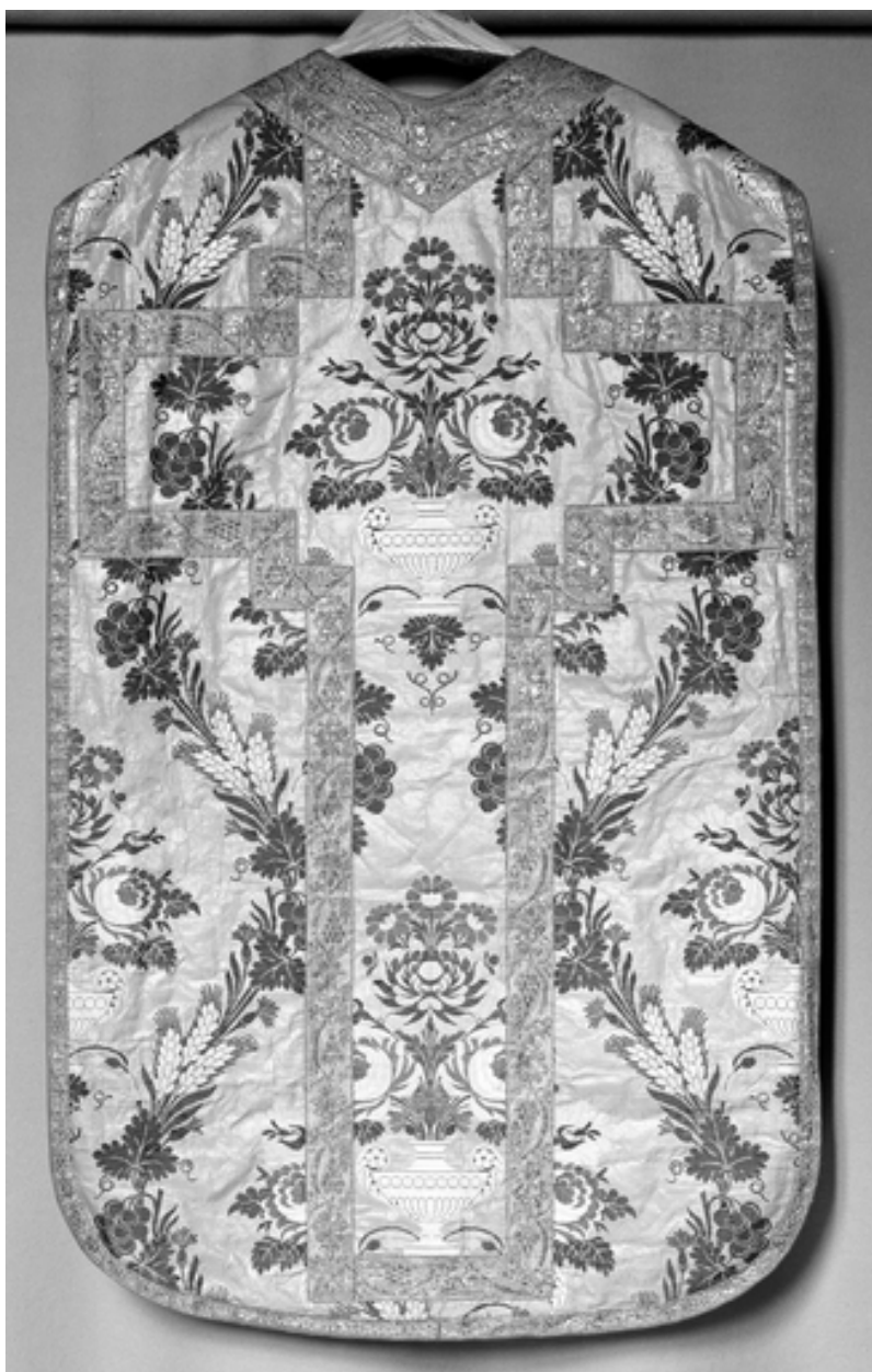
Vue générale du dos de la chasuble.