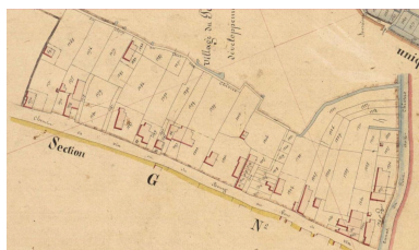
La parcelle 1269, en haut à gauche, sur le plan cadastral de 1836.