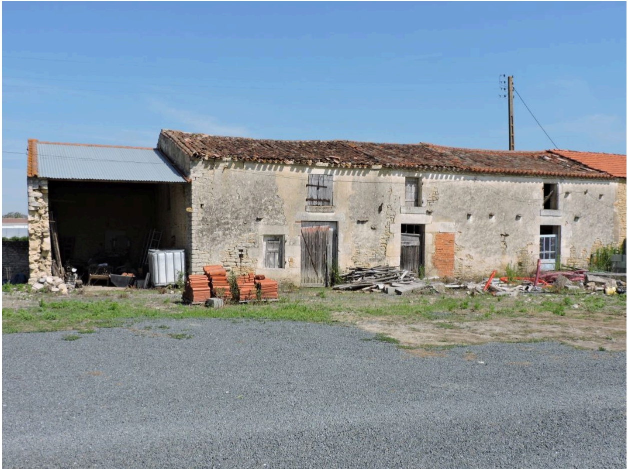
La maison vue depuis le sud-est.