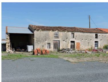
La maison vue depuis le sud-est.