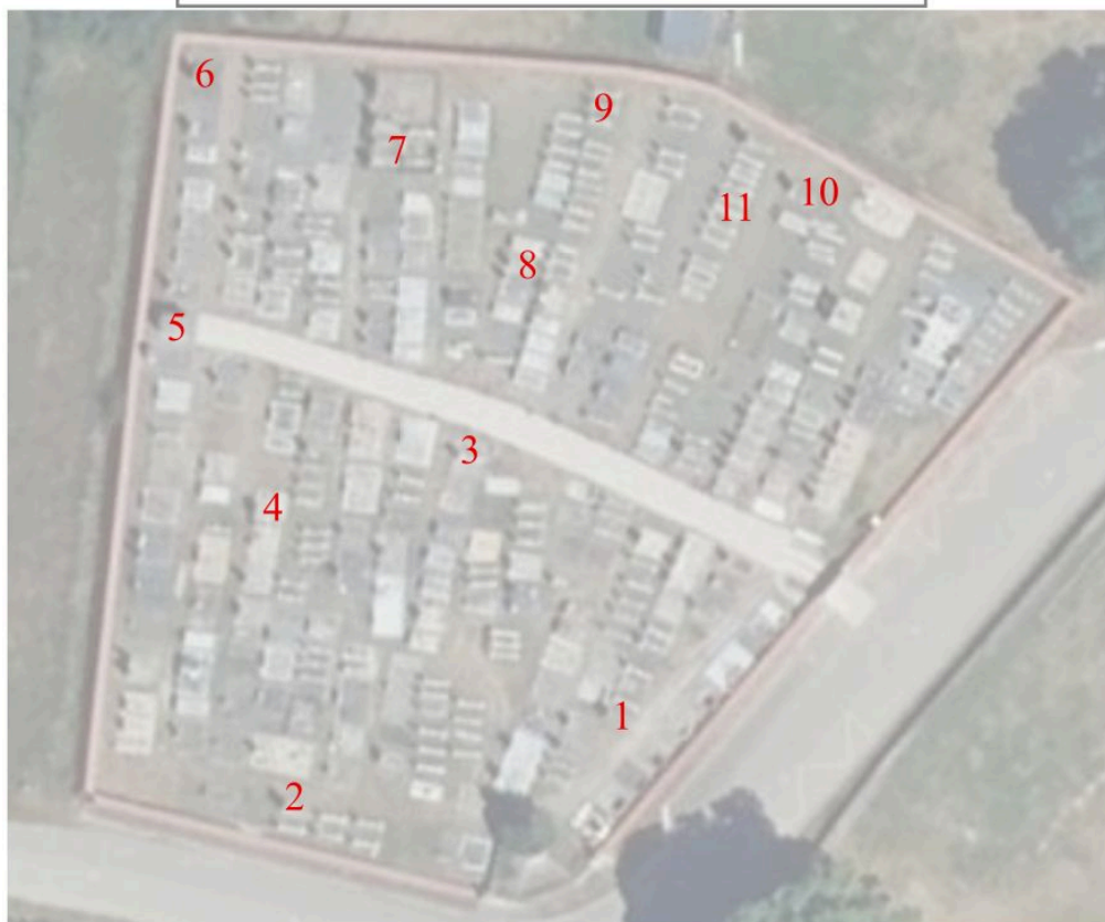
Schéma de répartition des tombeaux relevés dans le cimetière de Sainte-Christine.