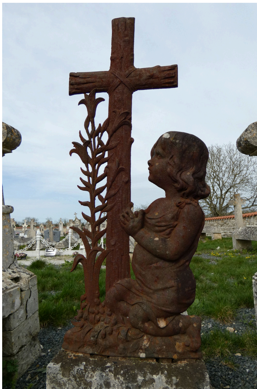
Croix en ferronnerie avec lys et enfant agenouillé.