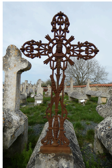
Croix en ferronnerie avec épis et tête du Christ.