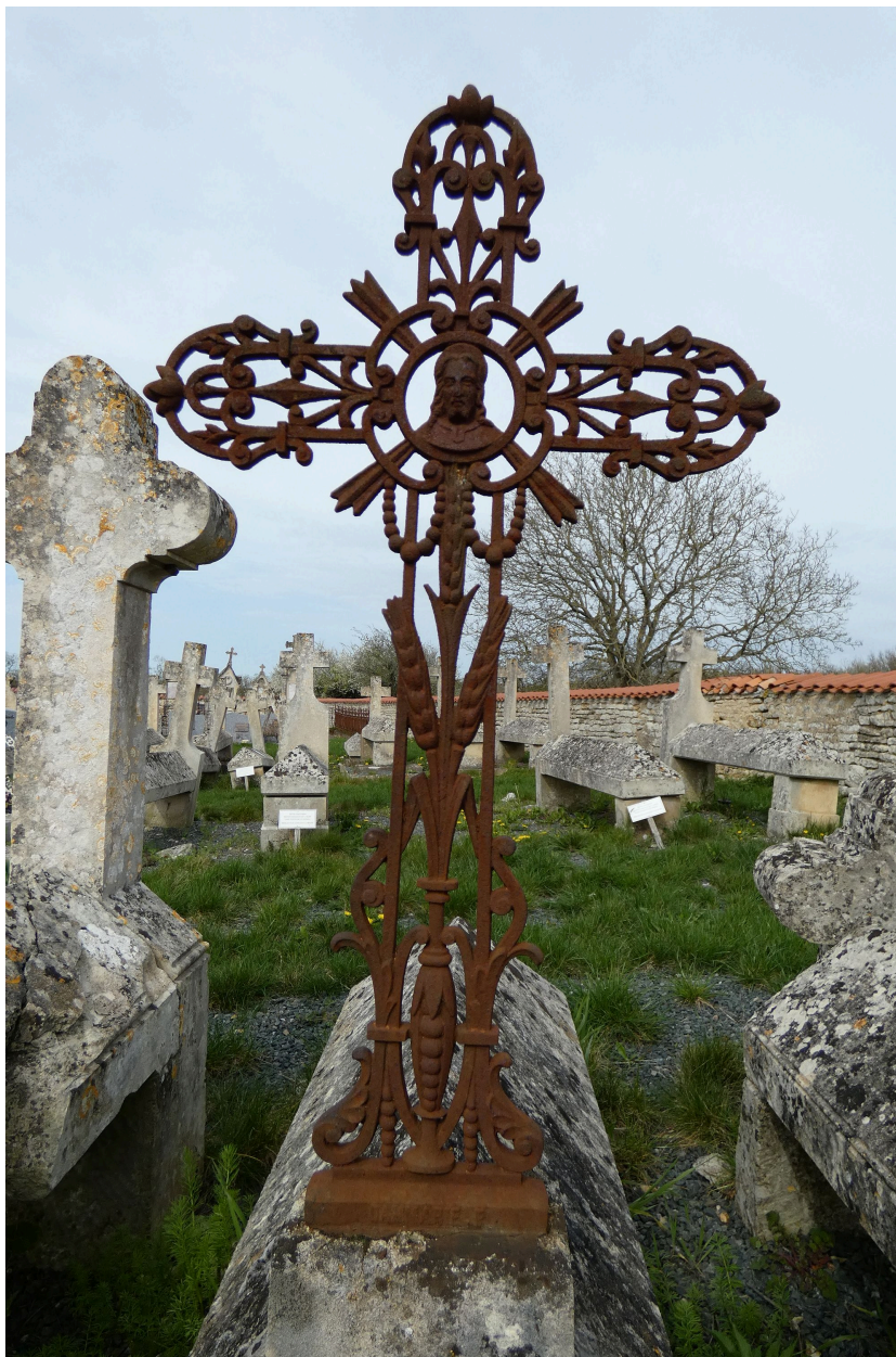
Croix en ferronnerie avec blés et tête du Christ.