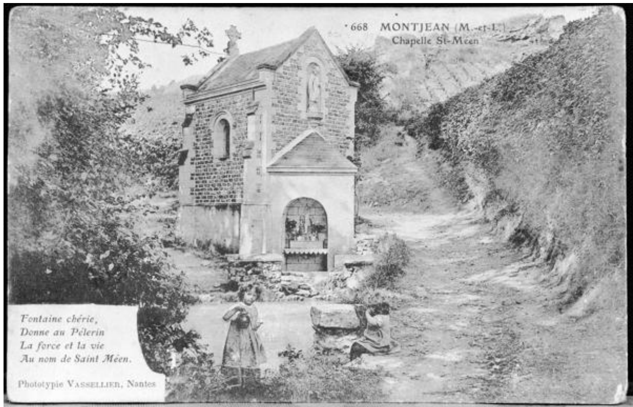
Chapelle et fontaine Saint Méén, carte postale, vers 1900.