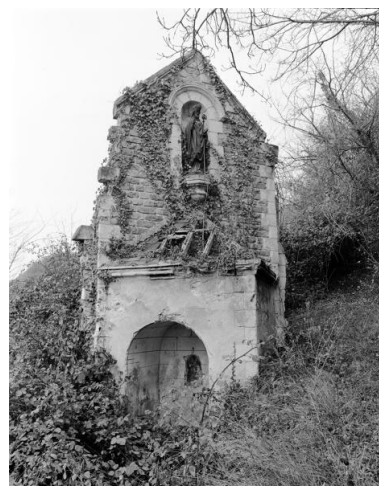
Chapelle et oratoire depuis l'est, 1985.