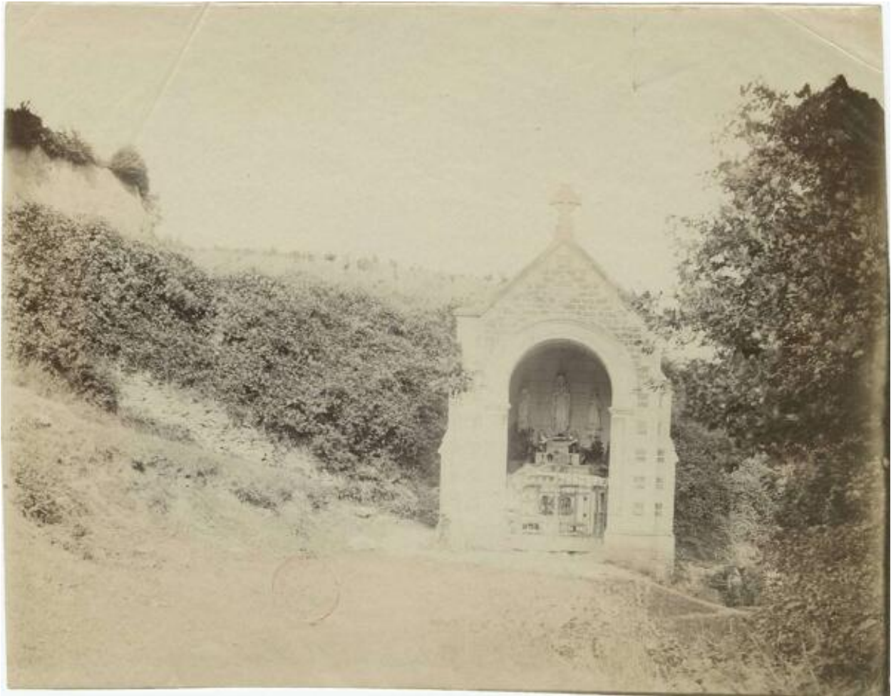
Chapelle depuis le nord-ouest, photographie, 1895. (AD Maine-et-Loire ; 11 Fi 4603).