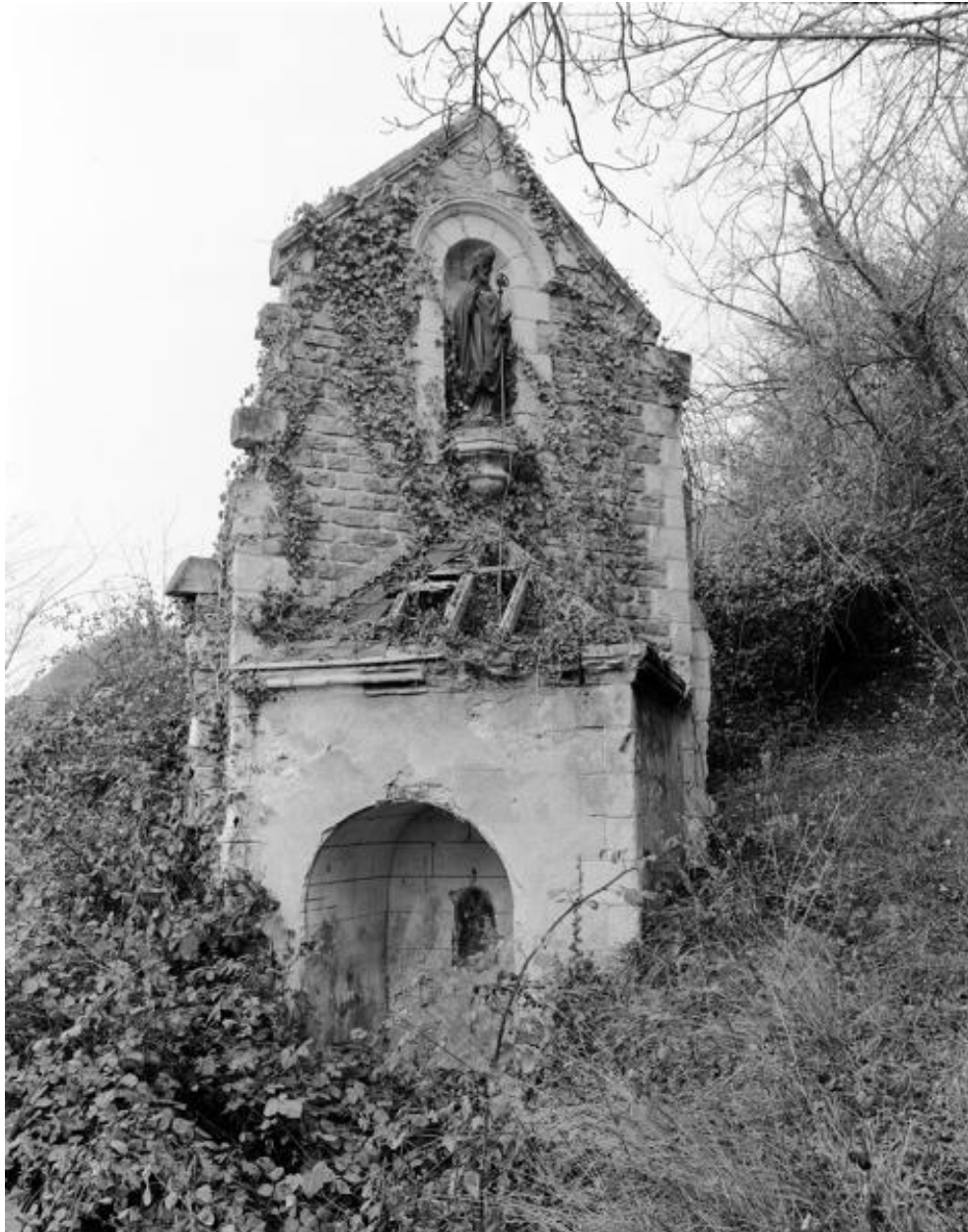
Chapelle et oratoire depuis l'est, 1985.