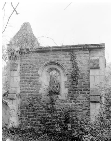
Flanc nord de la chapelle, 1985.