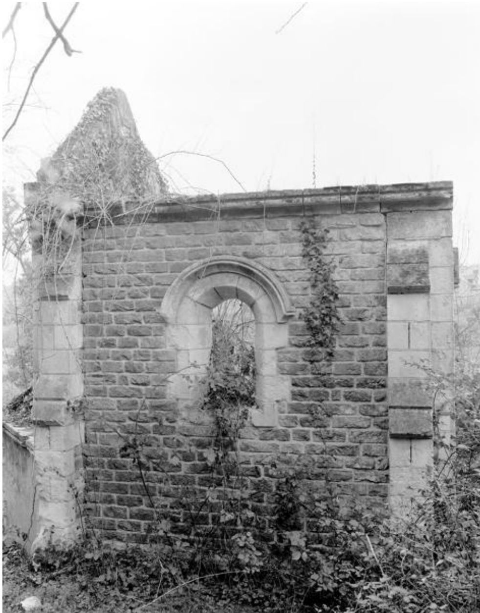
Flanc nord de la chapelle, 1985.