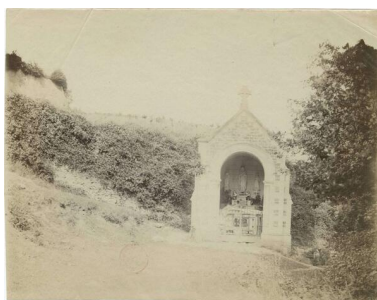
Chapelle depuis le nord-ouest, photographie, 1895. IVR52_20254900058NUCA