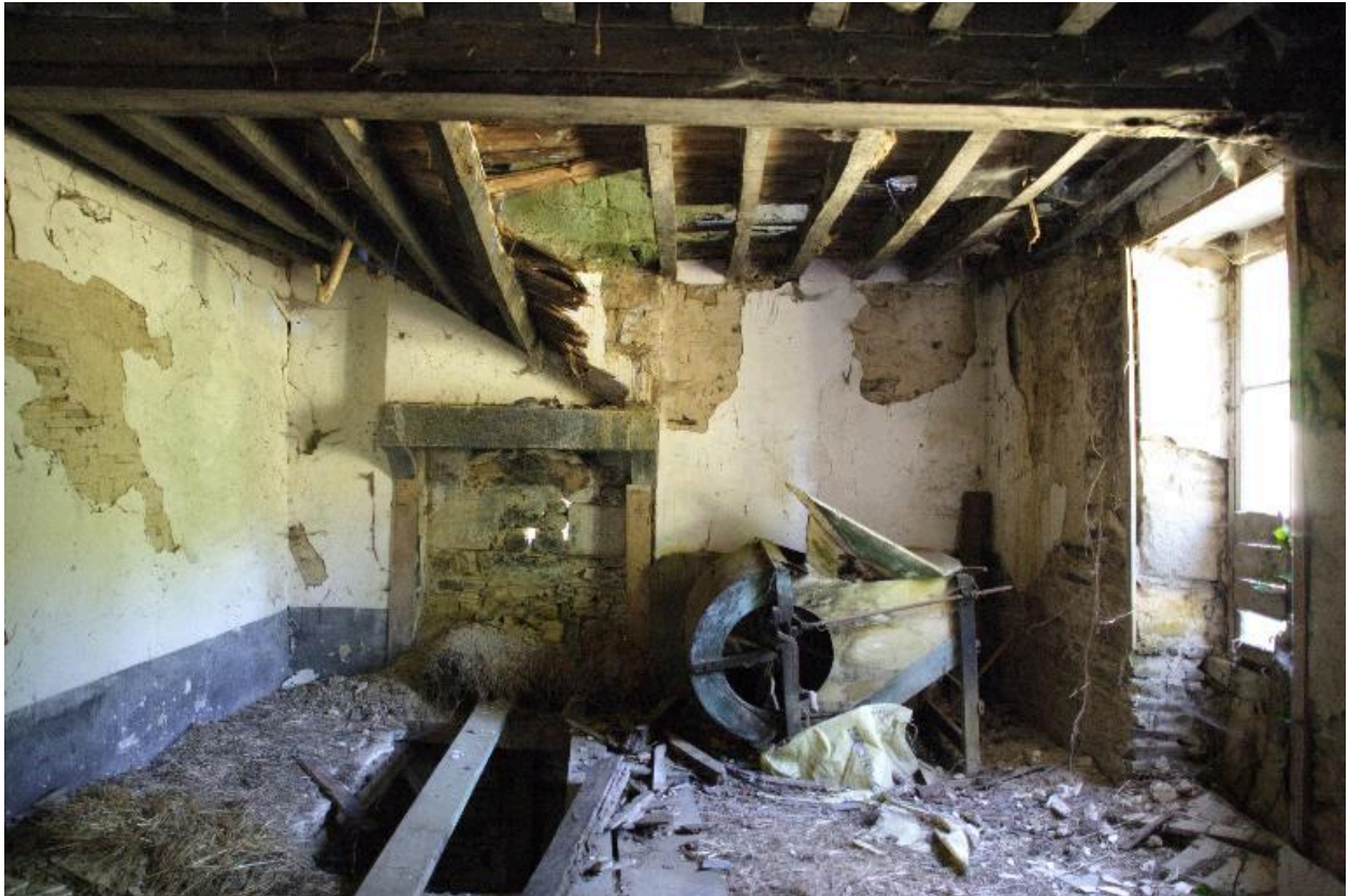
La pièce ouest du logis vue depuis l'est.