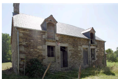
Le moulin-logis vu depuis le nord.

IVR52_20055300404NUCA