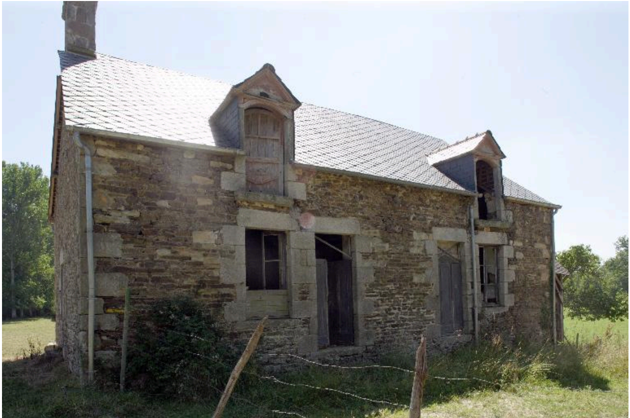
Le moulin-logis vu depuis le nord.