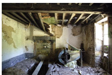
La pièce ouest du logis vue depuis l'est.

IVR52_20055300406NUCA