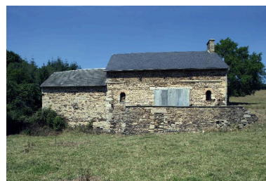
Le moulin-logis et la remise vus depuis le sud.

Phot. François Lasa IVR52_20055300405NUCA