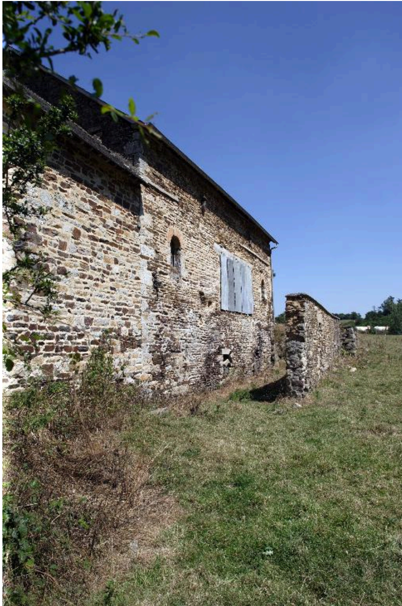
Le moulin-logis, la remise et l'emplacement de l'ancien canal vus depuis le sud-ouest.