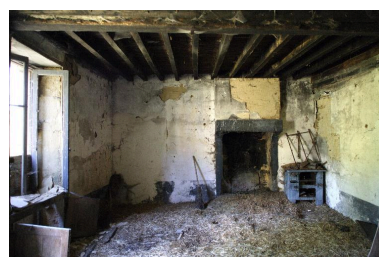
La pièce est du logis vue depuis l'ouest.

Phot. François Lasa IVR52_20055300402NUCA