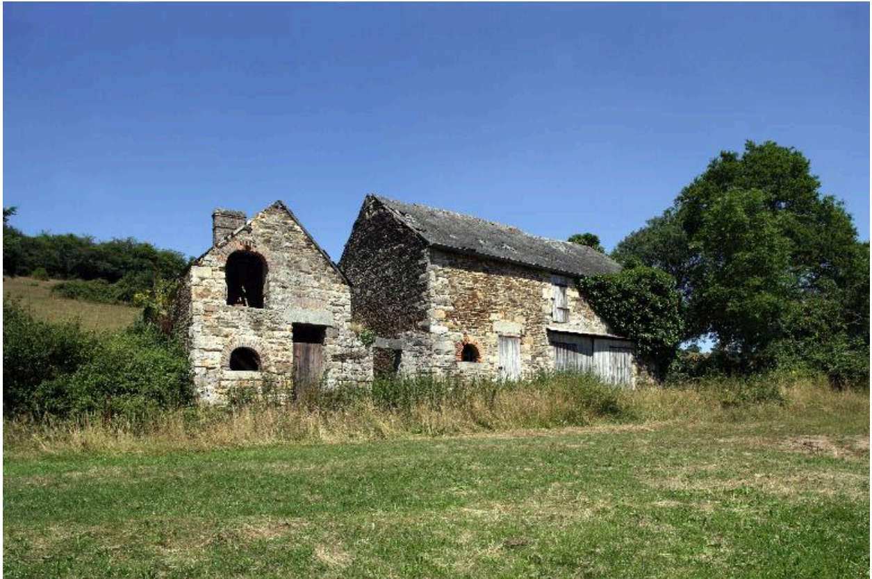
Le fournil et l'étable vus depuis le sud.