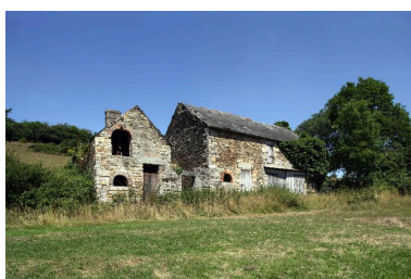
Le fournil et l'étable vus depuis le sud.

IVR52_20055300407NUCA