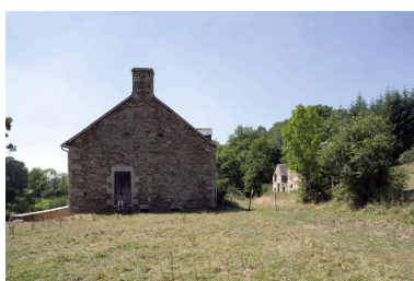
Le moulin-logis vu depuis l'est.

IVR52_20055300403NUCA