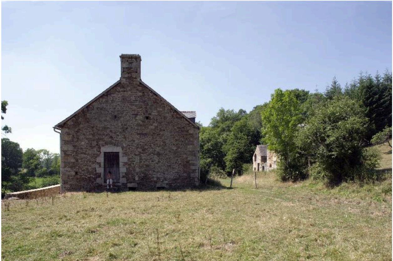
Le moulin-logis vu depuis l'est.