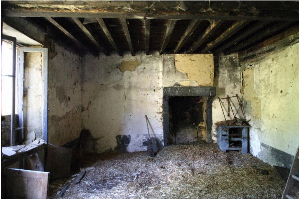
La pièce est du logis vue depuis l'ouest.