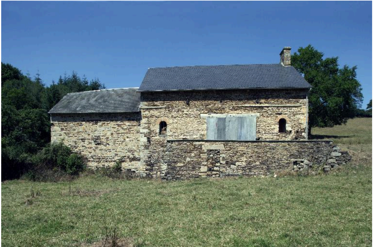
Le moulin-logis et la remise vus depuis le sud.