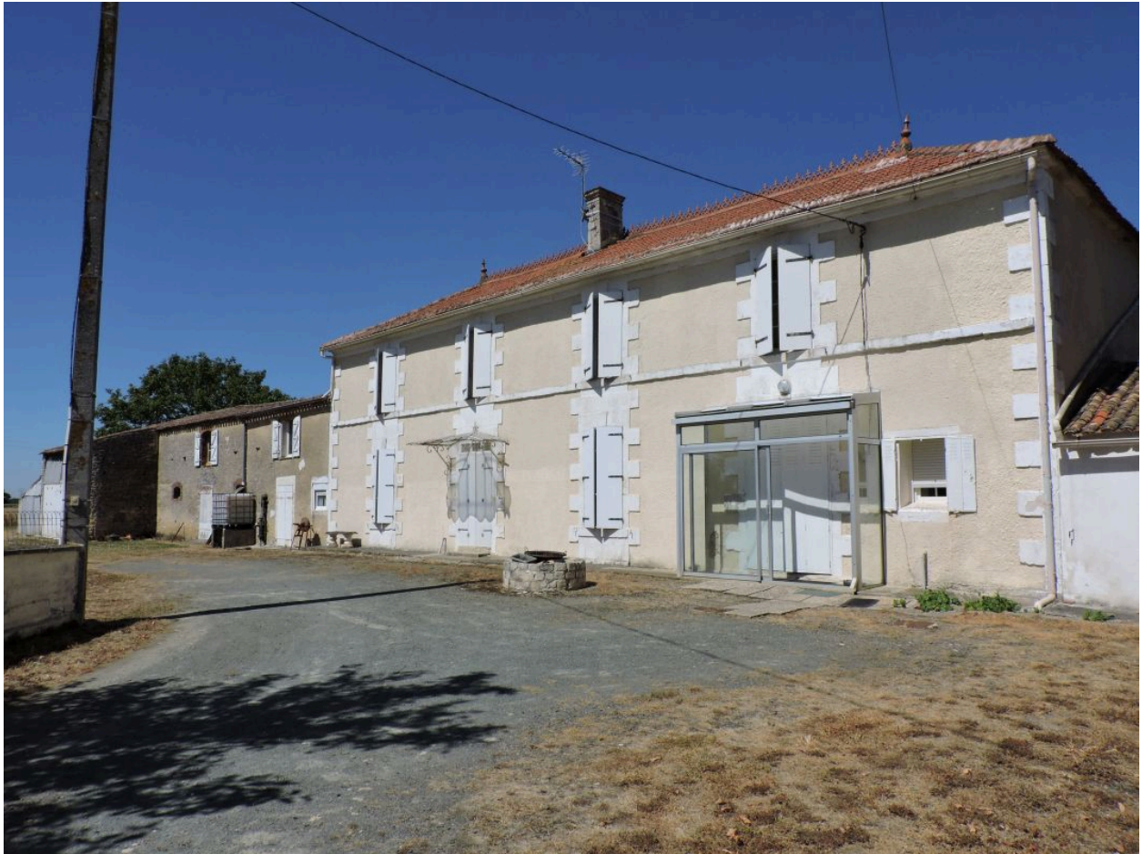
Le logis et ses dépendances vus depuis l'est.