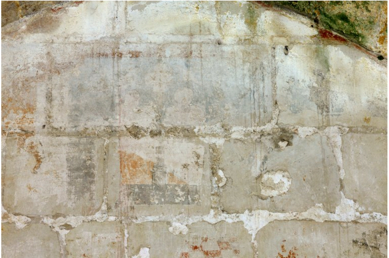
Détail de la partie centrale avec une fenêtre géminée couverte d'arcs trilobés.