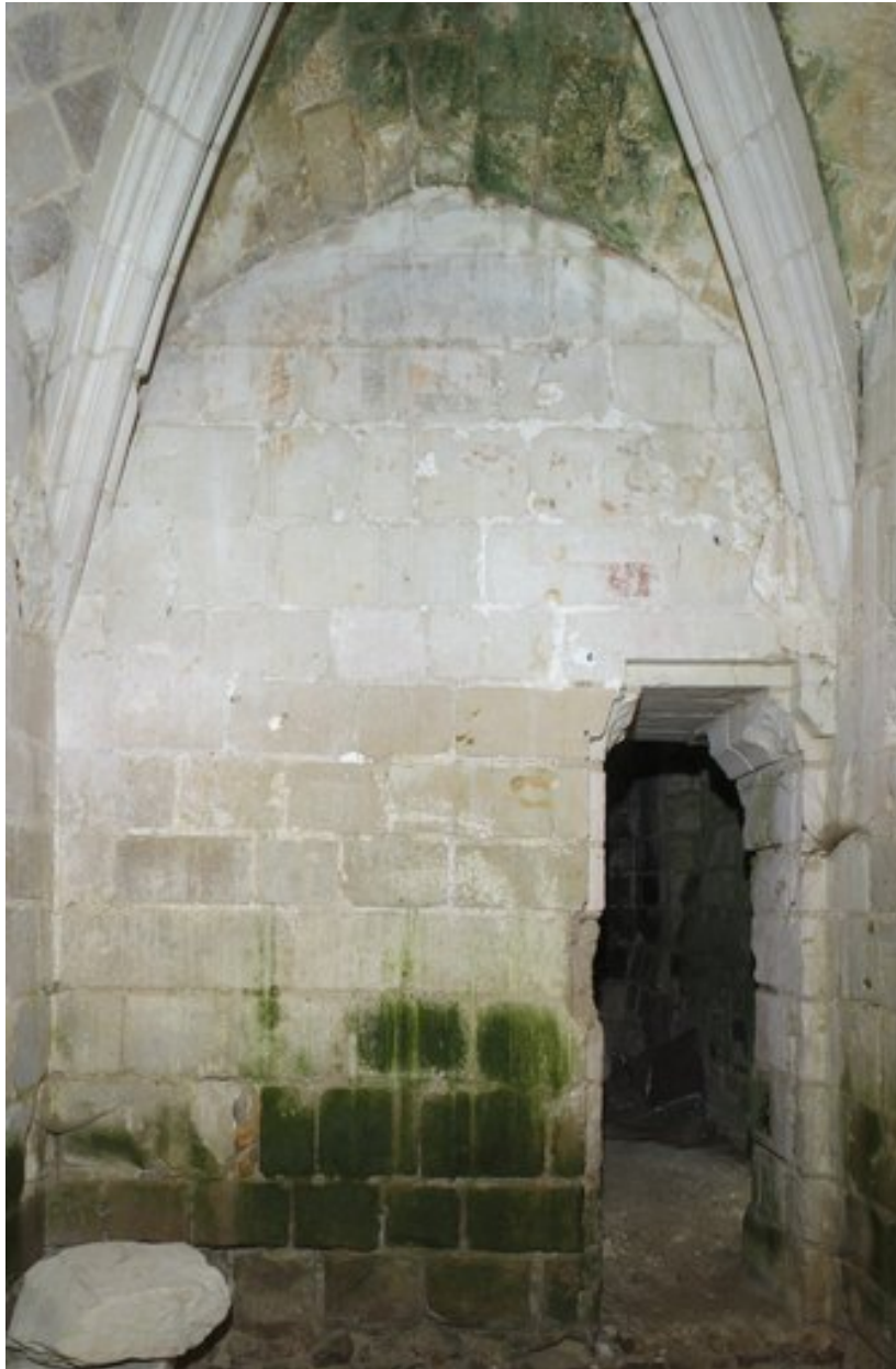
Vue générale de la paroi conservant dans sa partie supérieure des vestiges d'un décor peint.