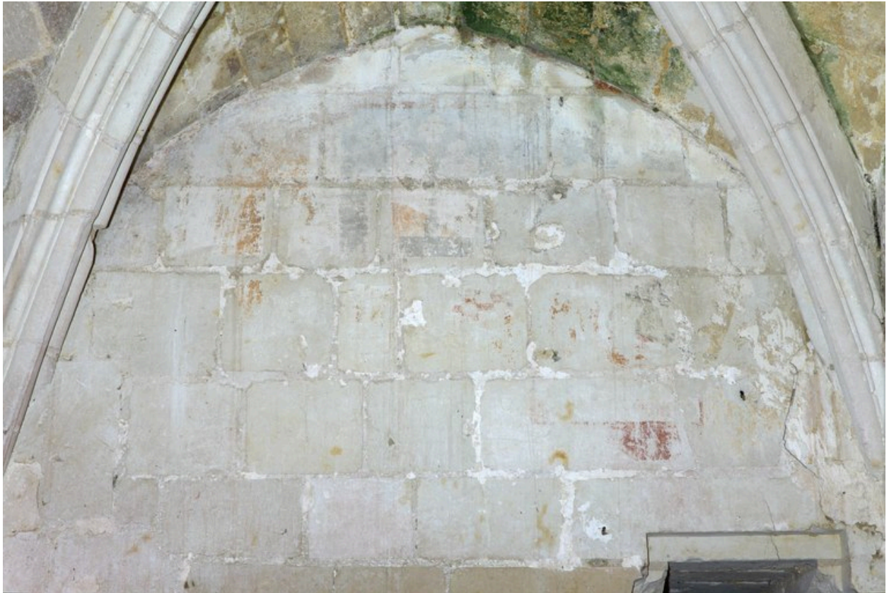
Détail du fragment de décor peint pouvant peut-être appartenir à une scène de l'Annonciation.