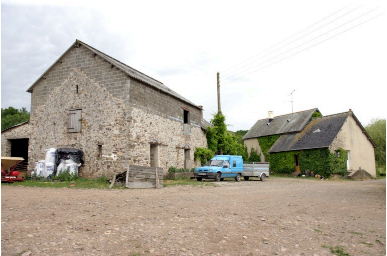
L'étable et l'ancienne étable à chevaux (actuel logis) vus depuis le nord-ouest.