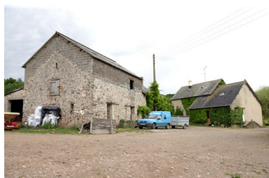
L'étable et l'ancienne étable à chevaux (actuel logis) vus depuis le nord-ouest.