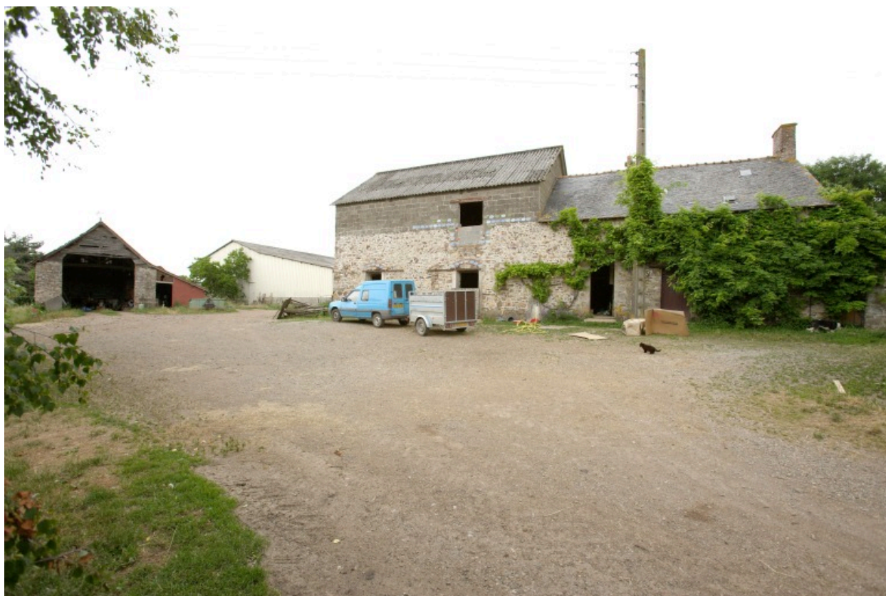
L'ancien logis-étable et la remise vus depuis le sud-ouest.