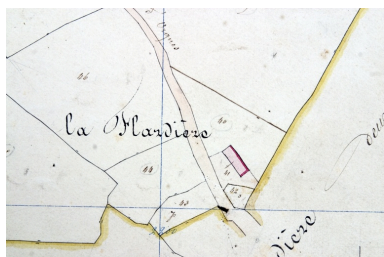
Extrait du plan cadastral de 1842, section A1.