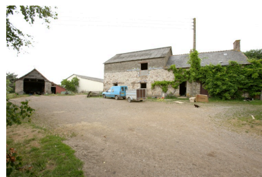
L'ancien logis-étable et la remise vus depuis le sud-ouest. IVR52_20055301872NUCA