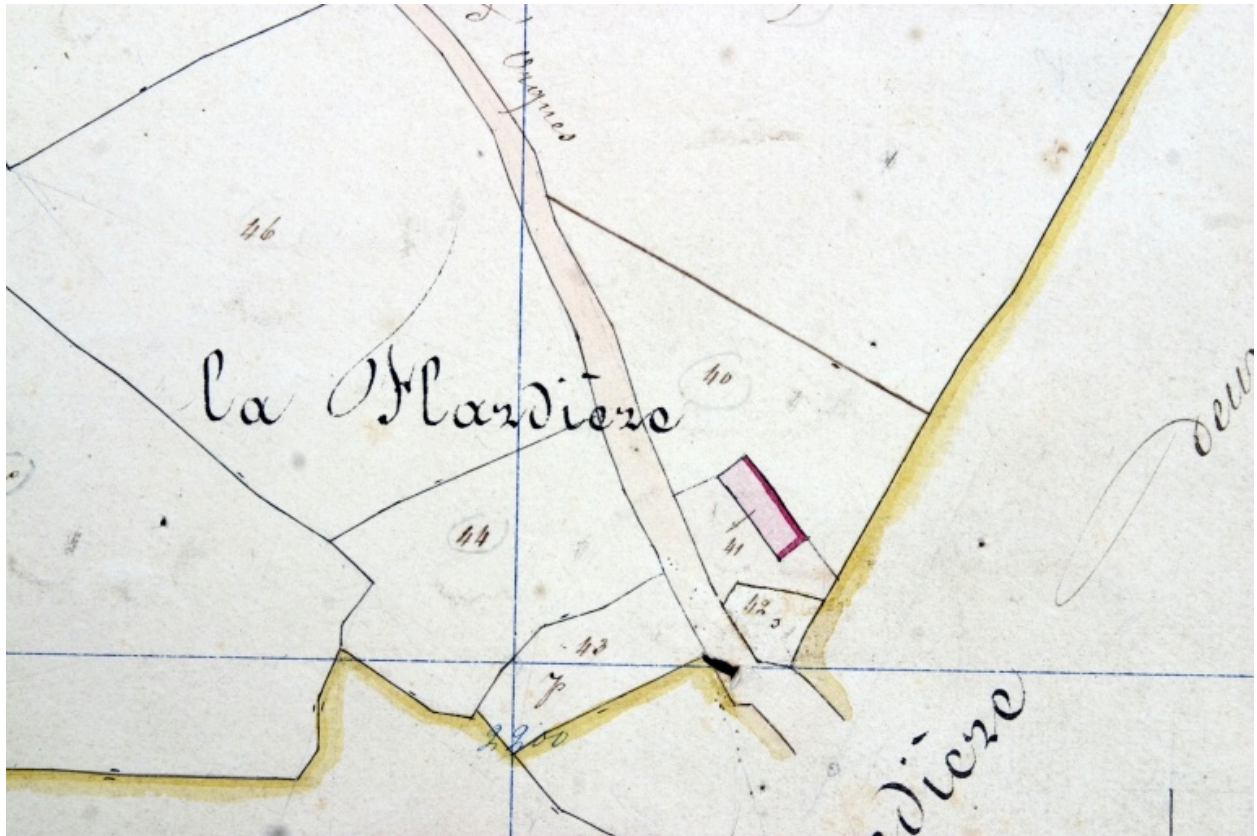
Extrait du plan cadastral de 1842, section A1.