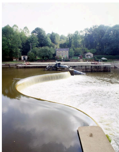
Le barrage, la centrale hydroélectrique, l'écluse, le transformateur, la maison éclusière et le fournil, vus depuis le premier étage du moulin .