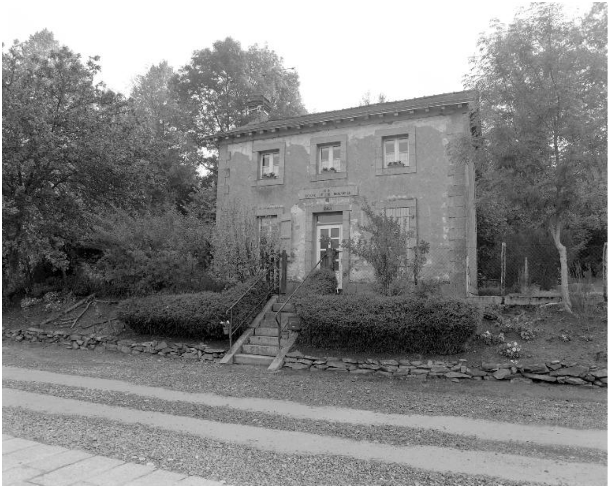
La maison éclusière.