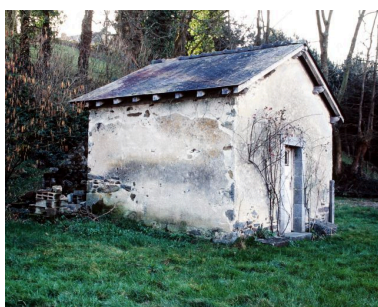
Le fournil vu du nord-ouest. IVR52_20025300364XA