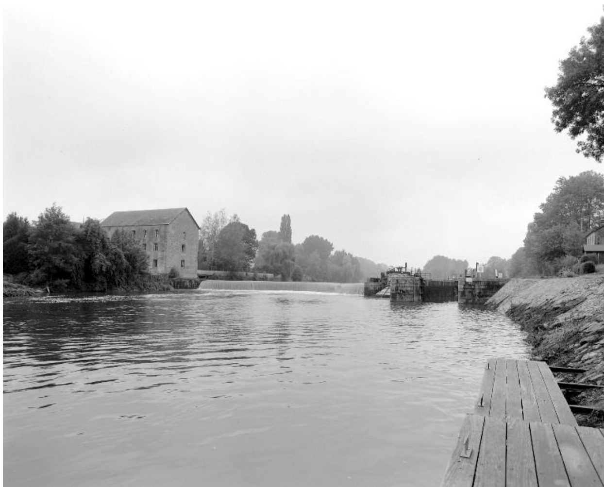
Vue d'ensemble du site d'écluse depuis le ponton situé en aval : moulin, barrage, centrale hydroélectrique, écluse, maison éclusière.