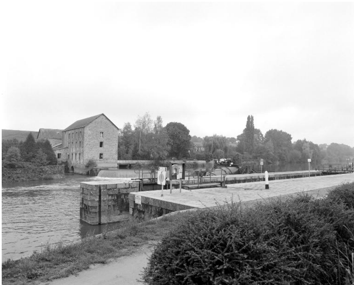
Vue d'ensemble du site depuis la rive gauche : moulin, barrage, centrale hydroélectrique, écluse.