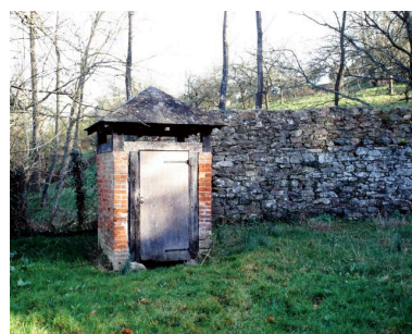
Les latrines.