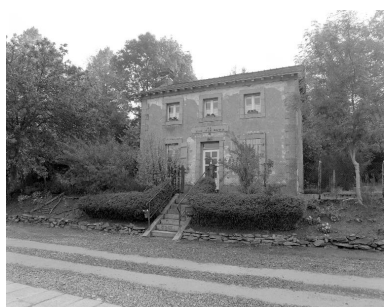
La maison éclusière.