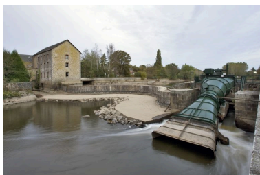
Vue d'ensemble depuis l'aval pendant les écoures de 2009 : moulin, barrage, centrale hydroélectrique.

IVR52_20095300440NUCA