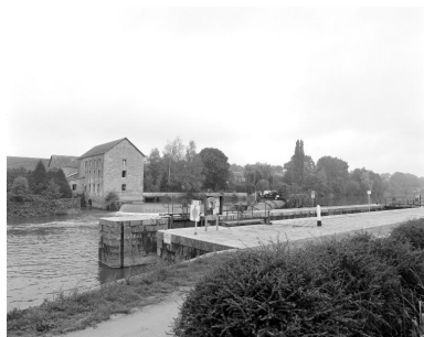
Vue d'ensemble du site depuis la rive gauche : moulin, barrage, centrale hydroélectrique, écluse.