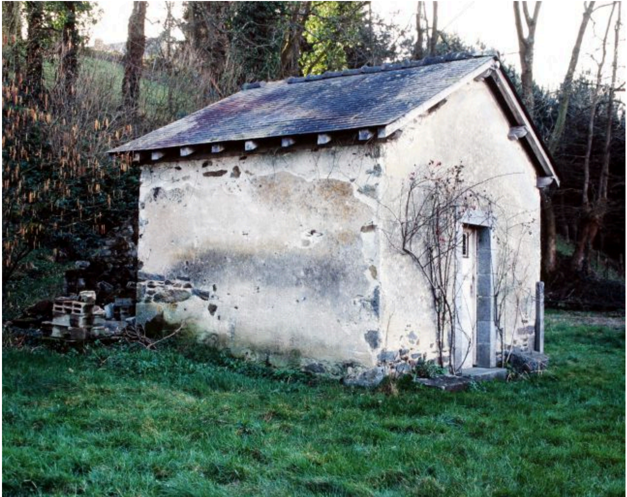
Le fournil vu du nord-ouest.