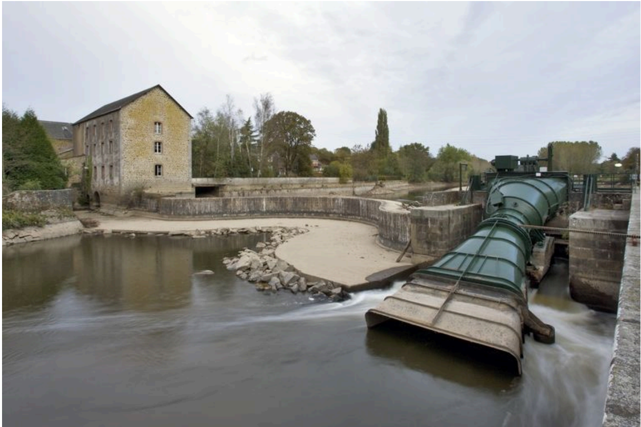
Vue d'ensemble depuis l'aval pendant les écourues de 2009 : moulin, barrage, centrale hydroélectrique.