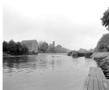
Vue d'ensemble du site d'écluse depuis le ponton situé en aval : moulin, barrage, centrale hydroélectrique, écluse, maison éclusière.