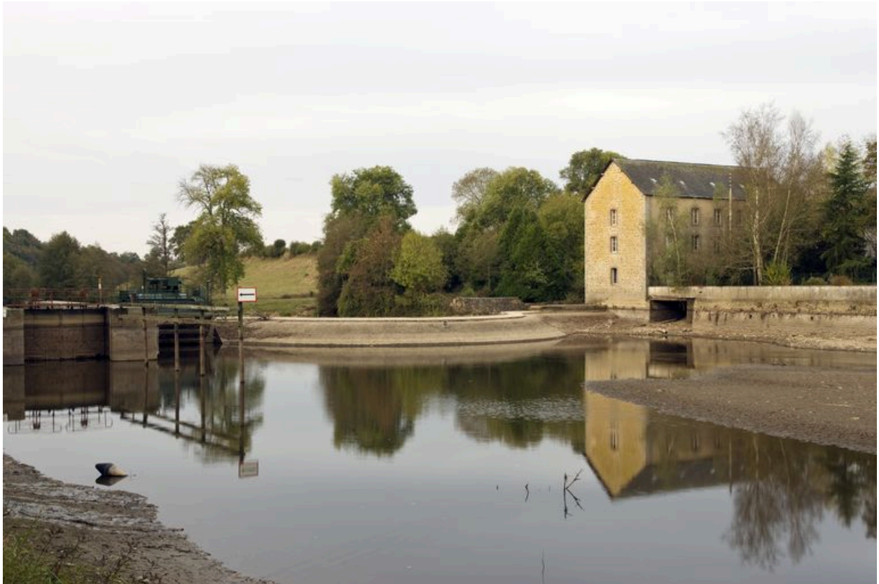
Vue d'ensemble depuis l'amont pendant les écourues de 2009 : écluse, pertuis, barrage, moulin.