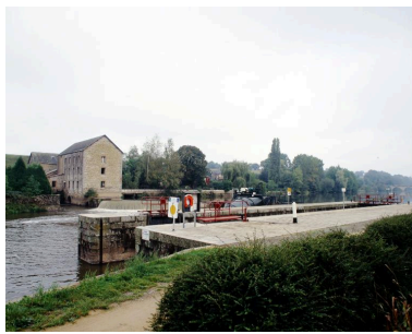
Vue d'ensemble du site depuis la rive gauche : moulin, barrage, centrale hydroélectrique, écluse.