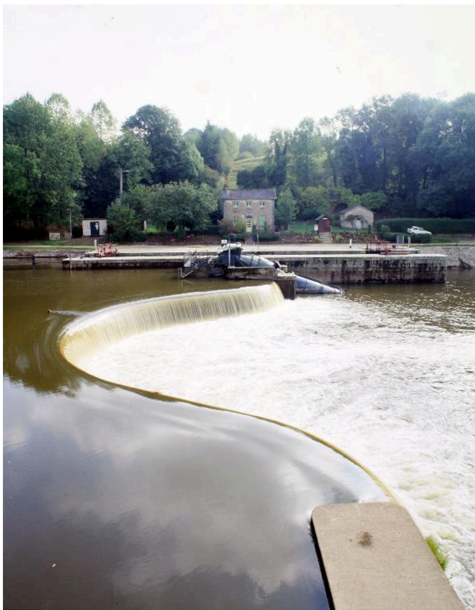
Le barrage, la centrale hydroélectrique, l'écluse, le transformateur, la maison éclusière et le fournil, vus depuis le premier étage du moulin .