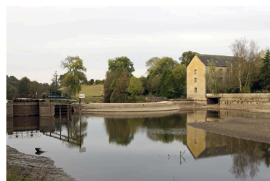
Vue d'ensemble depuis l'amont pendant les écoures de 2009 : écluse, pertuis, barrage, moulin.

Phot. Yves Guillotin IVR52_20095300440NUCA