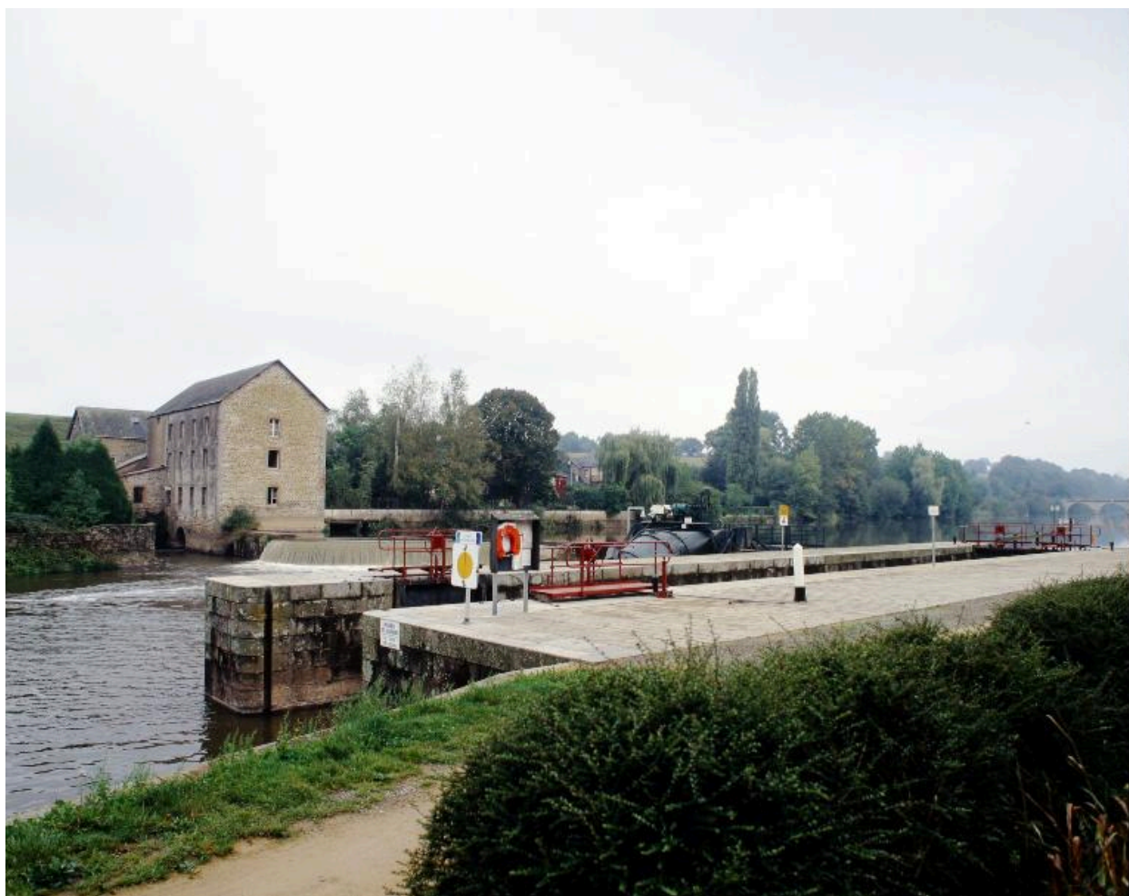
Vue d'ensemble du site depuis la rive gauche : moulin, barrage, centrale hydroélectrique, écluse.