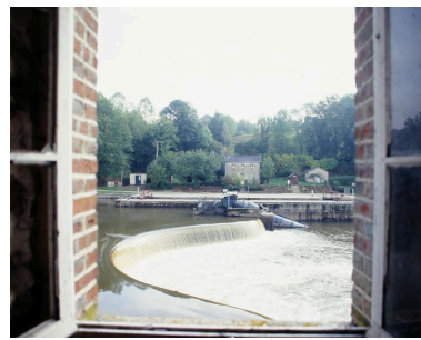
Le barrage, la centrale hydroélectrique, l'écluse, le transformateur, la maison éclusière et le fournil, vus depuis le premier étage du moulin.