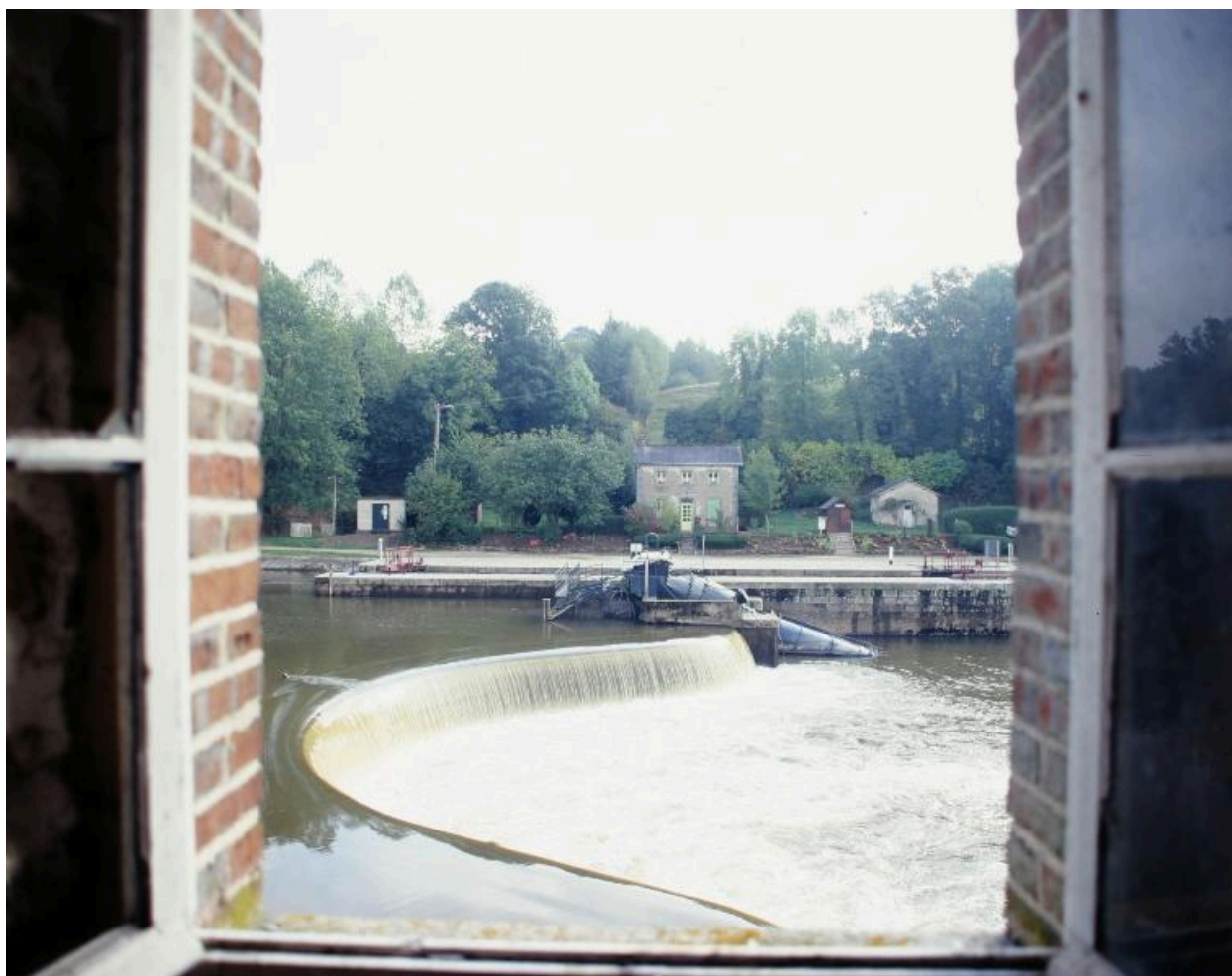
Le barrage, la centrale hydroélectrique, l'écluse, le transformateur, la maison éclusière et le fournil, vus depuis le premier étage du moulin.