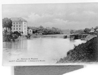
Vue d'ensemble du site d'écluse depuis l'aval : moulin, barrage, pertuis, écluse.