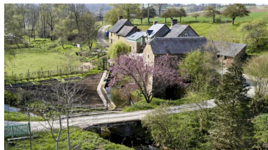
Vue aérienne du moulin et de la ferme du moulin de la Monnerie.