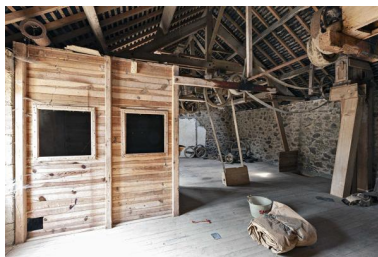
Magasin à farine, étage de comble. IVR52_20205300267NUCA