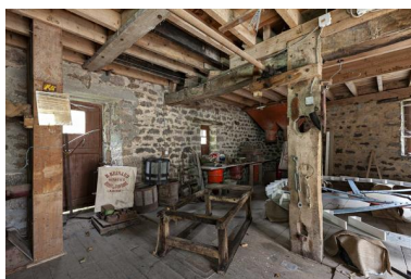
Rez-de-chaussée. IVR52_20205300266NUCA