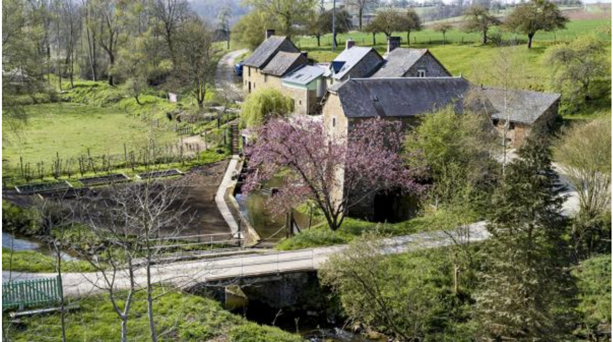
Vue aérienne du moulin et de la ferme du moulin de la Monnerie.