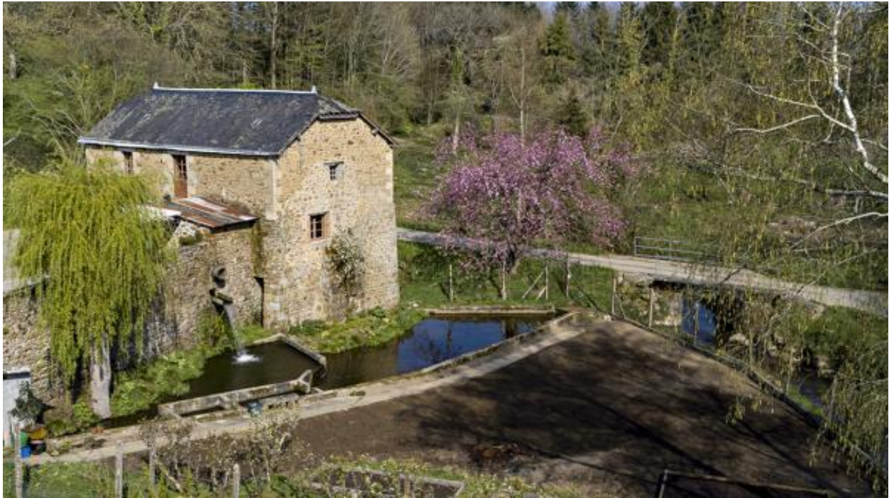
Vue aérienne du moulin de la Monnerie.