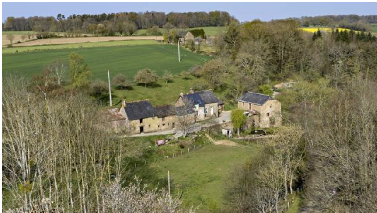
Vue aérienne du moulin et de la ferme du moulin de la Monnerie.