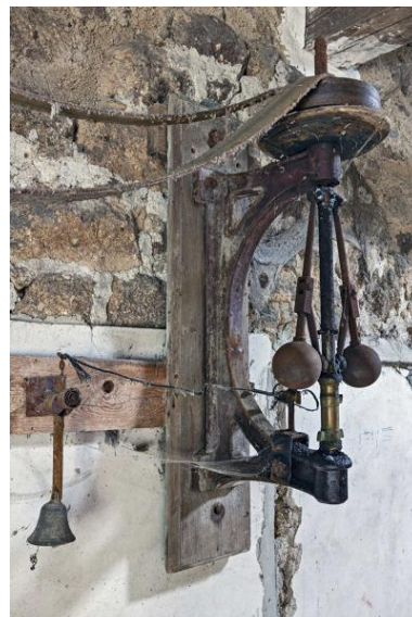
Mécanisme anti incendie. IVR52_20205300268NUCA