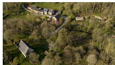
Vue aérienne du moulin et de la ferme du moulin de la Monnerie.