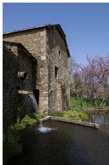
Mur-pignon oriental et chute d'eau.