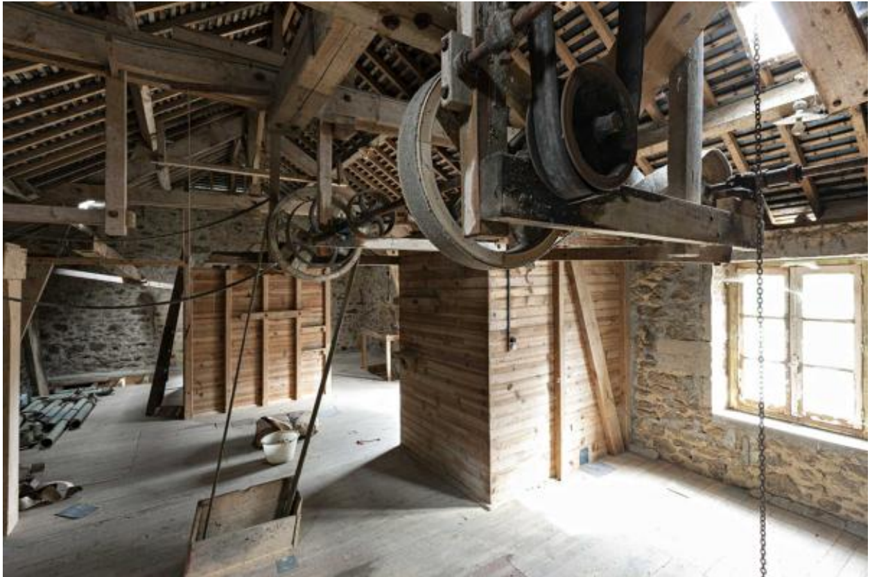
Etage de comble.