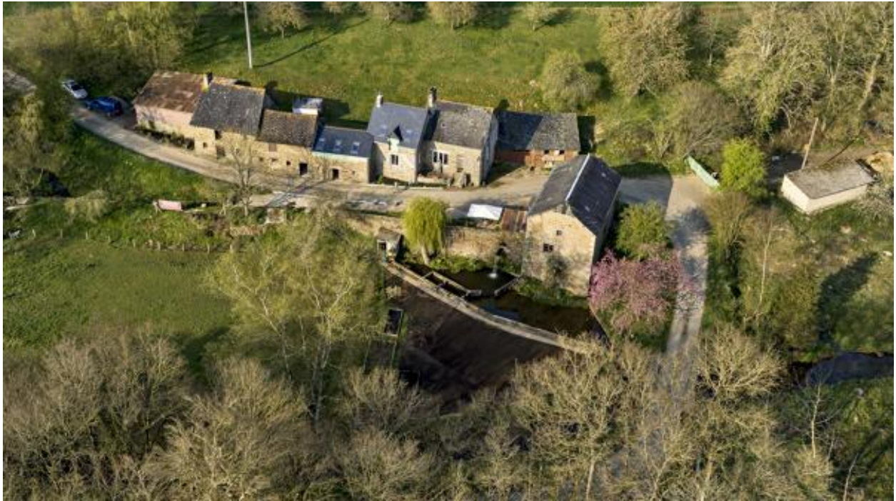
Vue aérienne du moulin et de la ferme du moulin de la Monnerie.