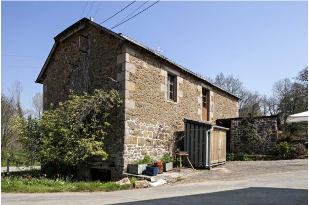
Le moulin vu depuis le sud-ouest.