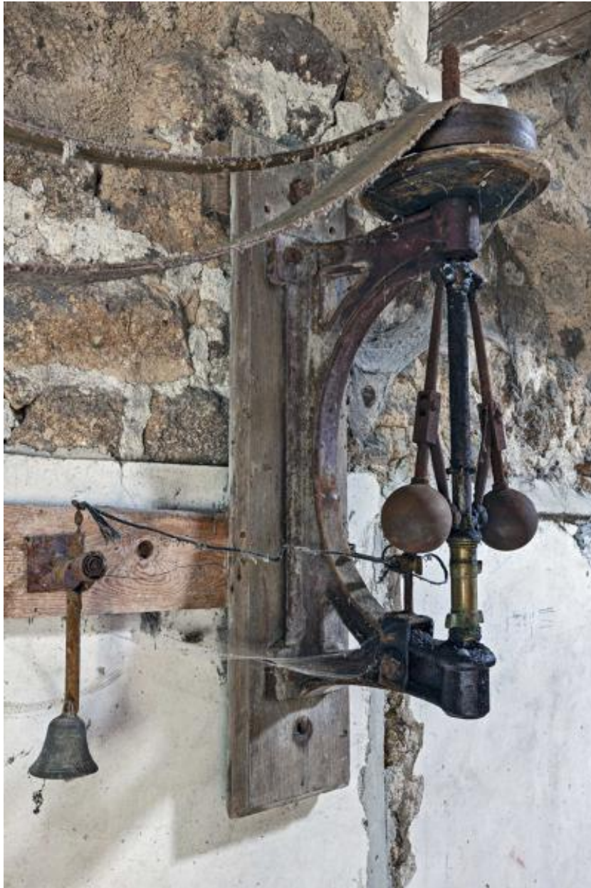
Mécanisme anti incendie.