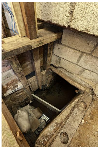
Mécanisme de contrôle des vannes. IVR52_20215300246NUCA