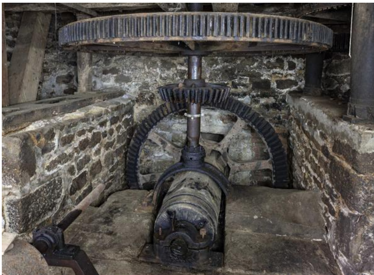
Soubassement, roues et arbres de transmission.