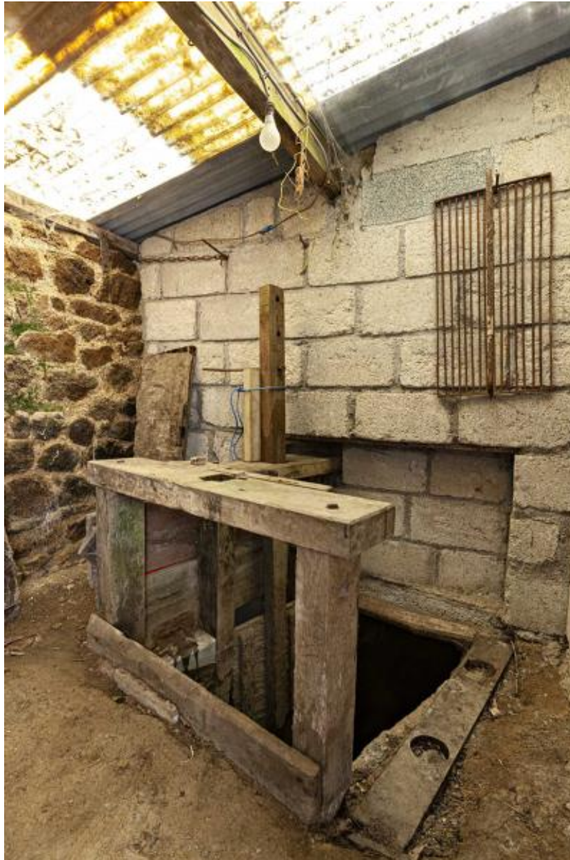
Mécanisme de contrôle des vannes.