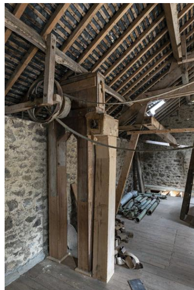
Comble, godets éleveurs. IVR52_20205300271NUCA