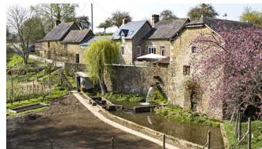
Vue aérienne du moulin et de la ferme du moulin de la Monnerie.