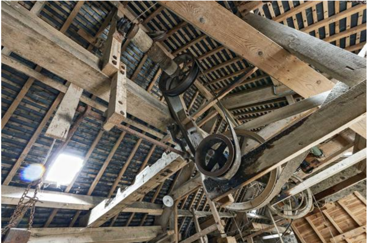
Courroies et axe de transmission, niveau de comble.