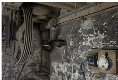
Installation électrique, soubassement. IVR52_20205300273NUCA