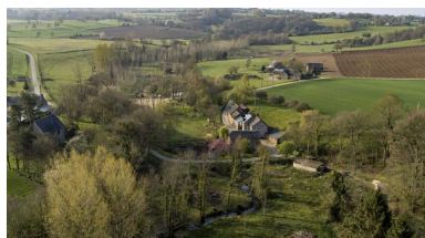
Le Lassay serpentant entre le moulin et le manoir de la Monnerie ; derrière, la Rivière.