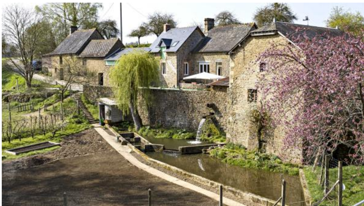
Vue aérienne du moulin et de la ferme du moulin de la Monnerie.