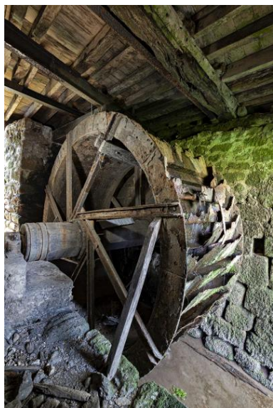
Roue dotée de pales métalliques.