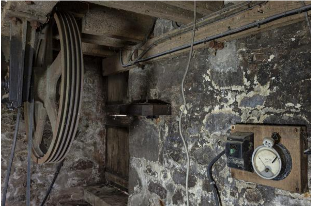
Installation électrique, soubassement.