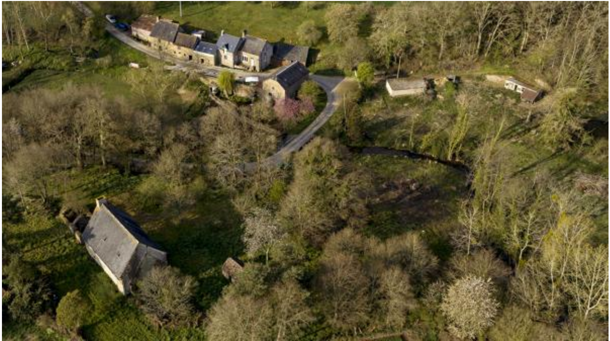
Vue aérienne du moulin et de la ferme du moulin de la Monnerie.