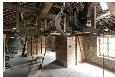
Etage de comble.