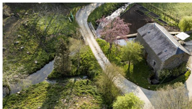
Vue aérienne du moulin de la Monnerie.