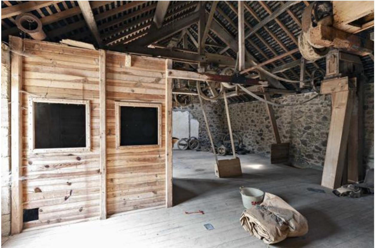
Magasin à farine, étage de comble.