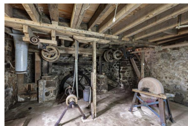
Soubassement, roues et arbres de transmission.