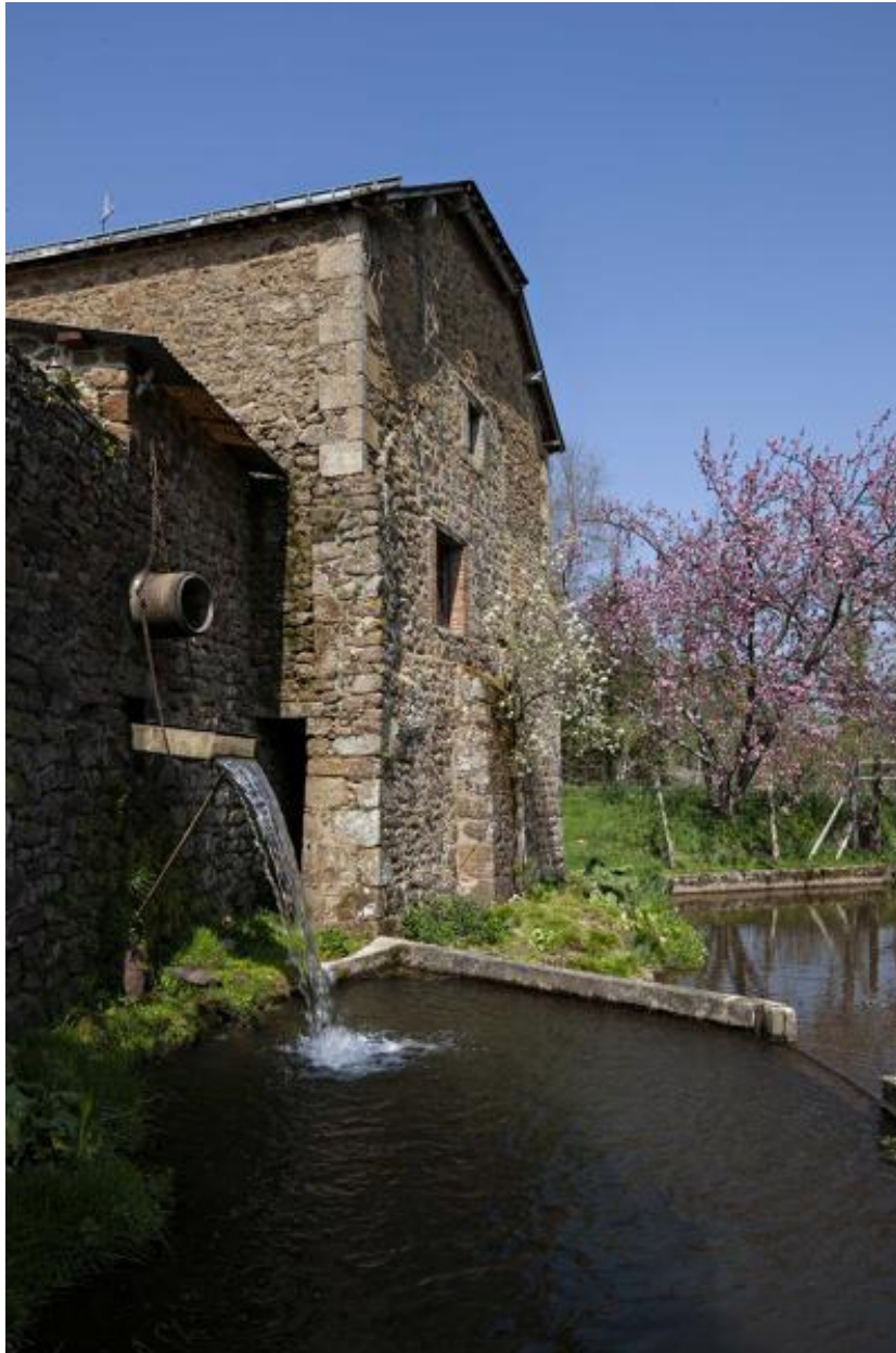
Mur-pignon oriental et chute d'eau.