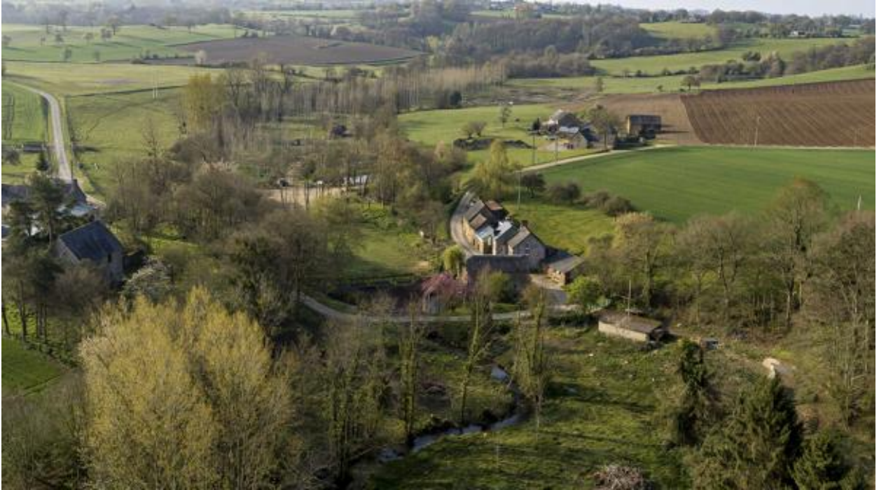
Le Lassay serpentant entre le moulin et le manoir de la Monnerie ; derrière, la Rivière.