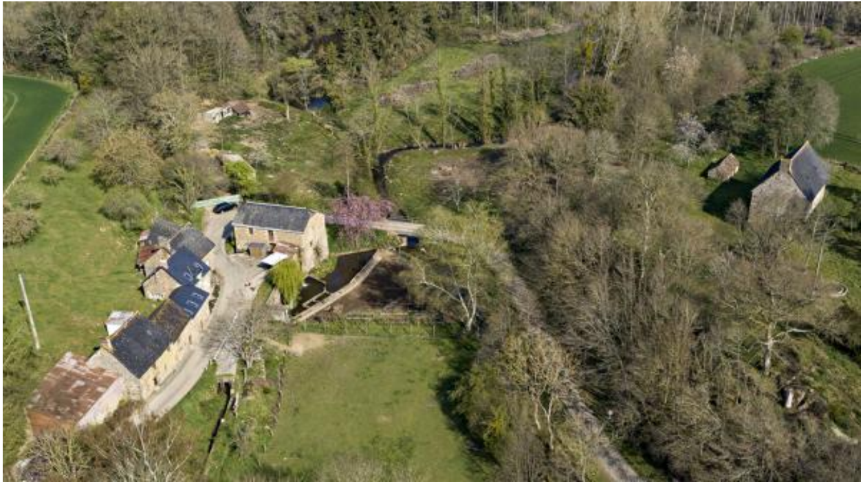
Vue aérienne du moulin et de la ferme du moulin de la Monnerie.