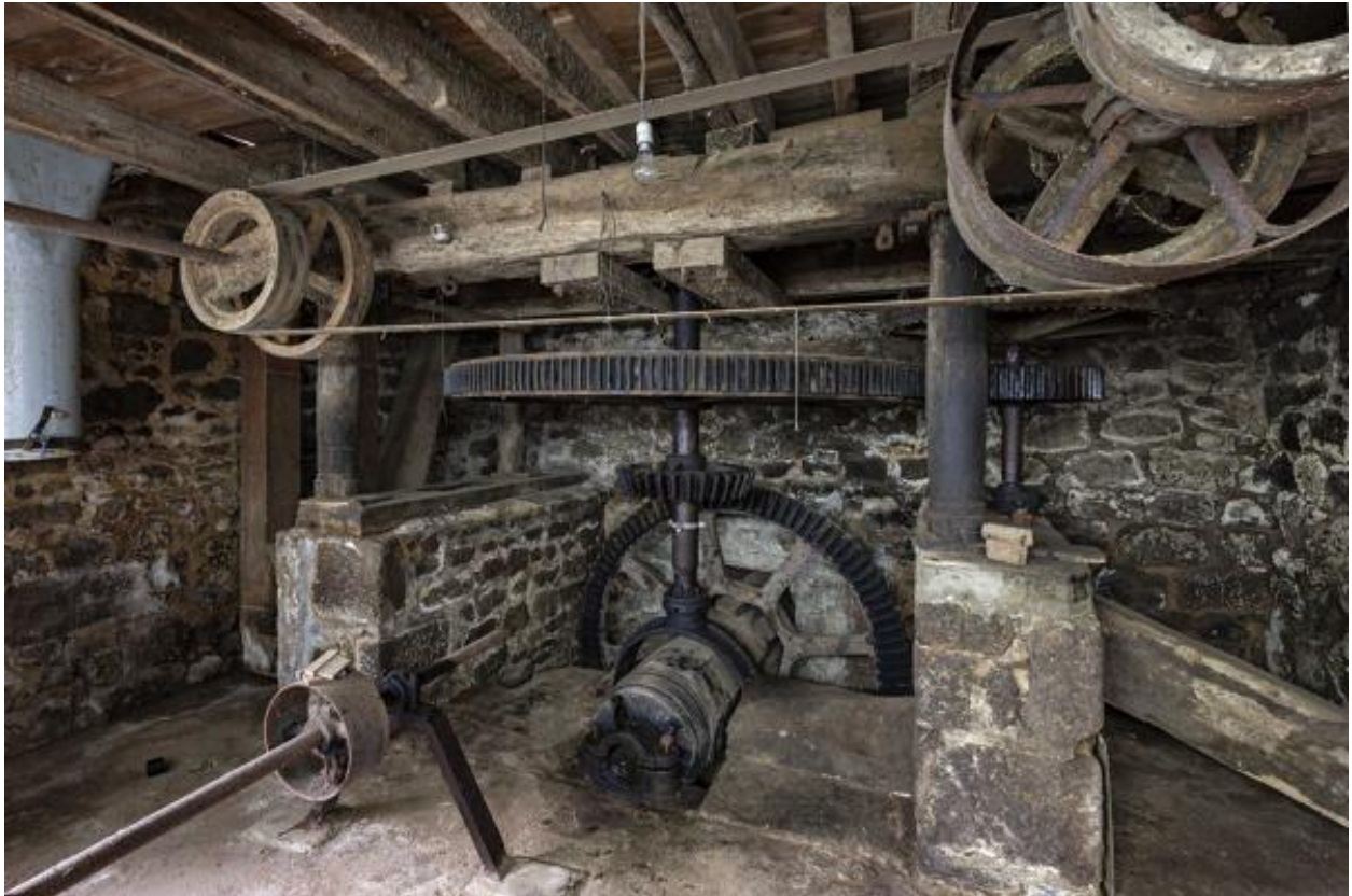
Soubassement, roues et arbres de transmission.