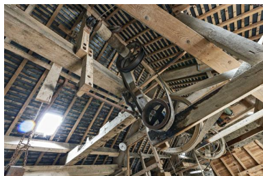
Courroies et axe de transmission, niveau de comble.