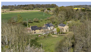
Vue aérienne du moulin et de la ferme du moulin de la Monnerie. IVR52_20215300231NUCA