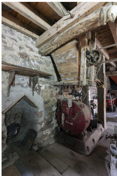
Ensacheur (rez-de-chaussée).