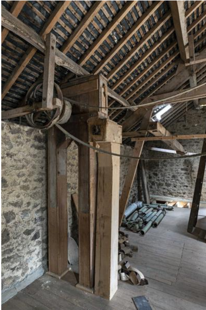
Comble, godets éleveurs.