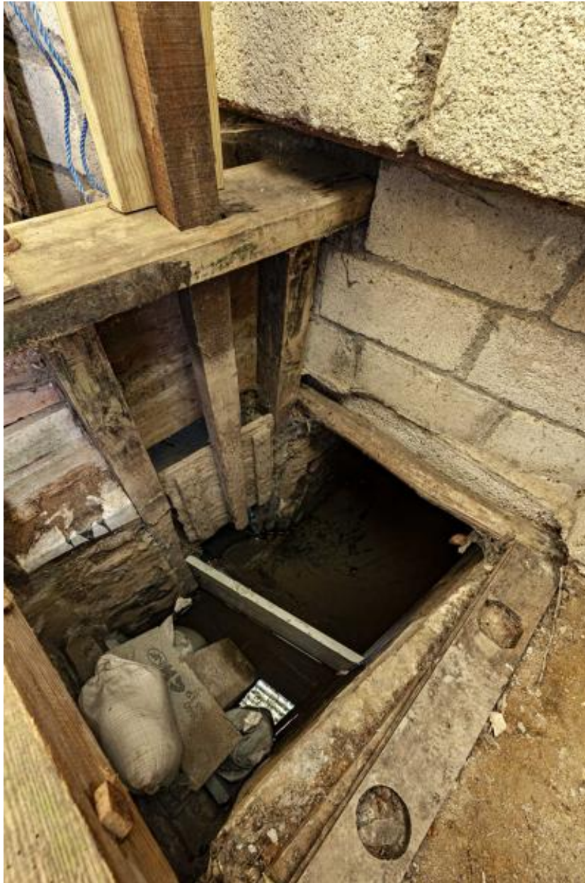
Mécanisme de contrôle des vannes.