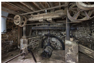
Soubassement, roues et arbres de transmission.