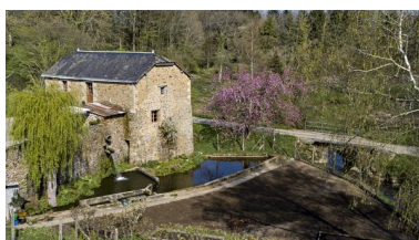
Vue aérienne du moulin de la Monnerie.