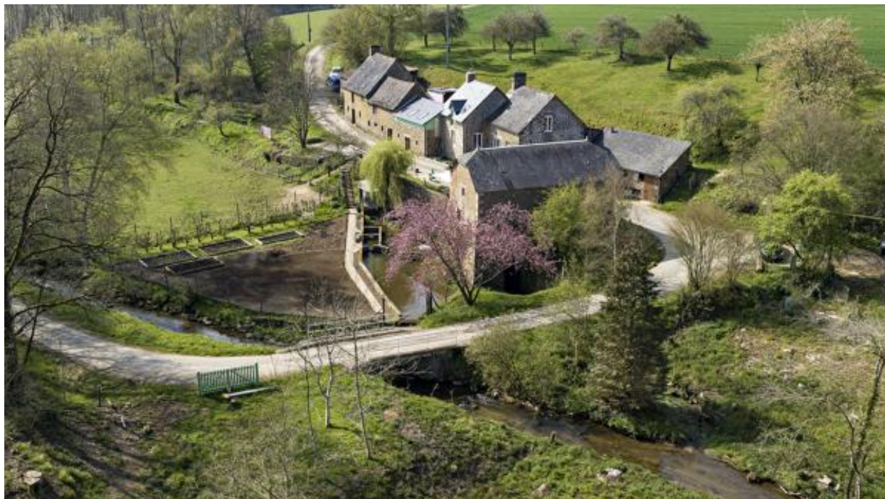
Vue aérienne du moulin et de la ferme du moulin de la Monnerie.