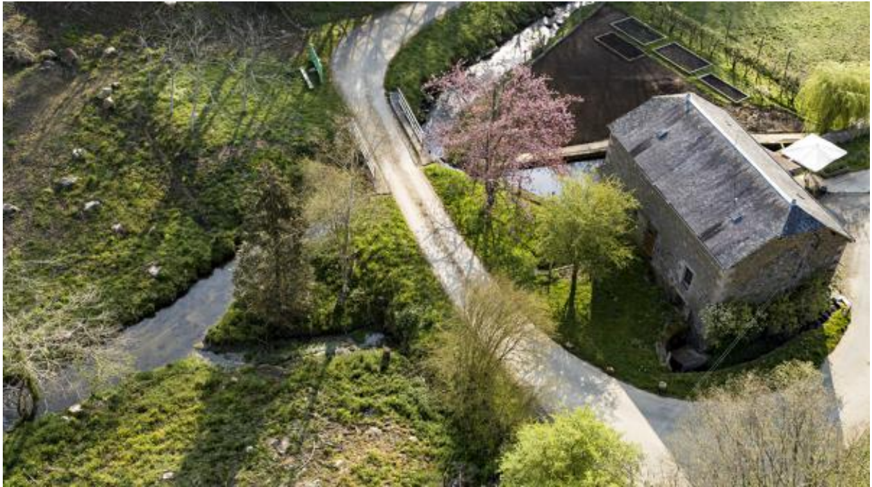
Vue aérienne du moulin de la Monnerie.