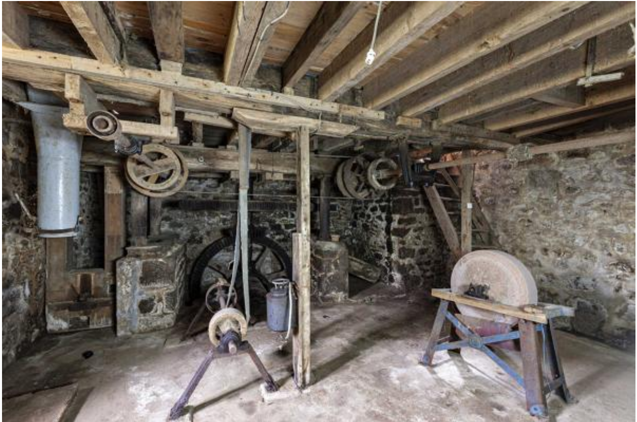
Soubassement, roues et arbres de transmission.