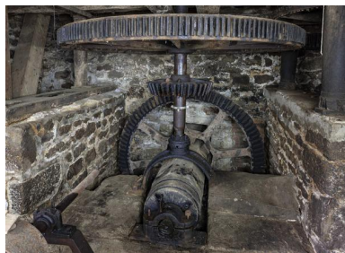
Soubassement, roues et arbres de transmission.