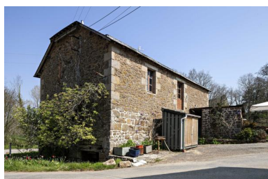
Le moulin vu depuis le sud-ouest.