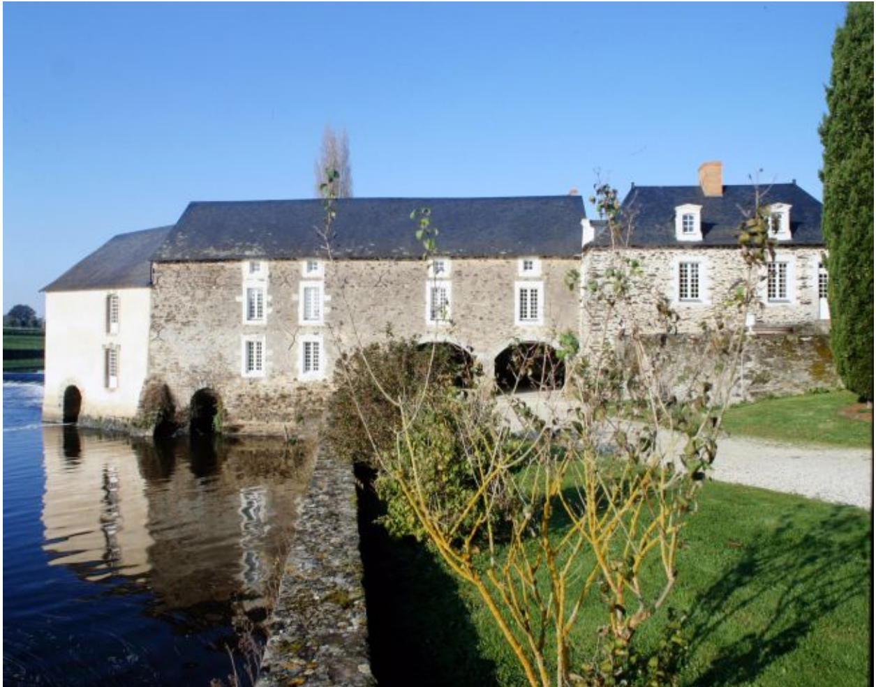
Façade sud du moulin et du logement de meunier.