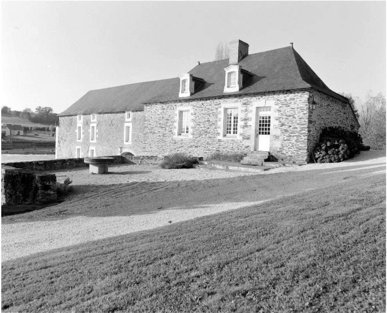
Vue du sud-est : moulin, logement du meunier.