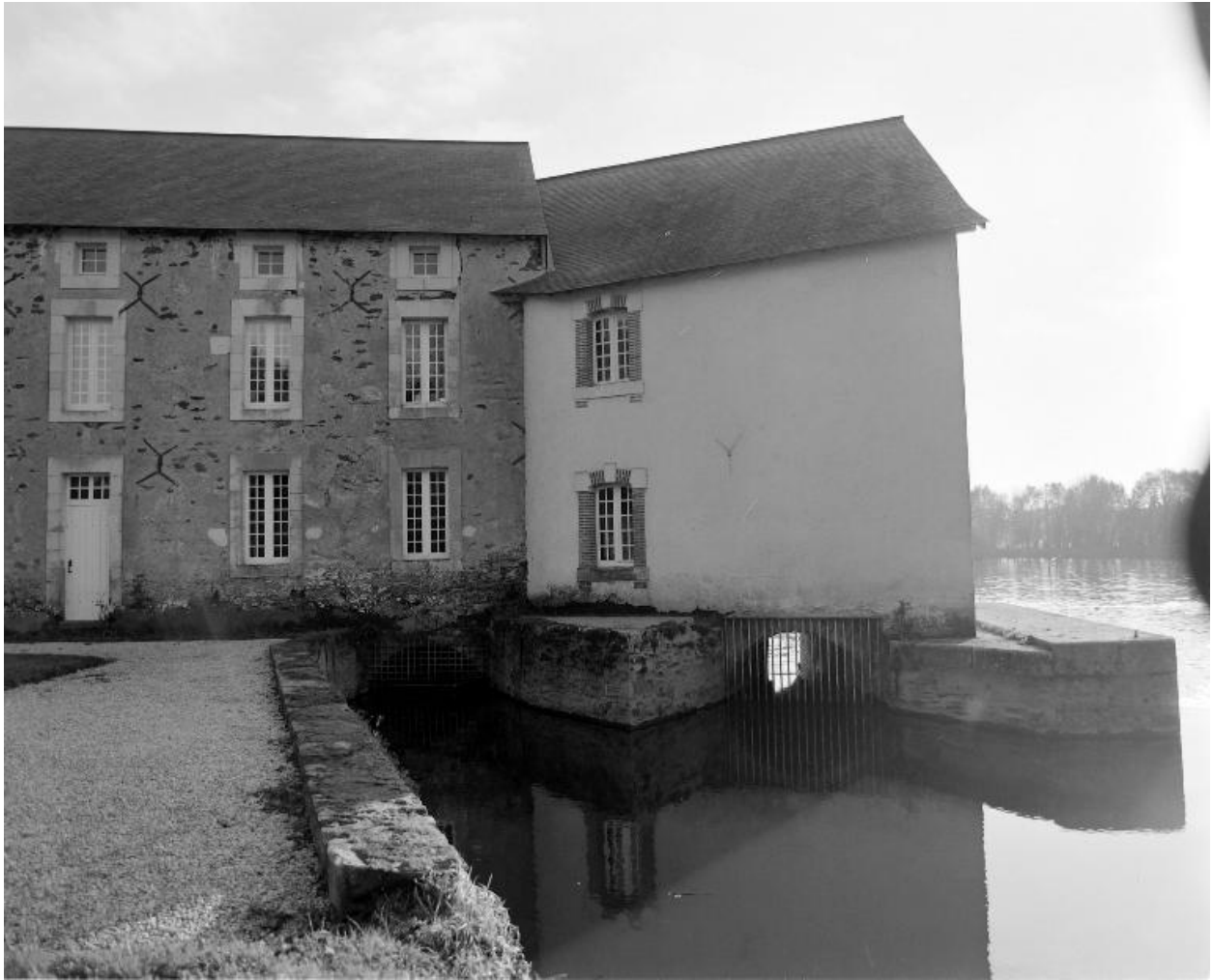
Façade nord du logement du meunier et du moulin. Les deux coursiers vus de l'amont.