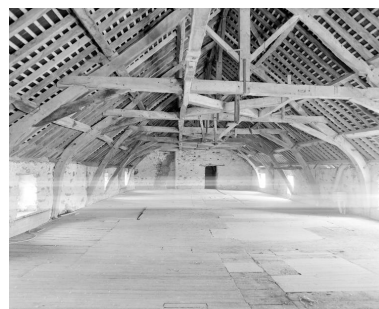
Le comble du moulin vu de l'ouest.