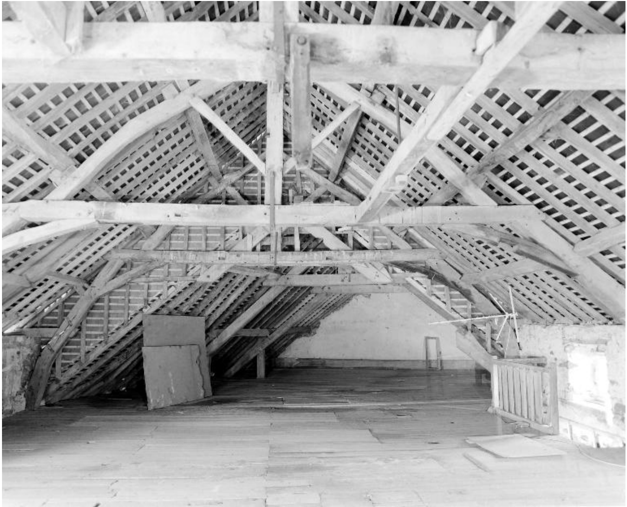
Le comble du moulin vu de l'est. Au premier plan, la charpente de la partie édifée en 1850 ; au second plan celle de la partie reconstruite en 1879.