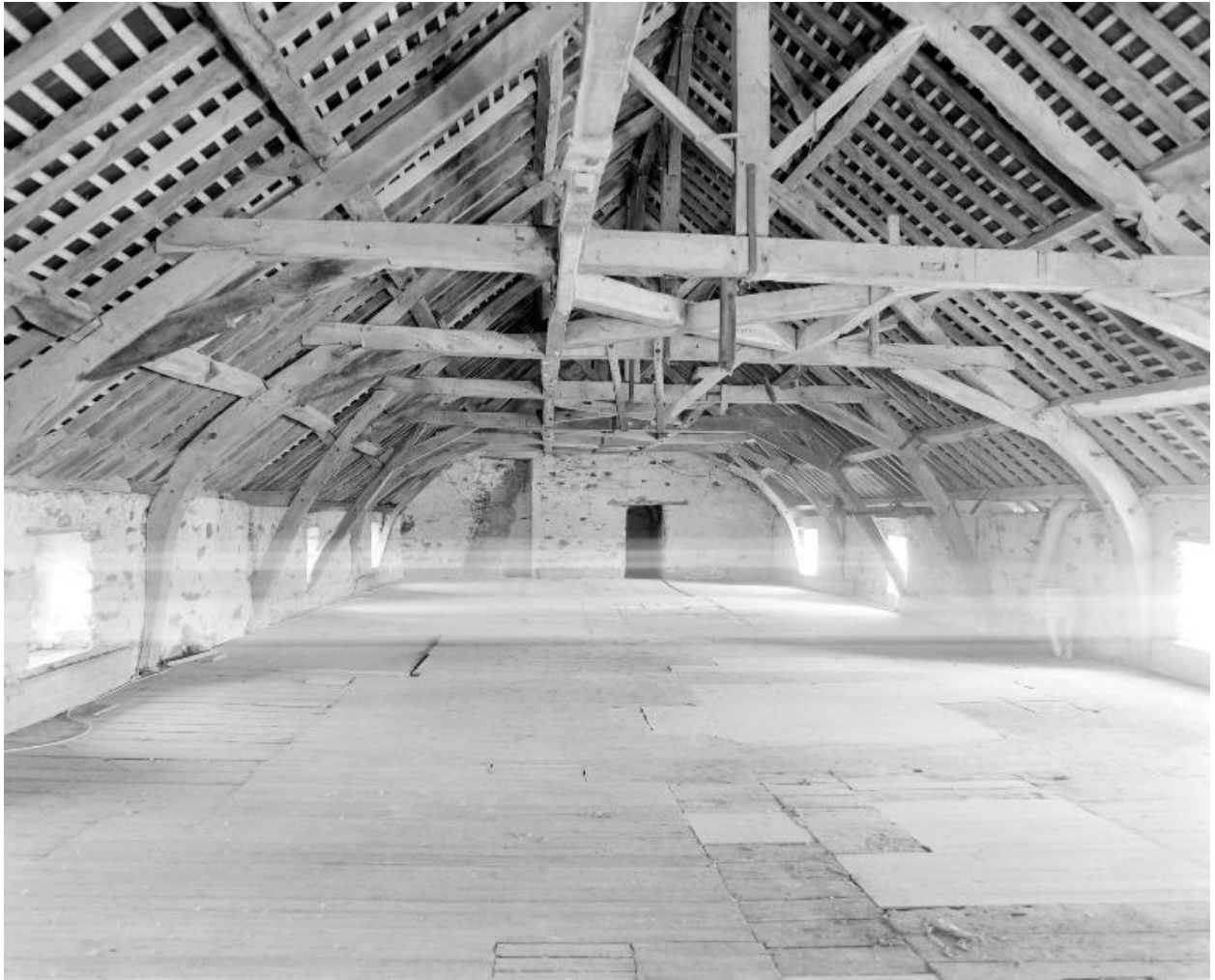
Le comble du moulin vu de l'ouest.