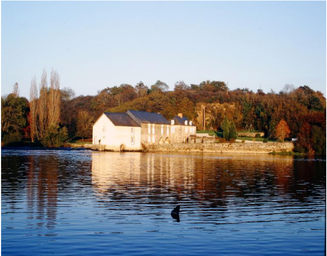
Vue d'ensemble depuis la rive droite en aval.