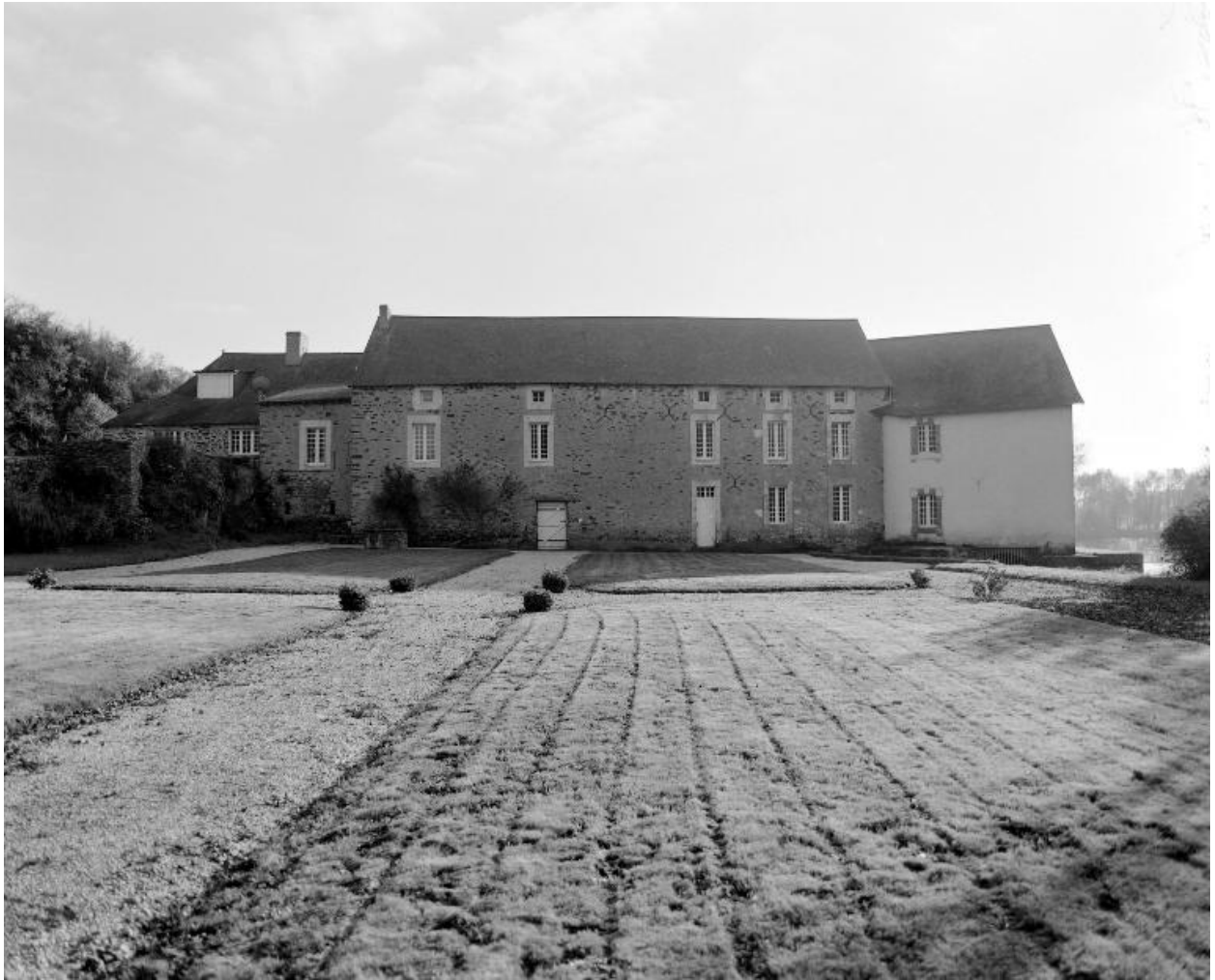
façade nord du logement du meunier et du moulin.