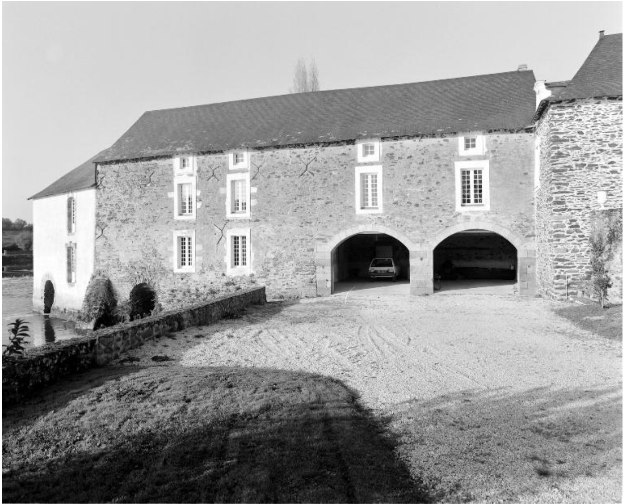
Façade sud du moulin.