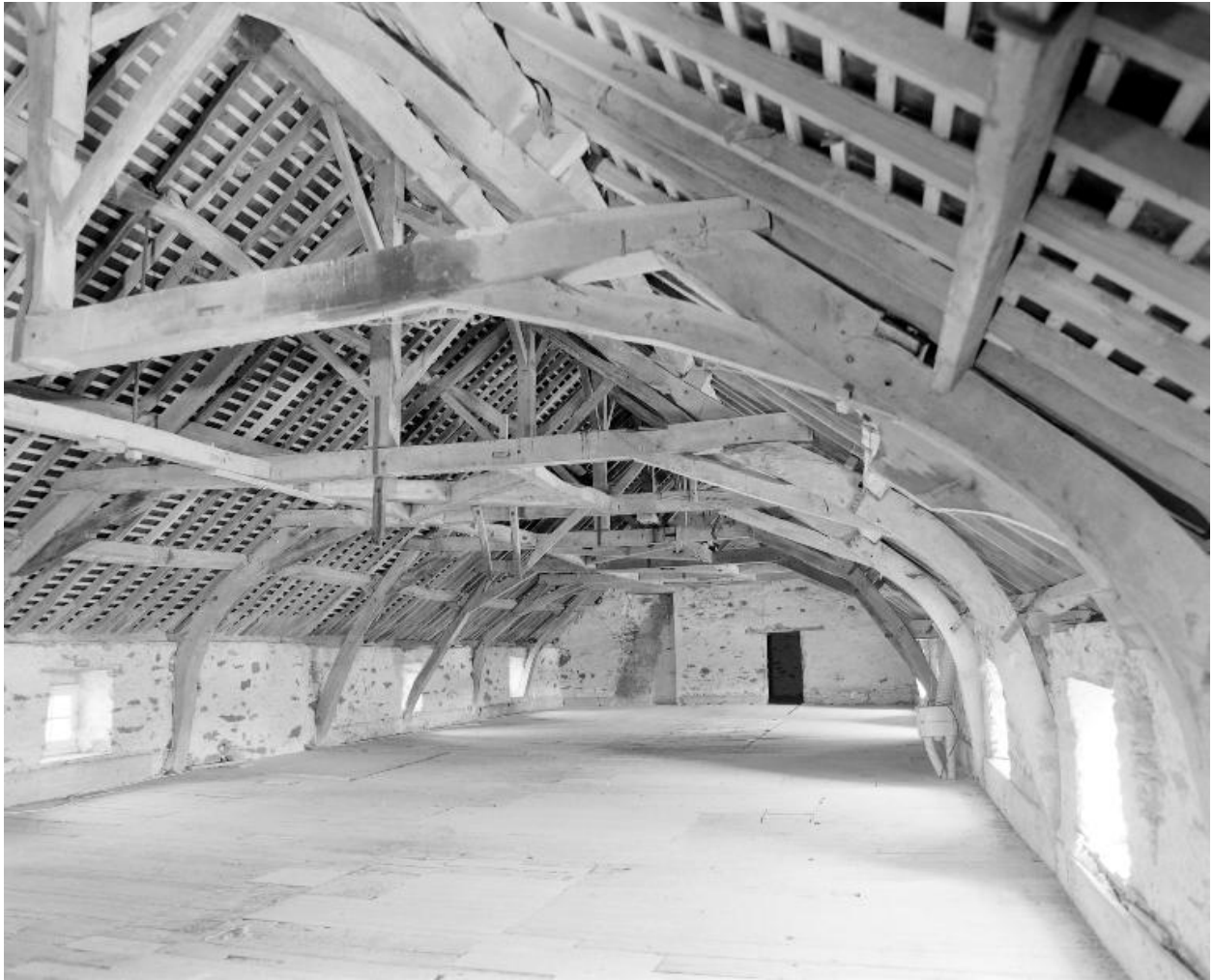
Le comble du moulin vu de l'ouest.