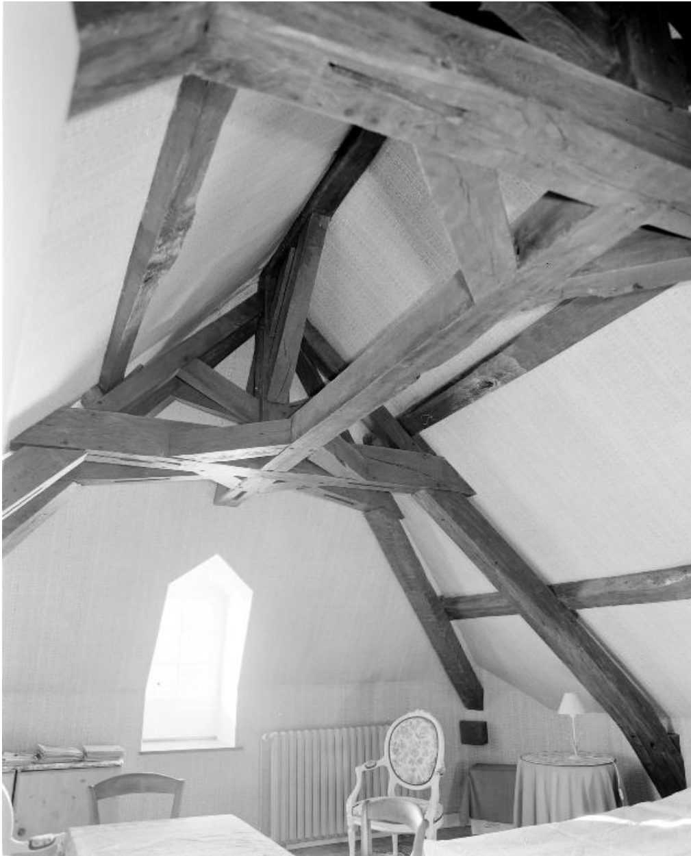
Charpente du logement du meunier. Pièce ouest de l'étage de comble.