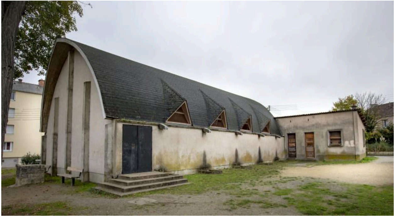
Vue de la chapelle de la Sainte-Famille.