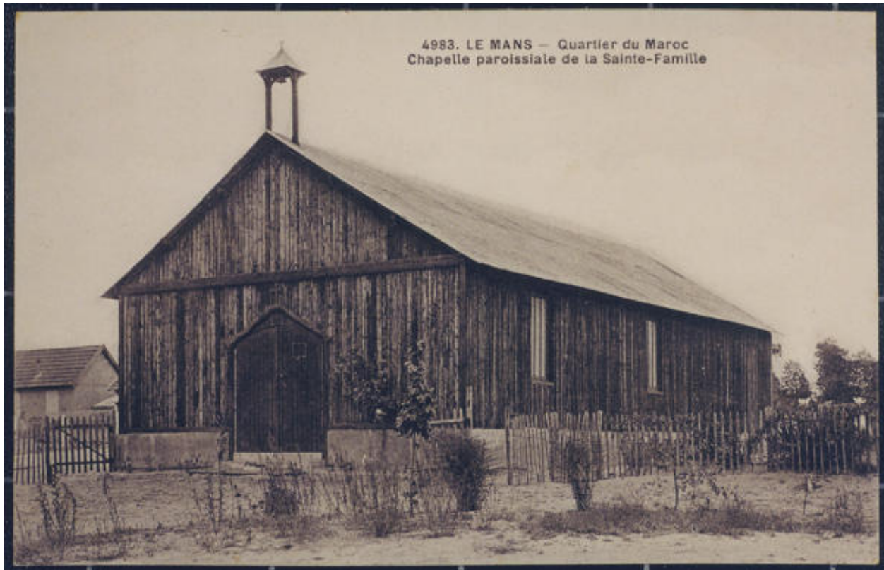
Vue de la chapelle avant les bombardements de 1944, carte postale ancienne.