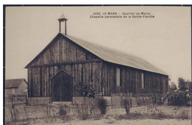
Vue de la chapelle avant les bombardements de 1944, carte postale ancienne.