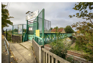
Vue de l'entrée du centre de loisirs.