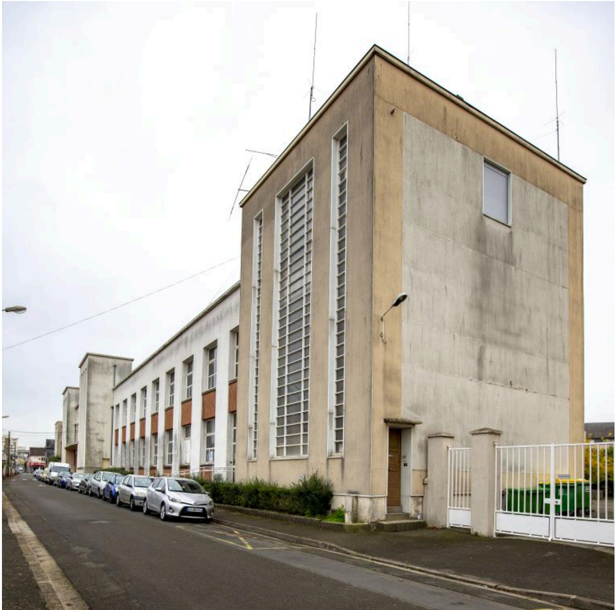
Vue de l'école Jules-Ferry.