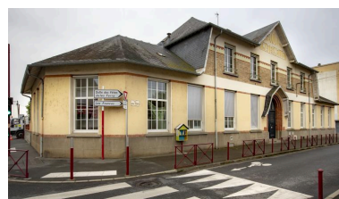
Vue de l'école maternelle. IVR52_20197202545NUCA