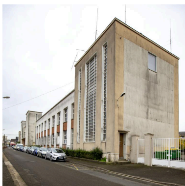
Vue de l'école Jules-Ferry.