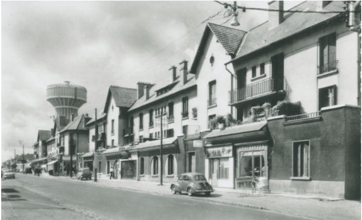
Vue de l'avenue Felix Geneslay avec le château d'eau en fond.