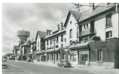
Vue de l'avenue Felix Geneslay avec le château d'eau en fond. IVR52_20207200085NUCA