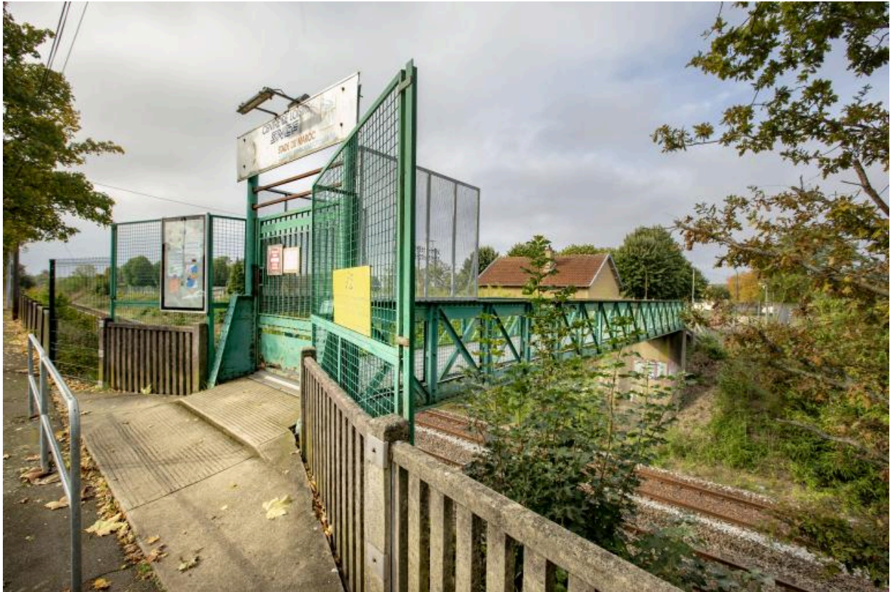
Vue de l'entrée du centre de loisirs.