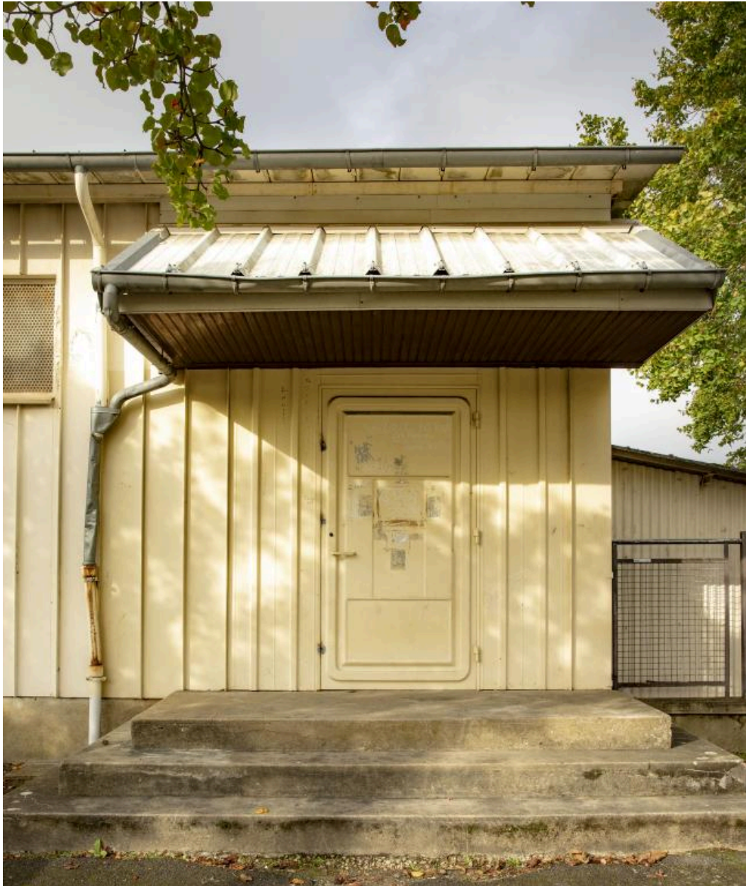
Vue de l'entrée de l'économat.