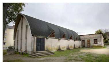
Vue de la chapelle