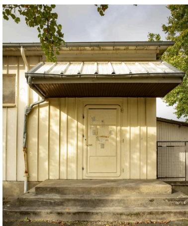
Vue de l'entrée de l'économat. IVR52_20197202586NUCA