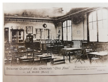
Vue de l'intérieur du restaurant coopératif cheminote, carte postale ancienne. IVR52_20207200079NUCA