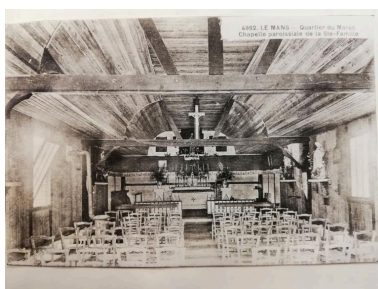
Vue de l'intérieur de la chapelle avant les bombardements de 1944, carte postale ancienne.