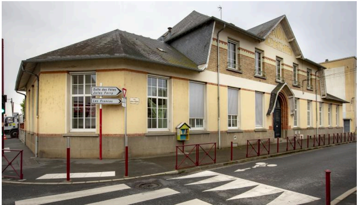
Vue de l'école maternelle.