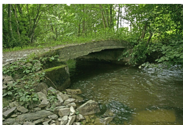
Le pont situé près de l'écart des Petits-Champs à Pré-en-Pail : vue d'amont depuis la rive gauche. IVR52_20075300415NUCA