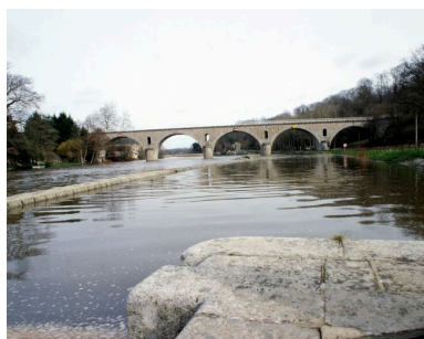
Le pont de Rochefort, reliant les communes d'Andouillé et de Montfleurs.