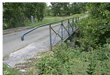
Le pont situé près du Val, à la limite de Pré-en-Pail et de Saint-Samson : vue depuis le bord de la route au sud. IVR52_20075300424NUCA