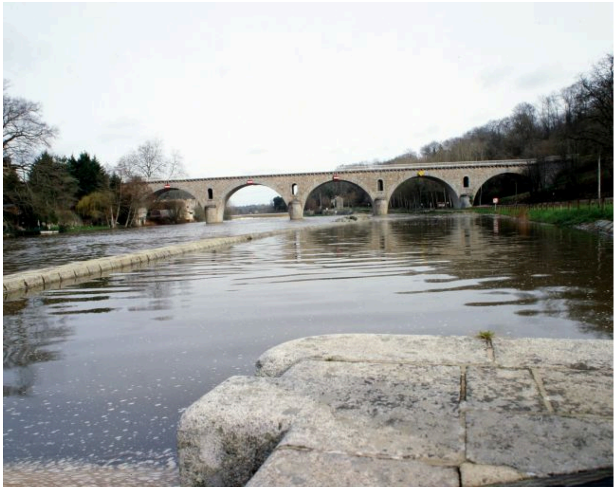
Le pont de Rochefort, reliant les communes d'Andouillé et de Montflours.