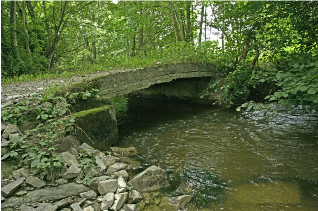
Le pont situé près de l'écart des Petits-Champs à Pré-en-Pail : vue d'amont depuis la rive gauche.