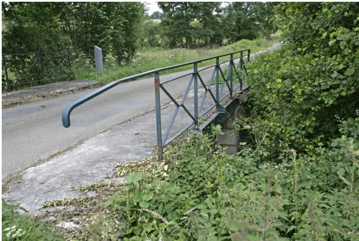
Le pont situé près du Val, à la limite de Pré-en-Pail et de Saint-Samson : vue depuis le bord de la route au sud.