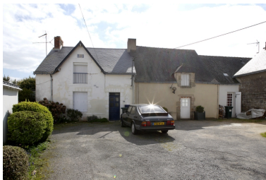
Vue d'ensemble. IVR52_20084400487NUCA