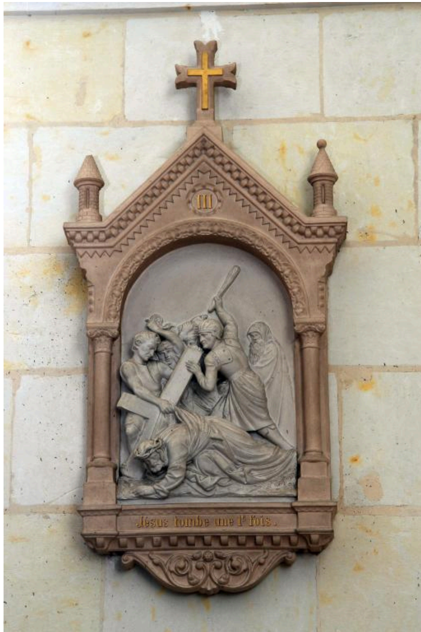
Chemin de croix.