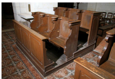
Stalles du XIXe siècle.