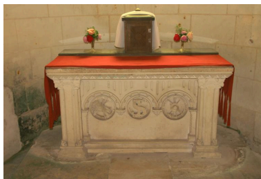
Autel de Saint-Joseph, fin du XIXe siècle. IVR52_20087200788NUCA