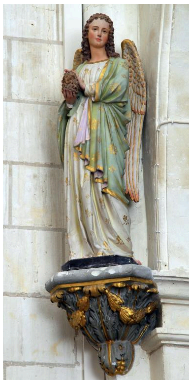
Ange en plâtre du XIXe siècle.