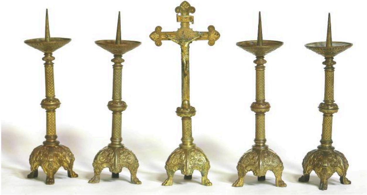
Garniture d'autel en bronze doré de la fin du XIXe siècle.