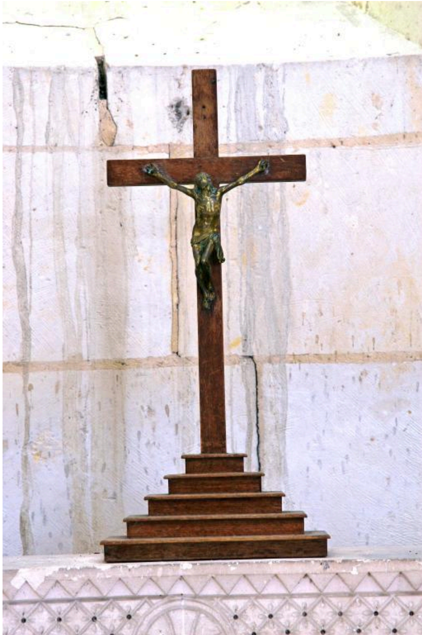
Croix d'autel en bois et métal du XIXe siècle.