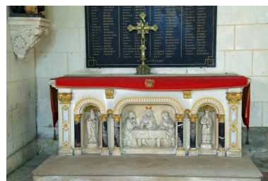
Autel du bras sud du transept, fin du XIXe siècle. IVR52_20087200787NUCA