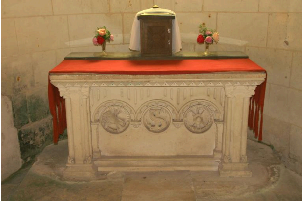
Autel de Saint-Joseph, fin du XIXe siècle.