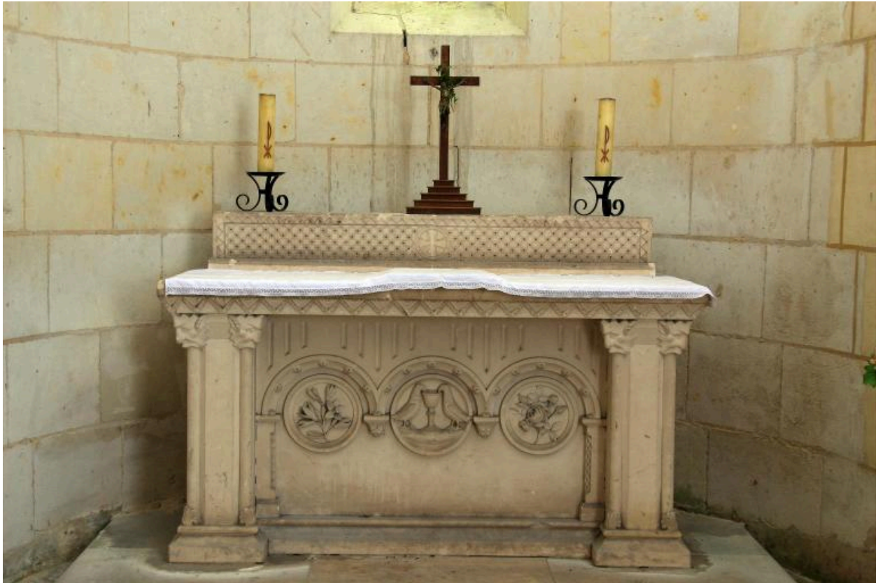
Autel de la Vierge, fin du XIXe siècle.