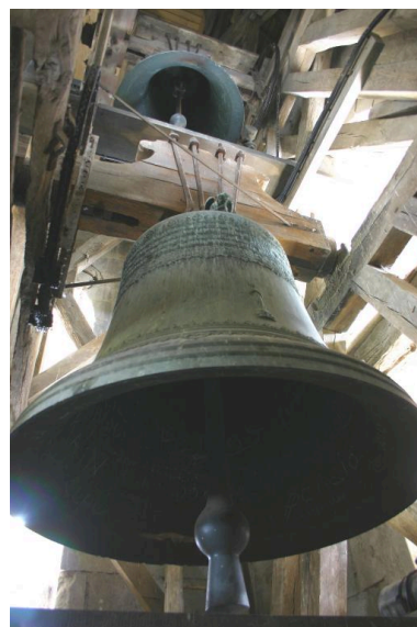
Cloches.