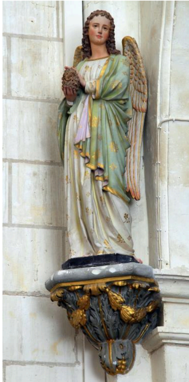
Ange en plâtre du XIXe siècle.