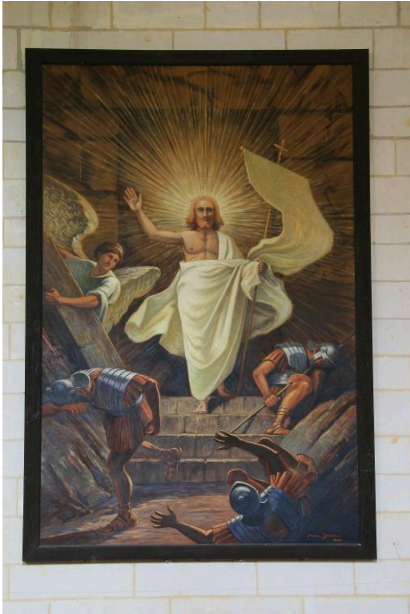
Résurrection du Christ par Derulle en 1946.