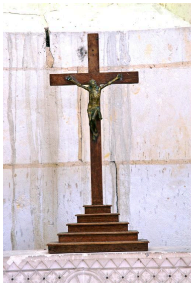
Croix d'autel en bois et métal du XIXe siècle. IVR52_20087200772NUCA