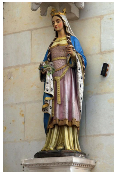
Sainte Elisabeth d'Hongrie.