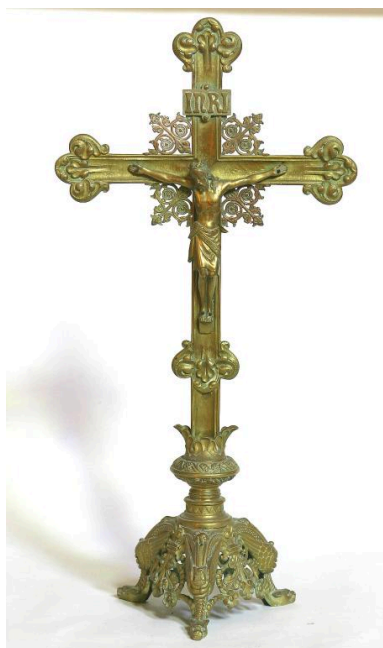
Croix d'autel en bronze doré de la fin du XIXe siècle.