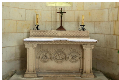
Autel de la Vierge, fin du XIXe siècle. IVR52_20087200771NUCA