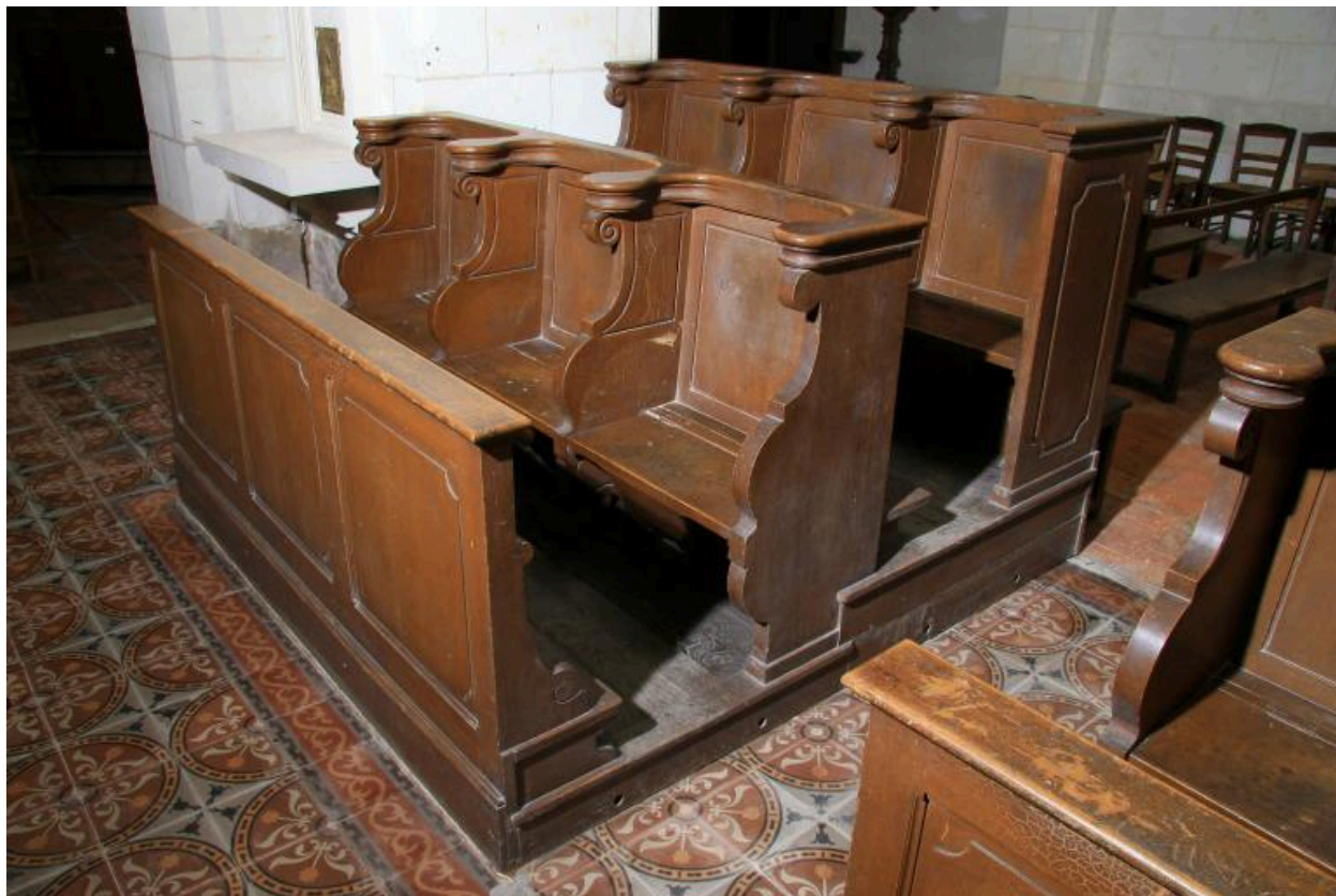
Stalles du XIXe siècle.