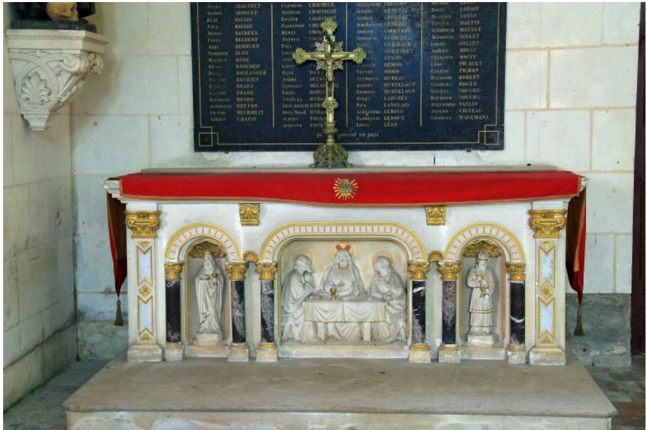
Autel du bras sud du transept, fin du XIXe siècle.