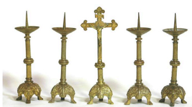
Garniture d'autel en bronze doré de la fin du XIXe siècle. IVR52_20047204239NUCA