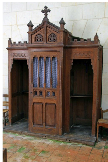
Confessionnal de la fin du XIXe siècle.