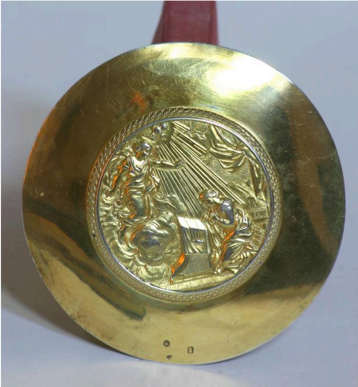
Patène en argent doré par les frères Naudin.