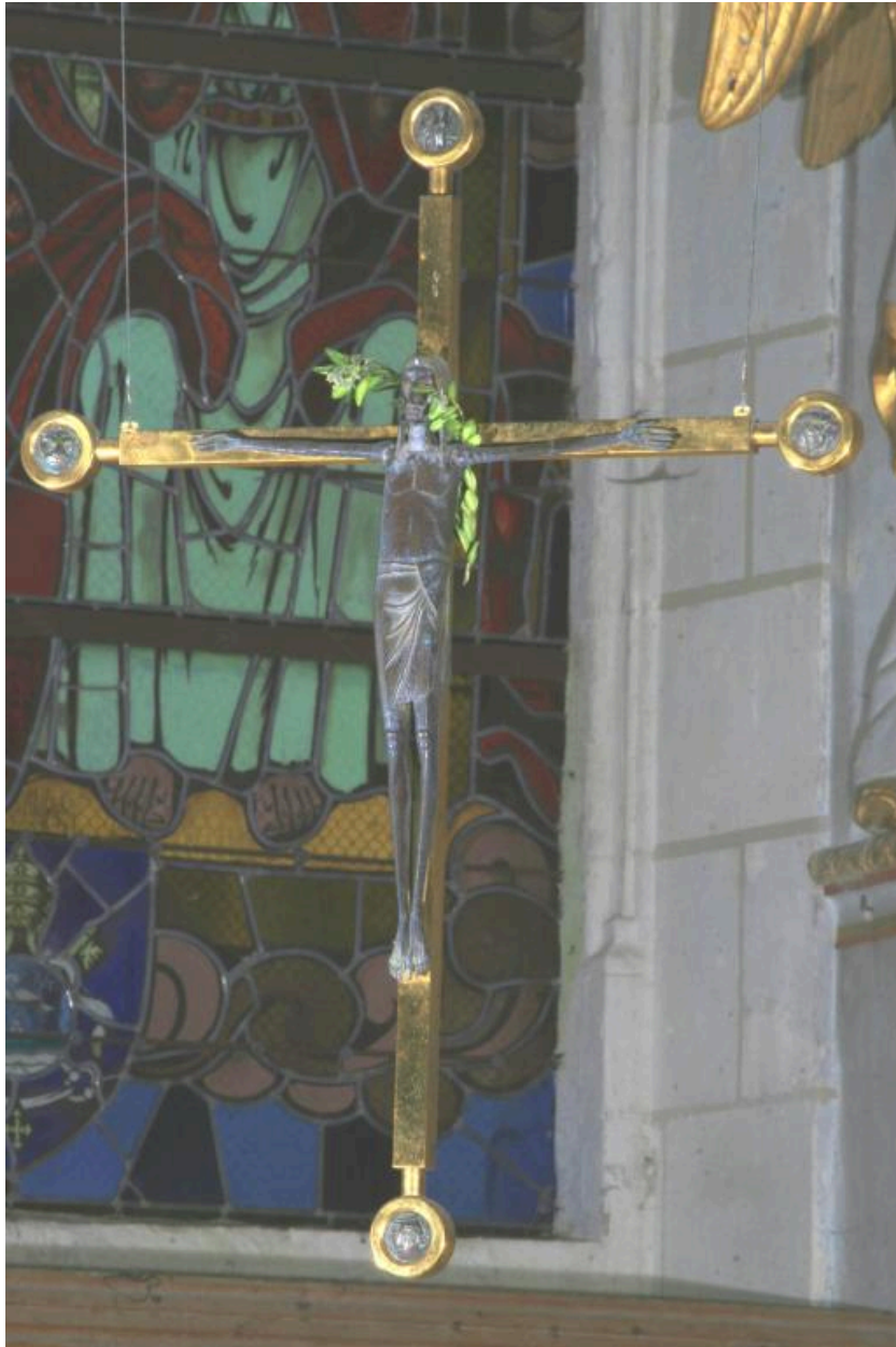
Crucifix du XXe siècle.