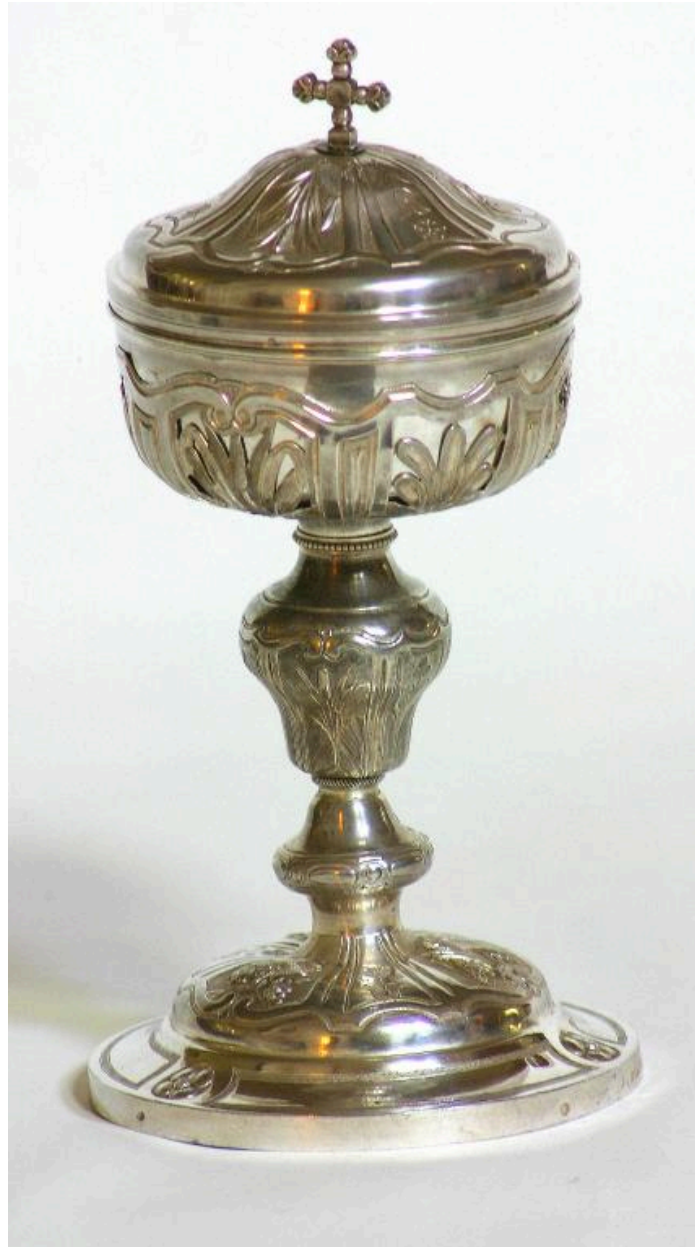
Ciboire en argent par les frères Naudin.