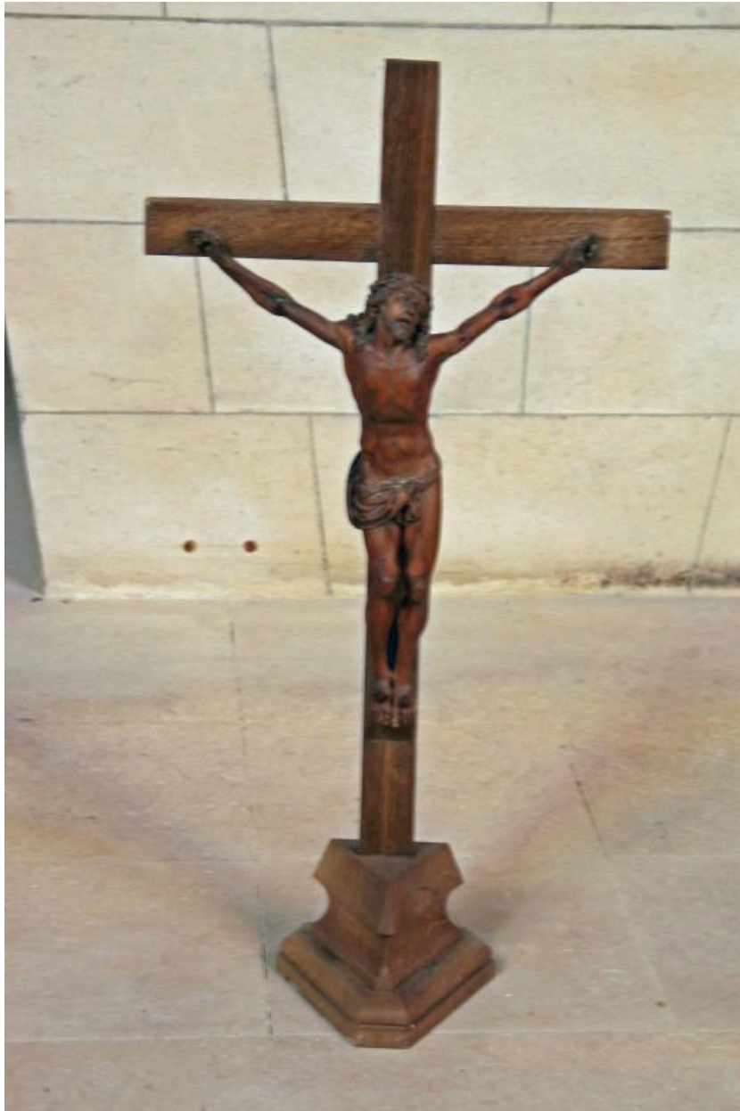
Croix d'autel en bois du XIXe siècle.