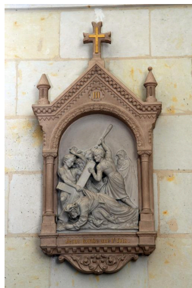
Chemin de croix.