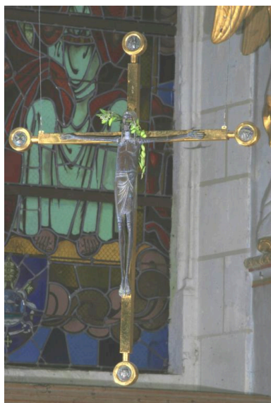
Crucifix du XXe siècle. IVR52_20087200762NUCA