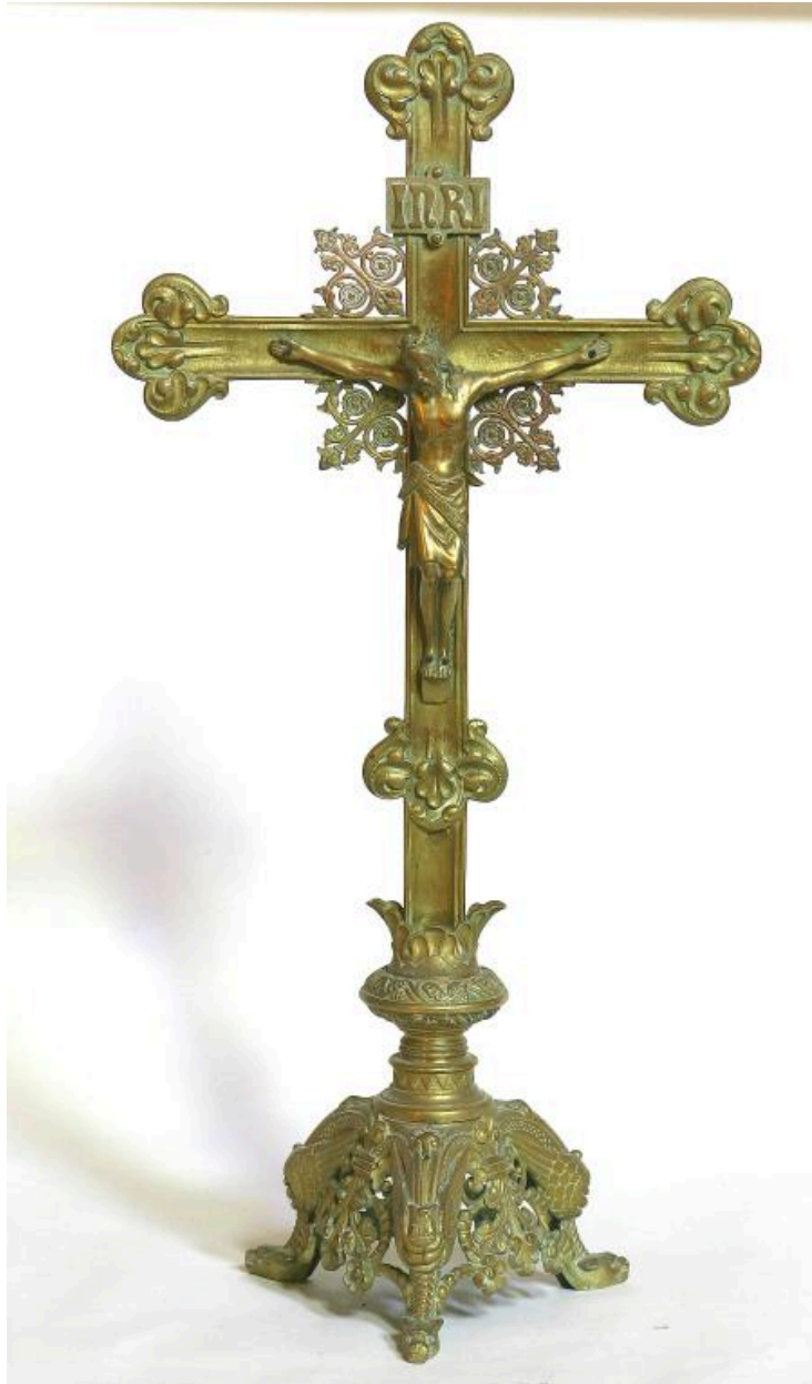
Croix d'autel en bronze doré de la fin du XIXe siècle.