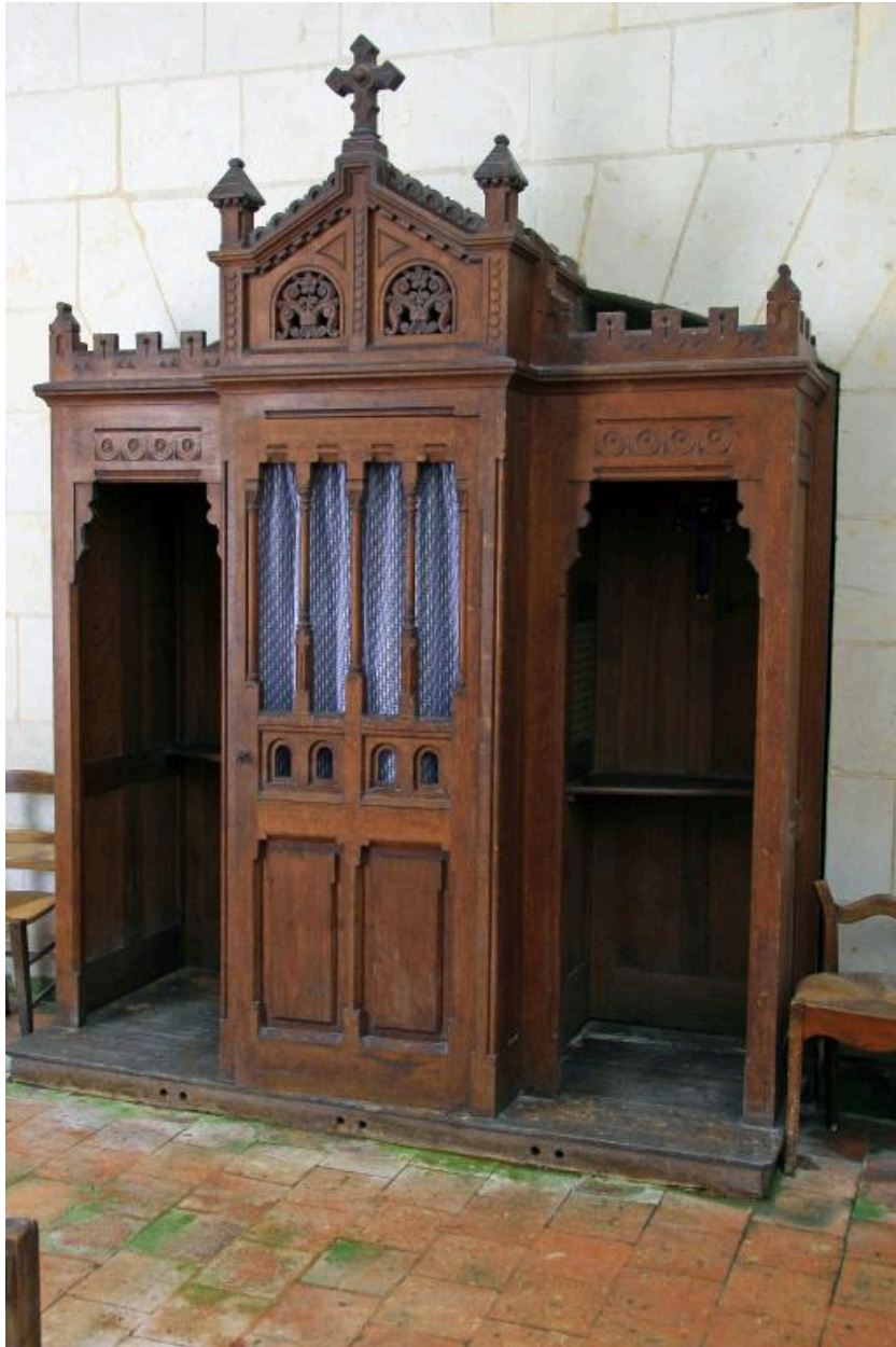
Confessionnal de la fin du XIXe siècle.