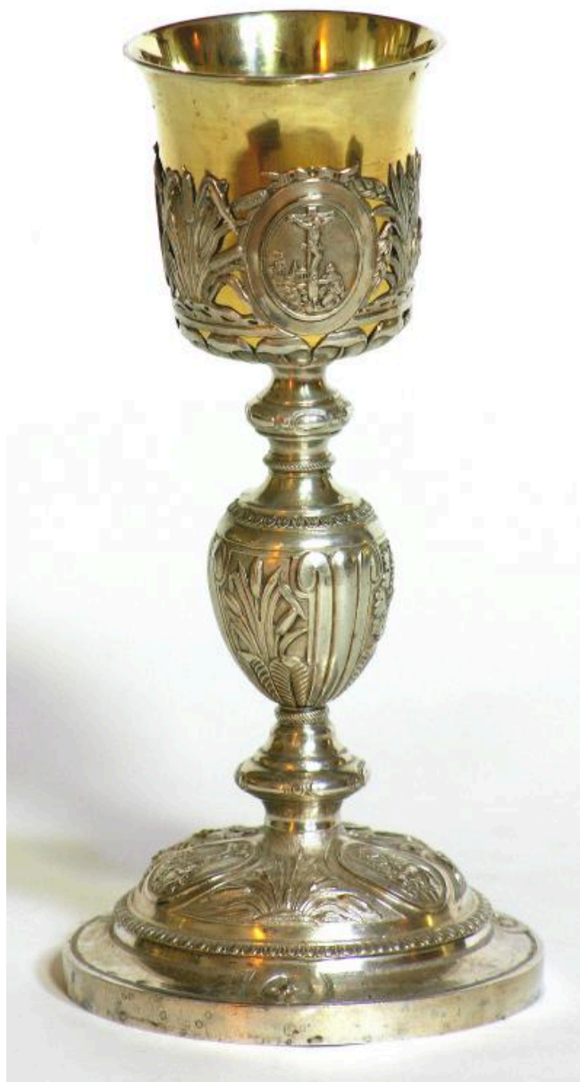
Calice en argent doré par les frères Naudin.