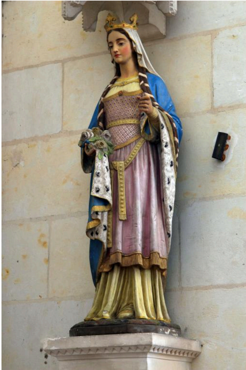
Sainte Elisabeth d'Hongrie.