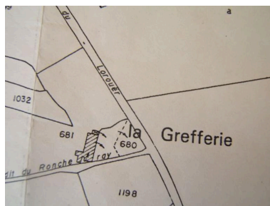
Extrait du plan cadastral de 1987. IVR52_20097201326NUCA