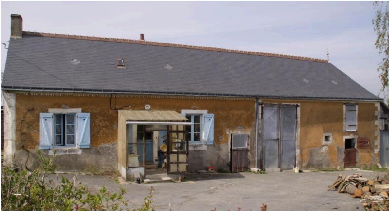
Ferme bloc à terre : façade antérieure sur cour.