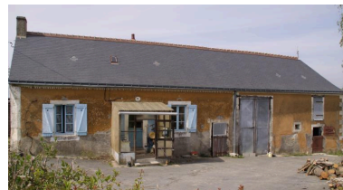
Ferme bloc à terre : façade antérieure sur cour. IVR52_20107200657NUCA