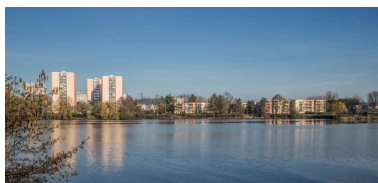
Vue du lac et du grand ensemble des Sablons depuis le sud. IVR52_20197200263NUCA