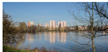
Vue du lac et des immeubles de la rive nord.