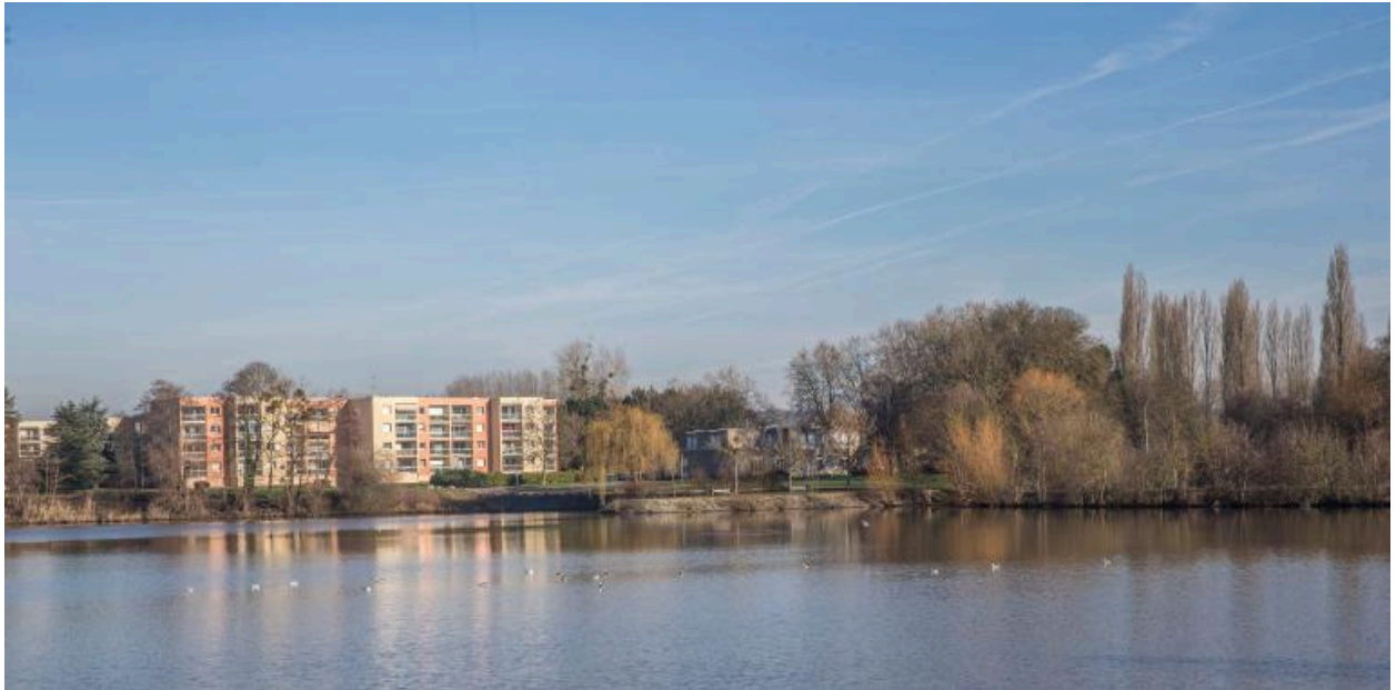
Vue du lac depuis la rive sud-ouest.