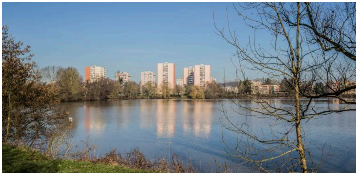
Vue du lac et des immeubles de la rive nord.