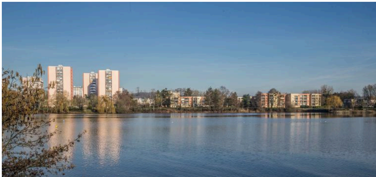
Vue du lac et du grand ensemble des Sablons depuis le sud.