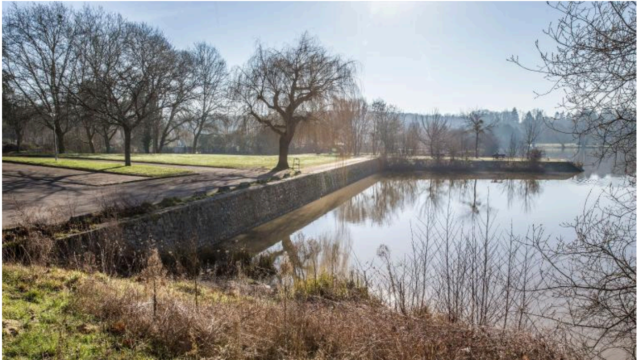
Vue de la jetée du lac depuis la rive nord.