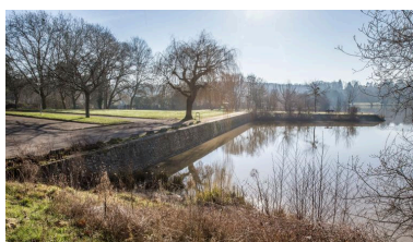
Vue de la jetée du lac depuis la rive nord.