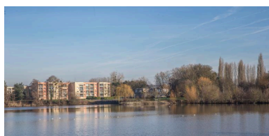
Vue du lac depuis la rive sud-ouest.