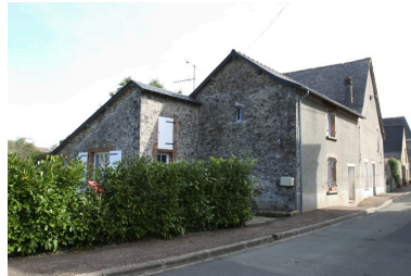
Vue depuis la rue. IVR52_20045303134NUCA