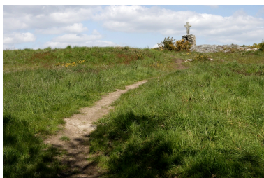
Vue de la croix depuis le bas de la butte de Sandun. IVR52_20084401409NUCA