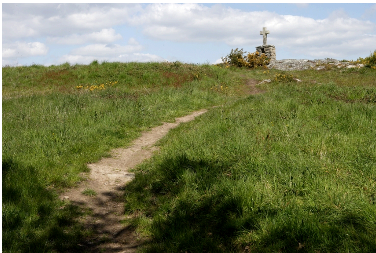
Vue de la croix depuis le bas de la butte de Sandun.