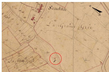
Extrait du plan cadastral de 1819, section F1. IVR52_20084404135NUCA