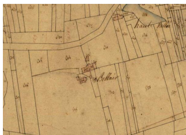
Bel Air. Plan cadastral (détail), 1827, section B2, parcelles 596 à 598. IVR52_20244900840NUCA