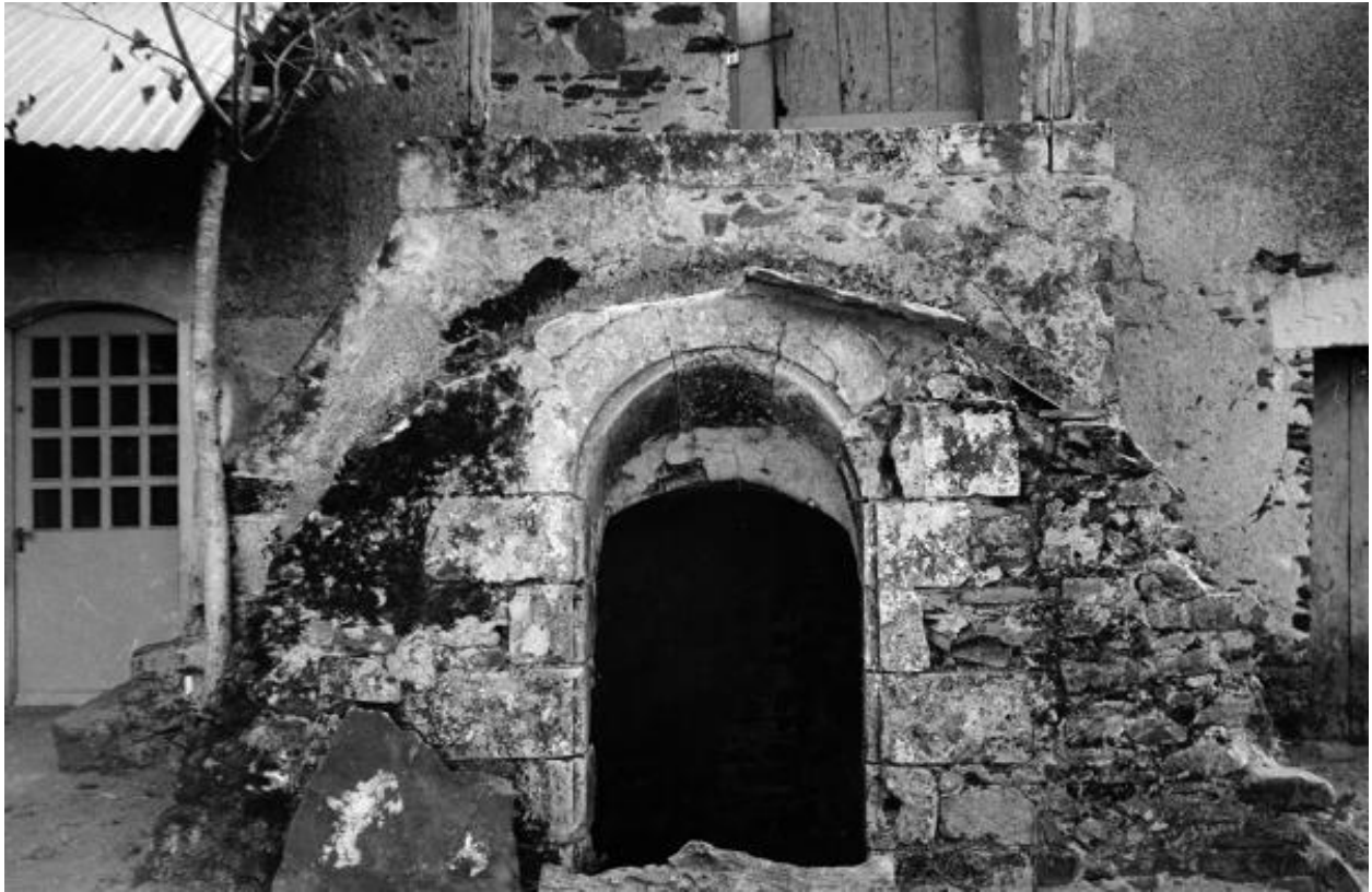
Enreé de cave et escalier extérieur, 1972.