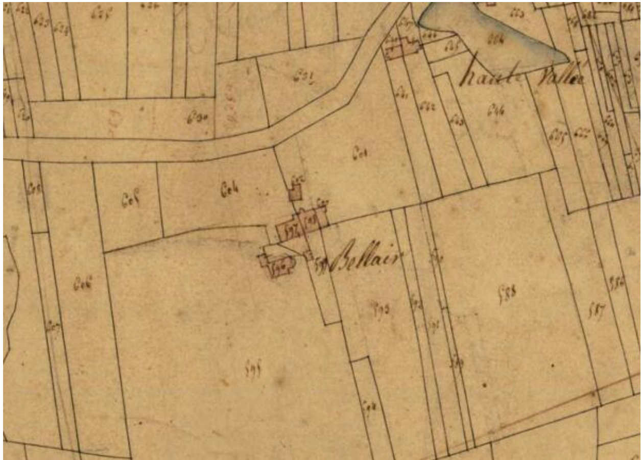
Bel Air. Plan cadastral (détail), 1827, section B2, parcelles 596 à 598. (AD Maine-et-Loire, 3 P 4/220/8).